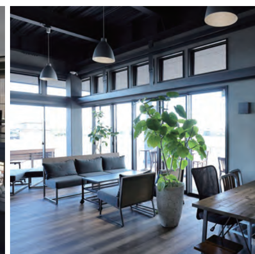
デッキに面したソファ席