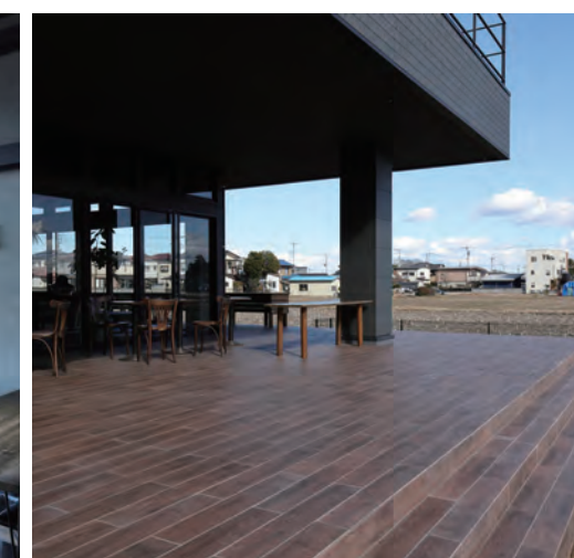
デッキには天然木の雰囲気再現した濃色の木調タイルを採用。癒しのひとときを過ごすことができる。