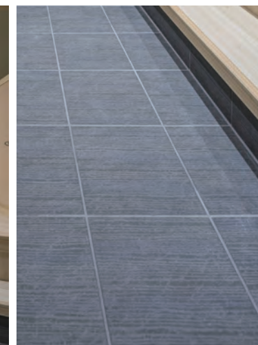
和室 玄関床ディテール