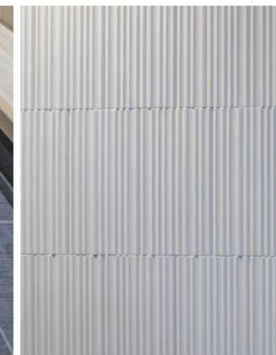
メインホワイエ 内装壁ディテール