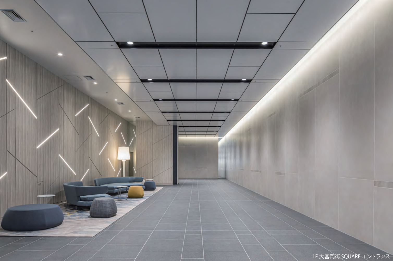
1F 大宮門街 SQUARE エントランス