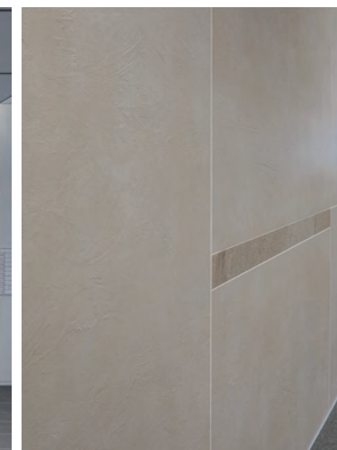
エントランス 内装壁ディテール