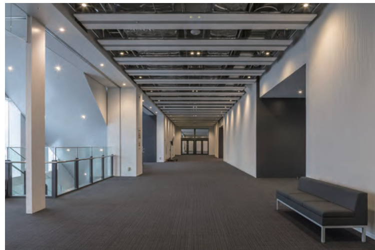
メインホワイエ 全景