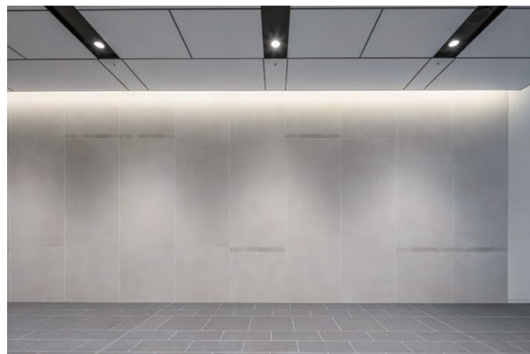
エントランス 内装壁面全景