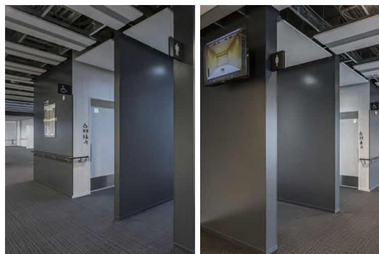
6F 大ホールトイレ入り口まわり

濃灰と白のインテリアにマッチしたシンプルなトイレサインを通路に張り出す形で設置。バリアフリートイレ横には設置設備をピクトサインで表示している。