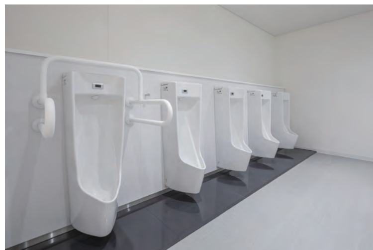
6F 大ホール 男性用トイレ

便器は床の清掃性を高める壁掛式を採用。小便器下には尿垂れを考慮した汚垂石を設置している。子ども連れでも安心して来訪できるよう、室内にはベビーキープやおむつ交換台を備え、混雑時も利用しやすいよう、おむつ交換台はブース外に設置している。