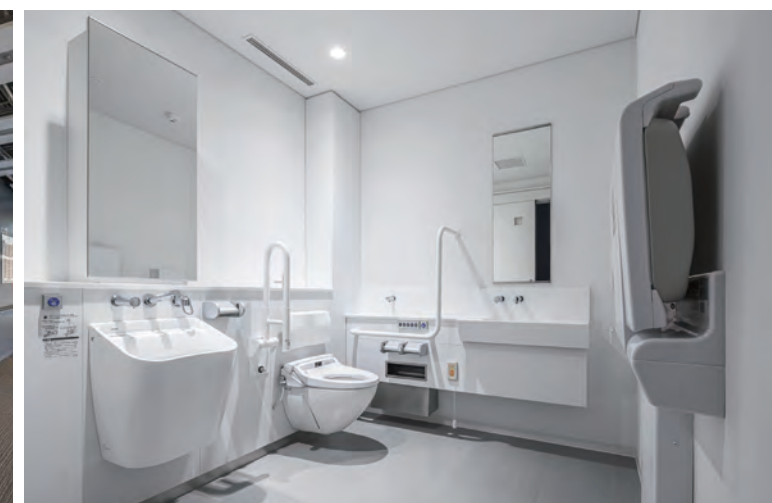
6F 大ホール バリアフリートイレ

男性用トイレと女性用トイレの近くにそれぞれ1か所ずつ設置。ライニングとバックガードの高さが揃い、すっきりとした空間になっている。