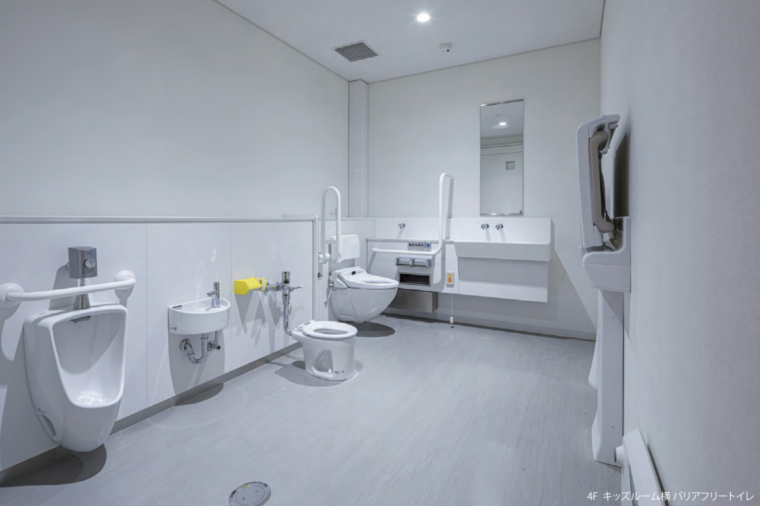
4F キッズルーム横 バリアフリートイレ