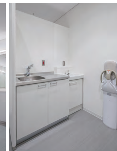
4F キッズルーム横 ベビー休憩室