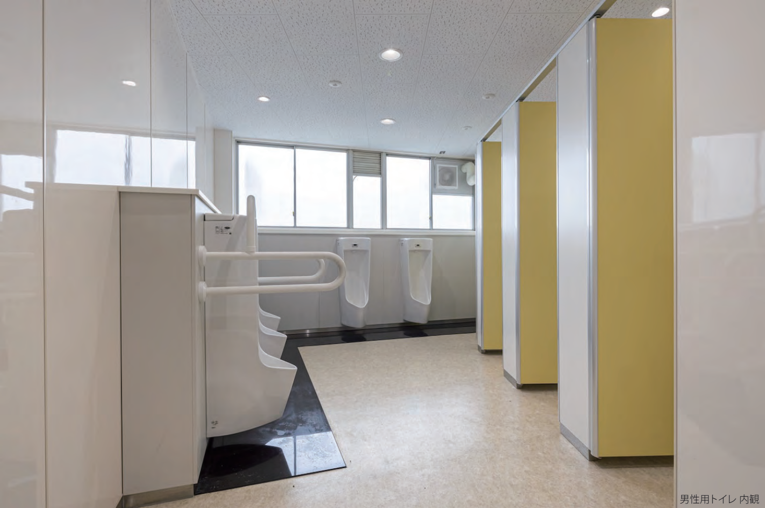
男性用トイレ 内観