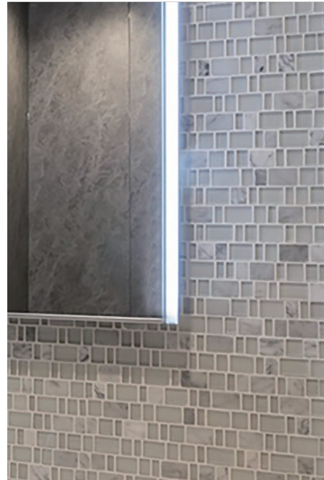
1F 一般トイレ 内装壁タイル デティール