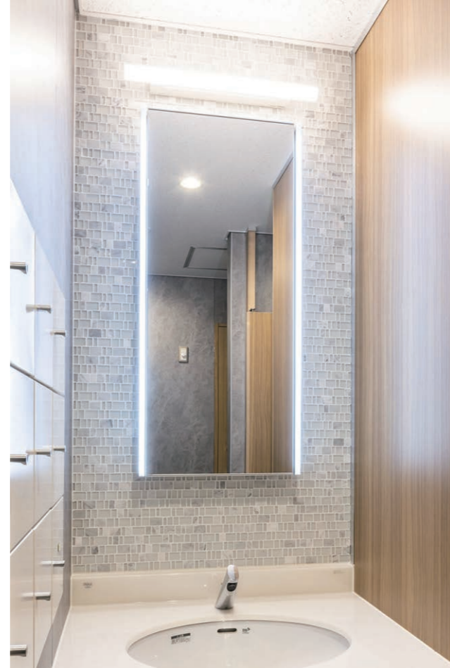
1F 一般トイレ 内装壁タイル