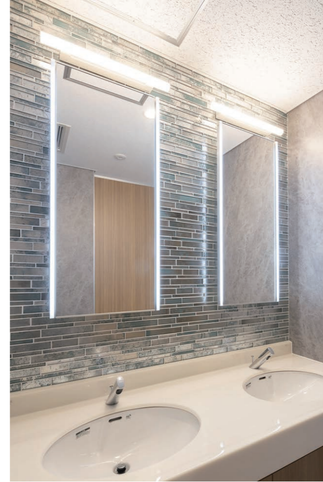
2F 一般トイレ 内装壁タイル