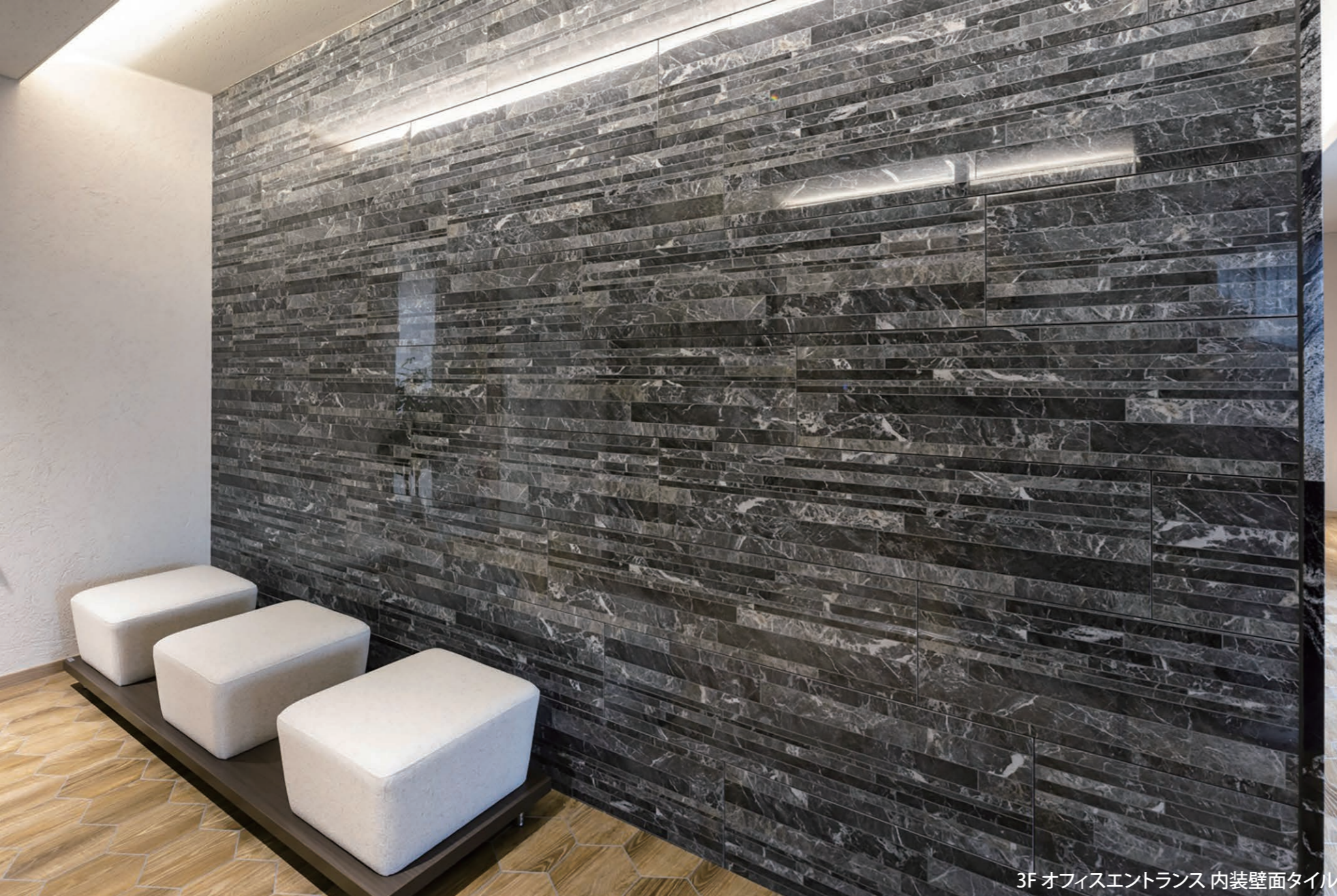
3F オフィスエントランス 内装壁面タイル