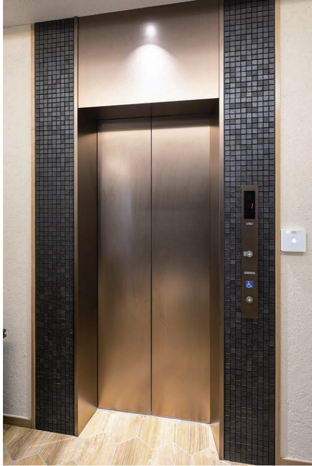
エレベーターホール 内装壁タイル