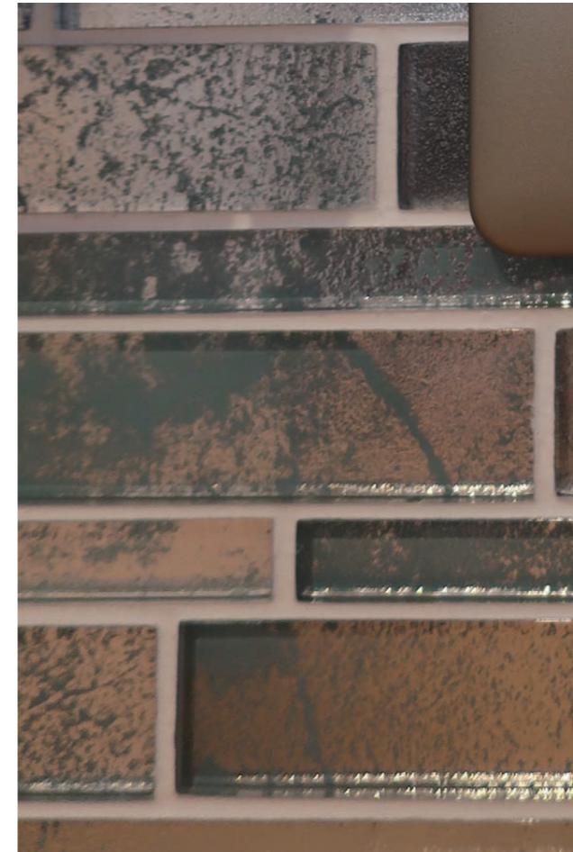
2F 一般トイレ 内装壁タイル デティール