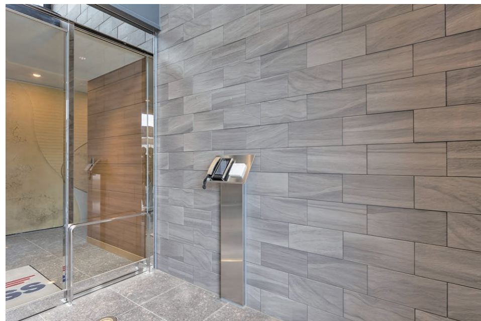
1F エントランス 内装壁タイル