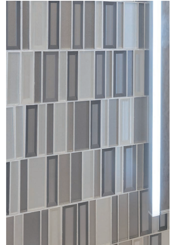
3F 一般トイレ 内装壁タイル デティール