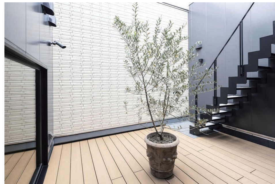
3F ルーフテラス 外装壁タイル