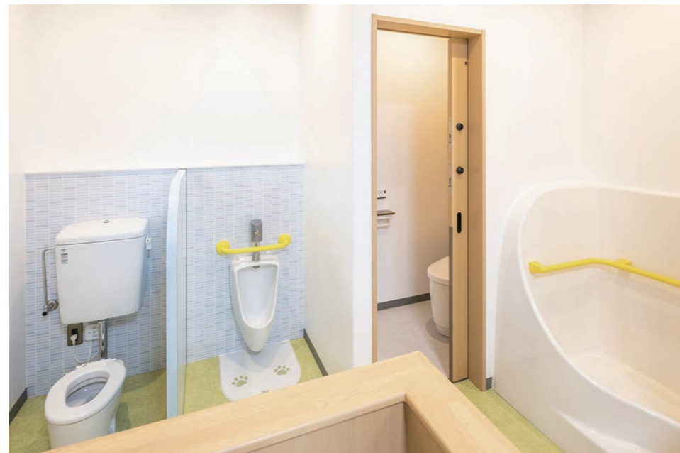
2F キッズルーム 幼児用大便器・幼児用小便器・幼児用バス