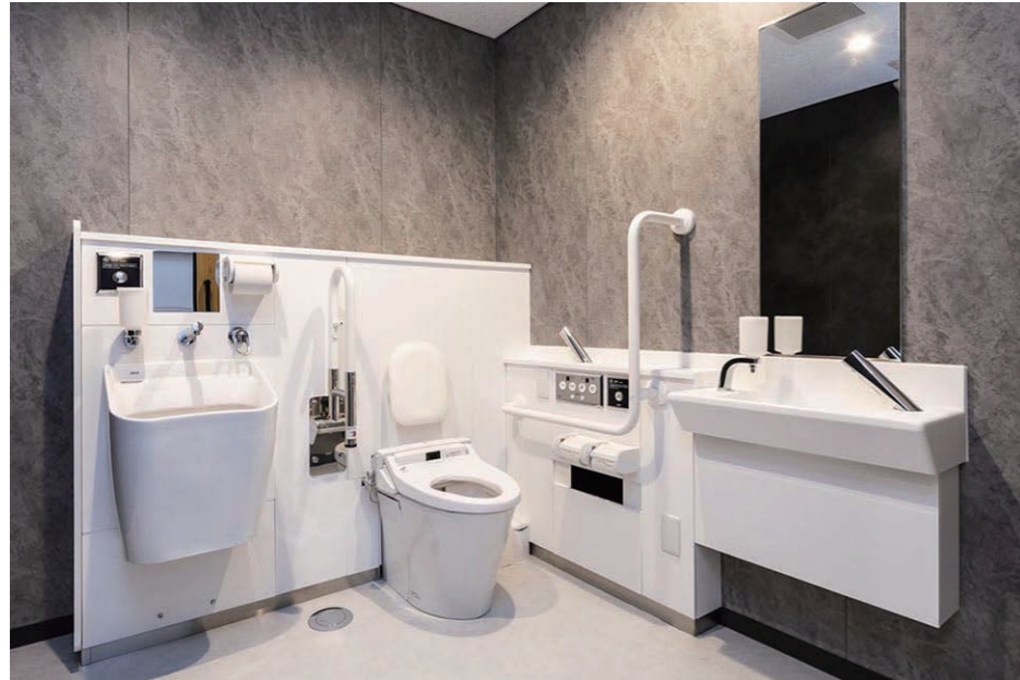
1F バリアフリートイレ