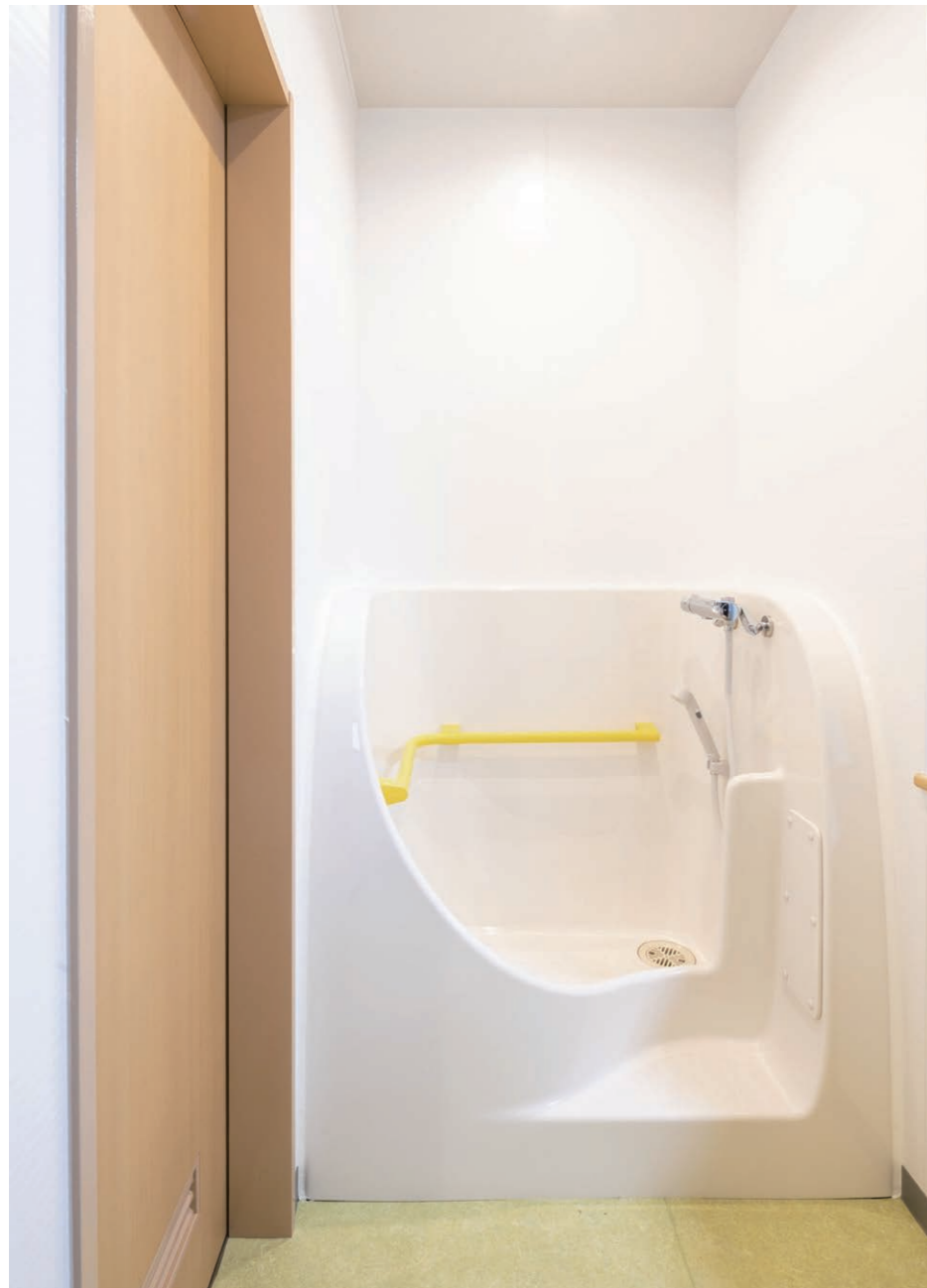
2F キッズルーム 幼児用バス