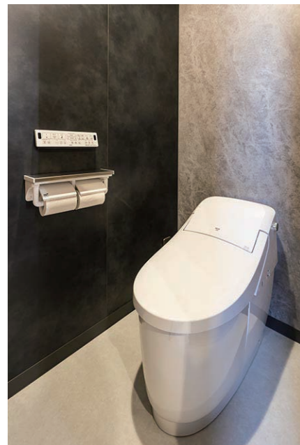
2F 男性用トイレ 大便器