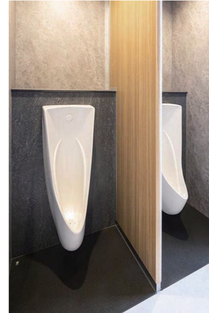
2F 男性用トイレ 小便器