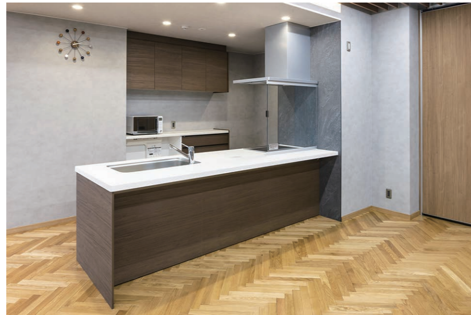
2F 食堂 キッチン