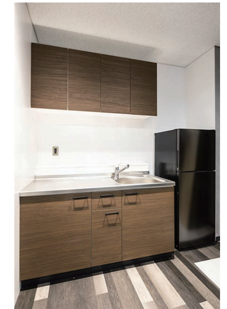
1F ドライバースルーム キッチン