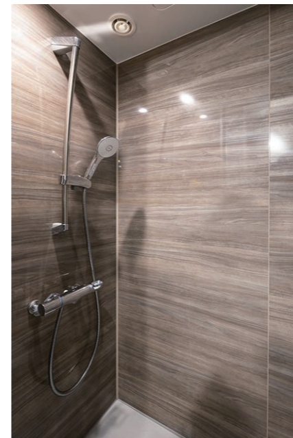
2F ドライバーズルームシャワーブース