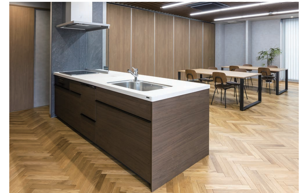
2F 食堂 キッチン