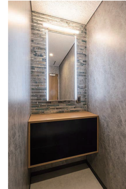
2F 女性用トイレ パウダールーム