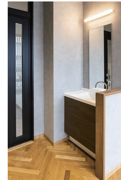
2F 食堂 洗面