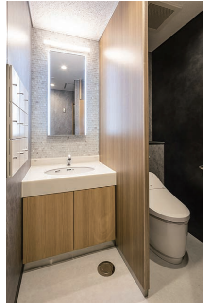
1F 男性用トイレ 洗面・大便器