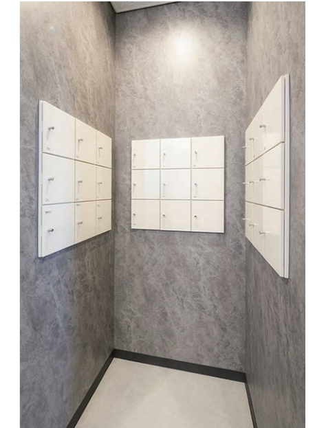
3F 女性用トイレ ミニロッカー