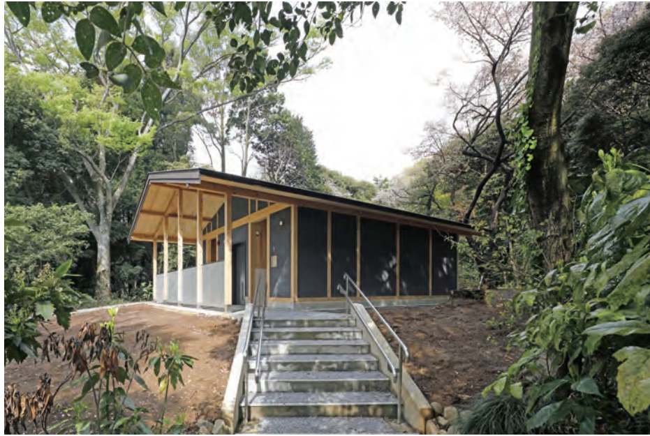
階段側アプローチ