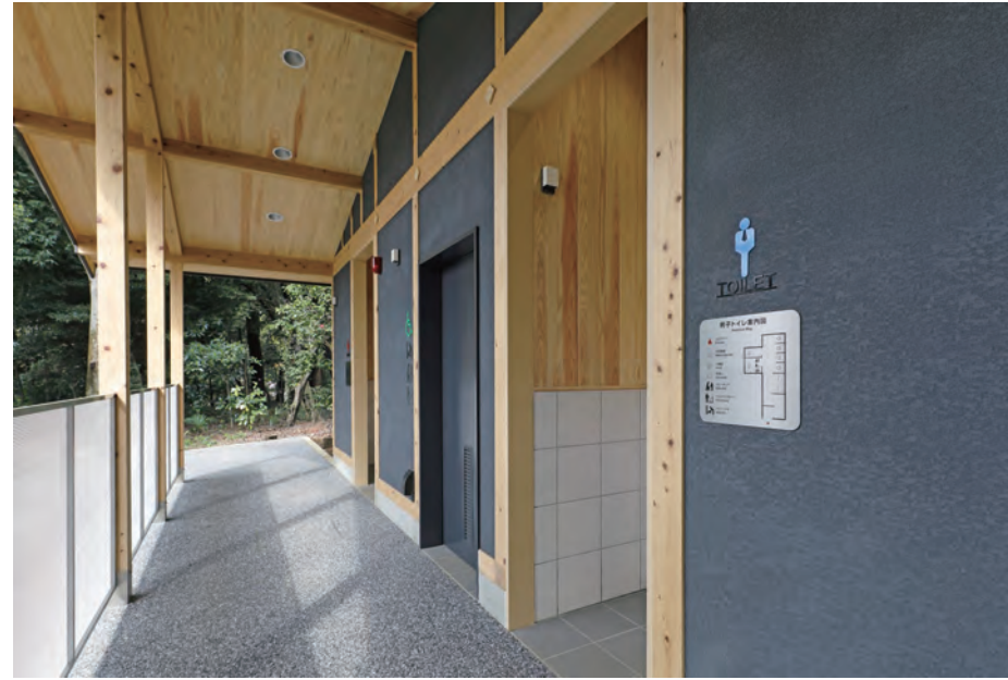
トイレ入り口まわり