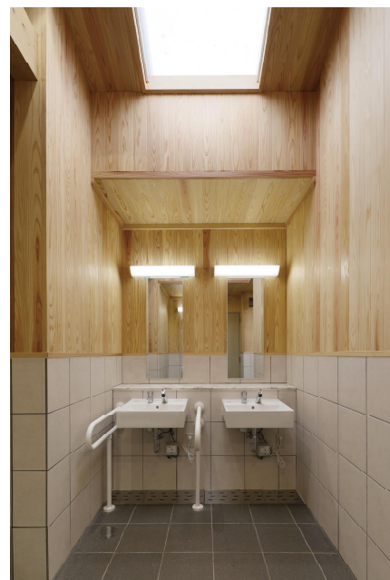
女性用トイレ 洗面器

明治時代の代表的近代西洋庭園であり、庭園鑑賞や自然観察、写生など、さまざまな目的で幅広い世代に利用される国民公園。