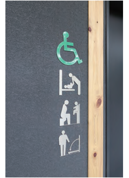
バリアフリートイレサイン・ピクトサイン