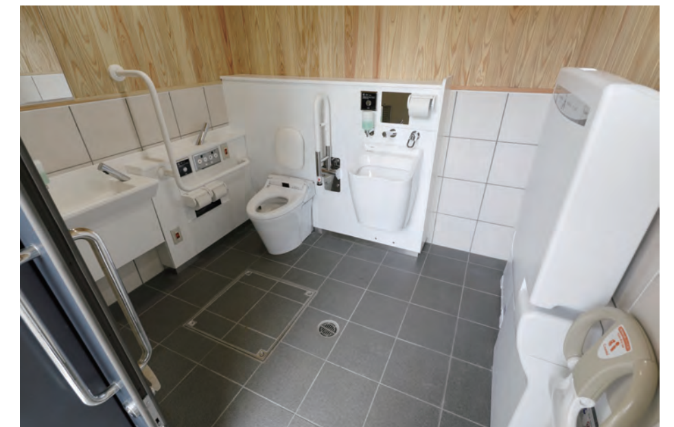
バリアフリートイレ