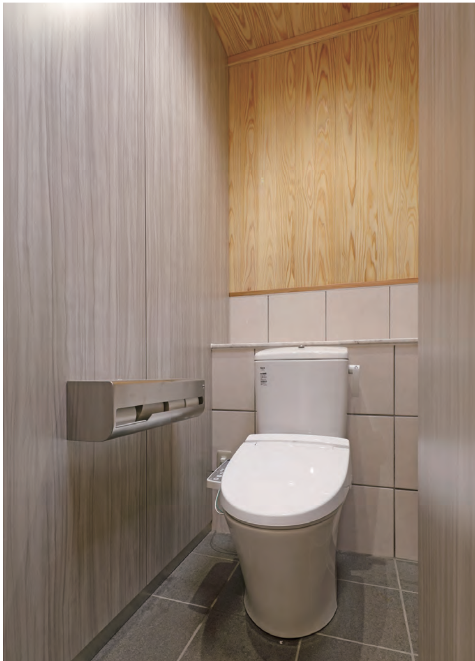
女性用トイレ 大便器(レジリエンストイレ)