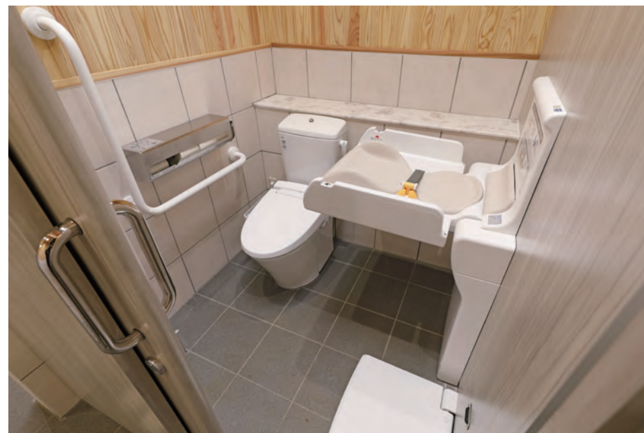
女性用トイレ 広めブース