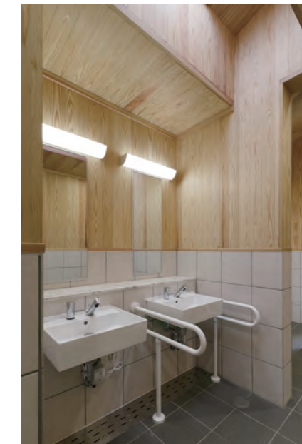
男性用トイレ 洗面器