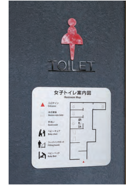
女性用トイレサイン・トイレ案内図