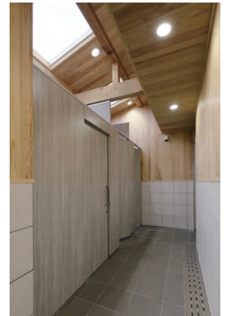
窓からの光が差し込む明るい空間。