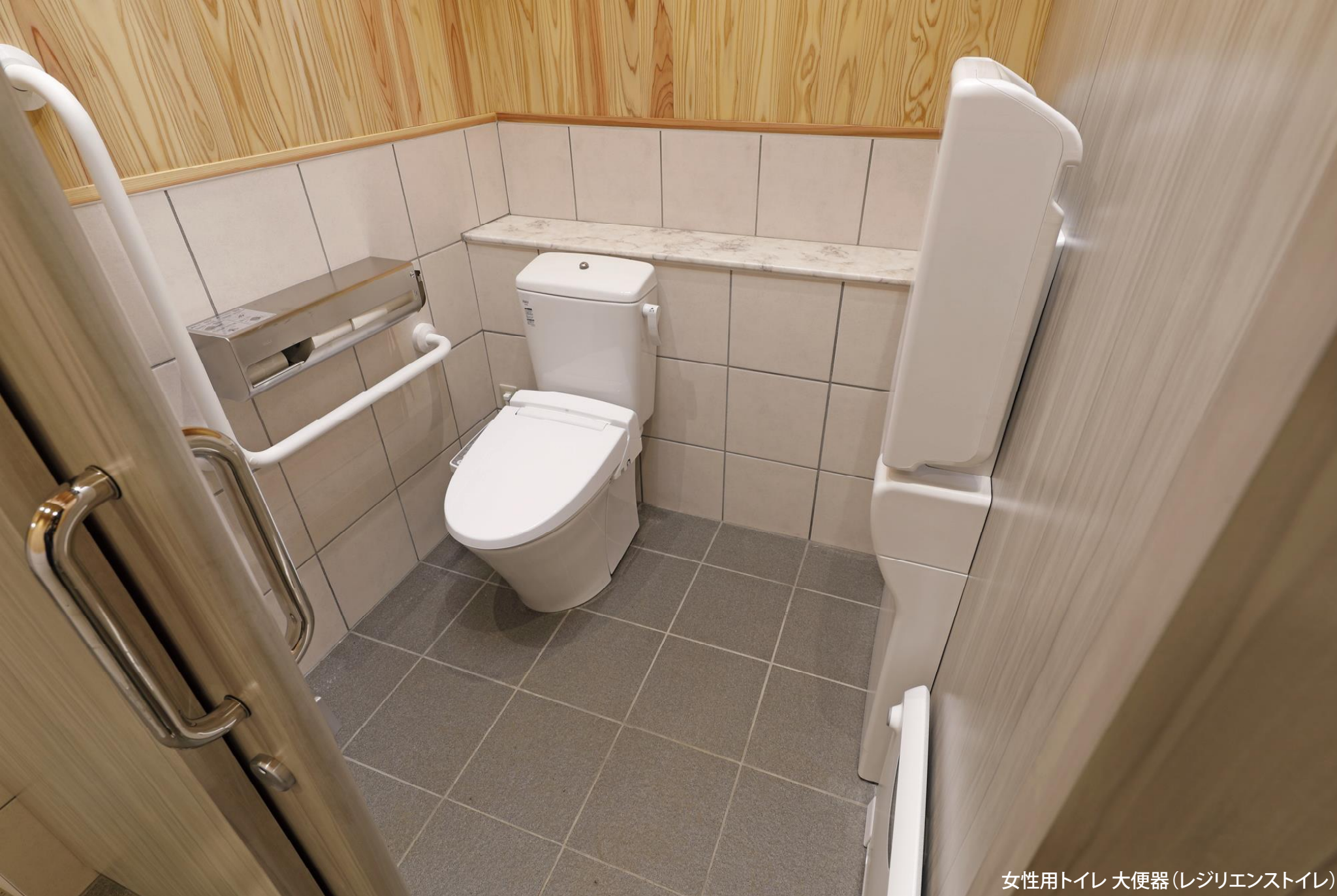
女性用トイレ 大便器(レジリエンストイレ)

明治時代の代表的近代西洋庭園であり、庭園鑑賞や自然観察、写生など、さまざまな目的で幅広い世代に利用される国民公園。