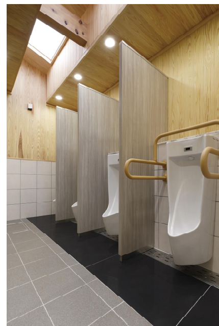
男性用トイレ 小便器