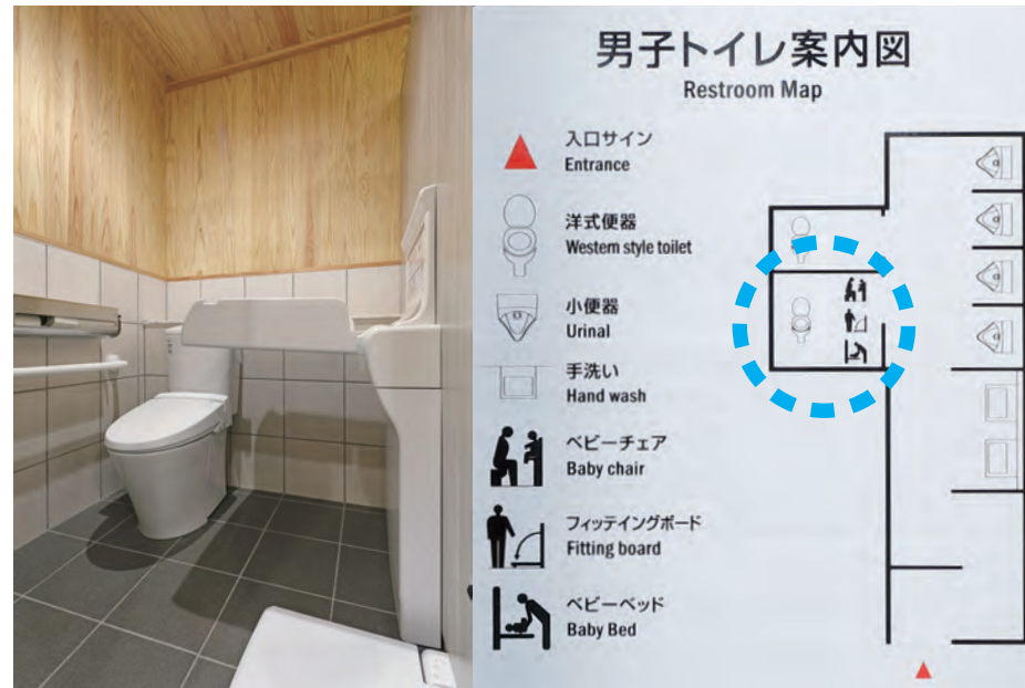
幼児用器具を備えた広めブースを男性用トイレ・女性用トイレともに設置。