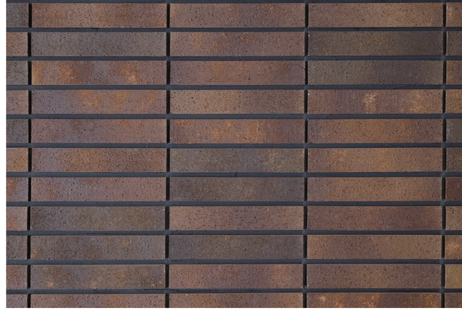
エントランス壁面 外装壁タイル デイテール