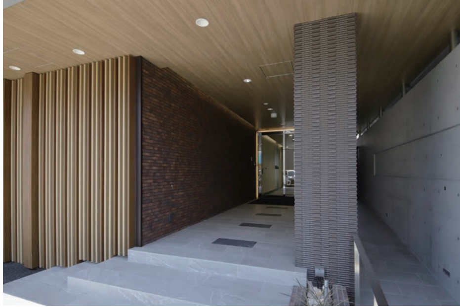
エントランス 外装壁面