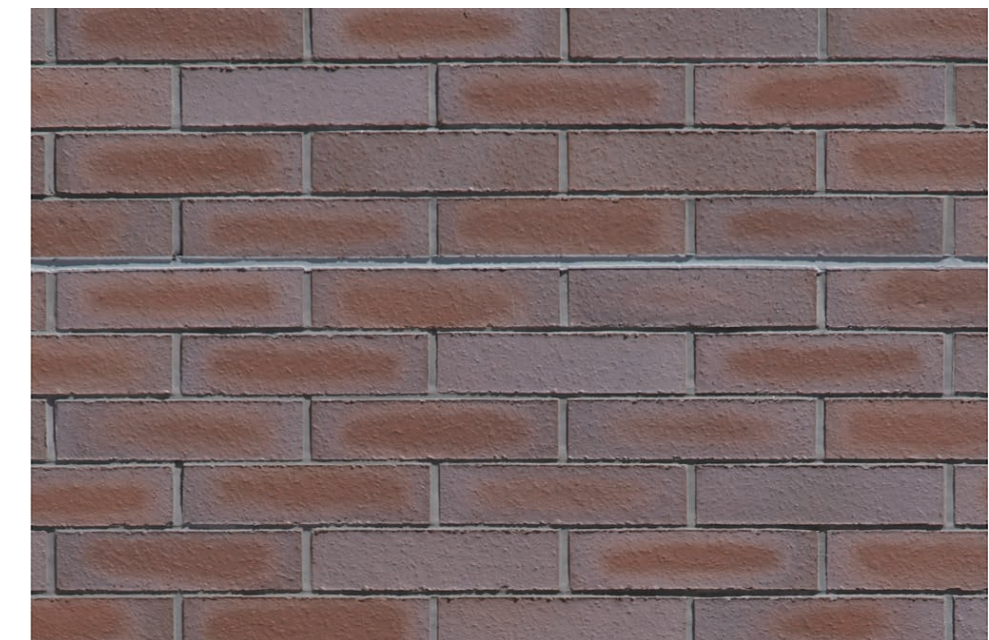
外装壁タイルディテール