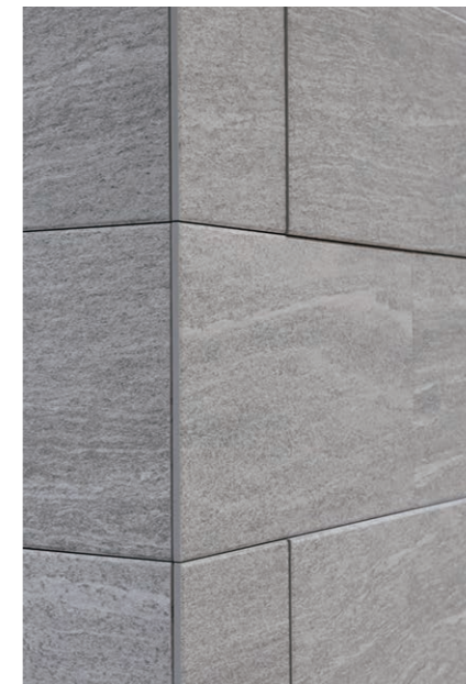
内装壁タイル デイテール