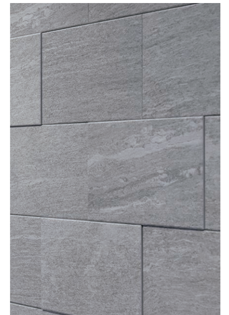
内装壁タイル デイテール