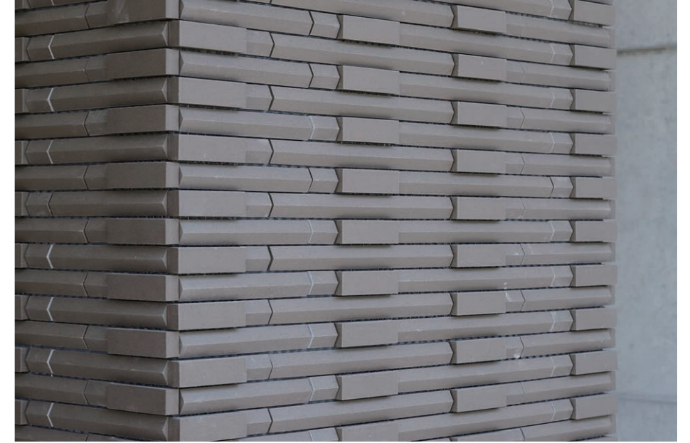
エントランス柱 外装壁タイル デイテール