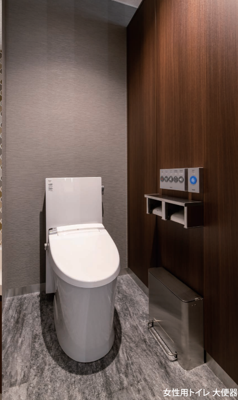
女性用トイレ 大便器

社会の「食」を支え続けてきた総合厨房機器メーカーの事業所トイレを全面リニューアル。