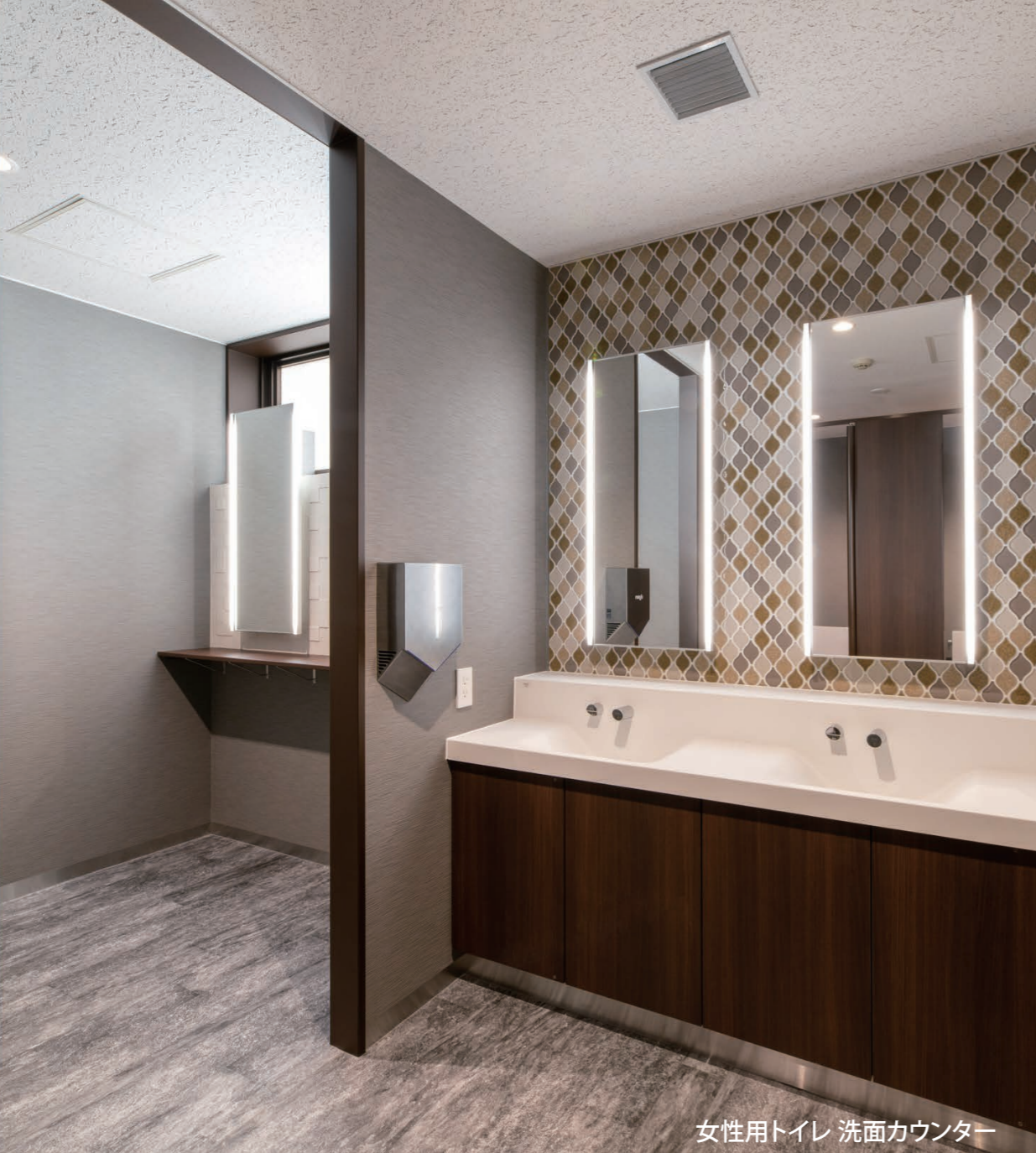
女性用トイレ 洗面カウンター