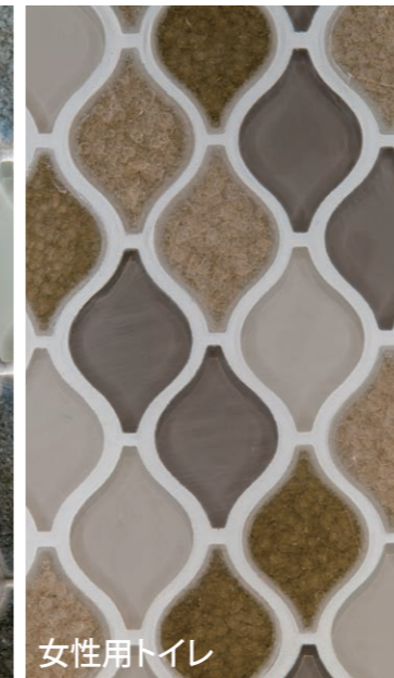
水濡れを気にせず小物を置けるシェルフや、汚れにくく非接触で衛生的な壁付水栓により快適性が向上。鏡背面のインテリアモザイクが空間に華を添えている。