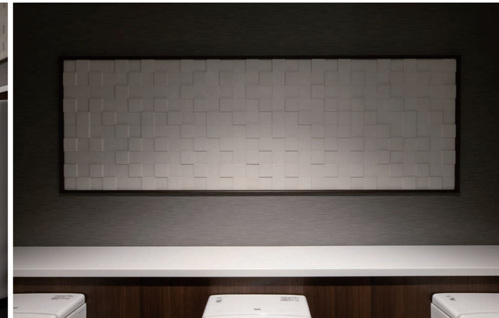
小便器は足元が細くまたぎやすいフォルムで、突き出た先端形状が尿垂れを軽減。壁面を美しく演出する「エコカラットプラス」は調湿・脱臭効果も備えている。