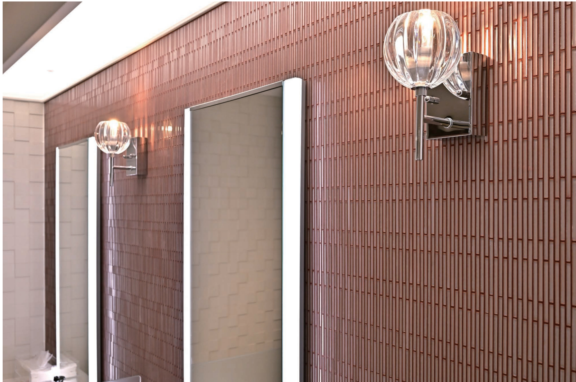
5mm幅の極細ボーダー形状の白いガラスに臙脂(えんじ)色のカラー目地を合わせ、繊細で華やかなトイレ空間を演出している。