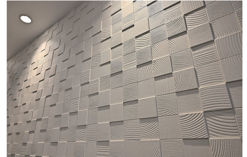
パールのような光沢と表面の陰影により、自然で穏やかな環境を演出。