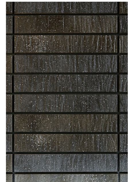
豊かな表情を生み出す釉だれ。