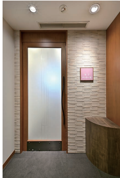
ロッカー室入り口 内装壁面