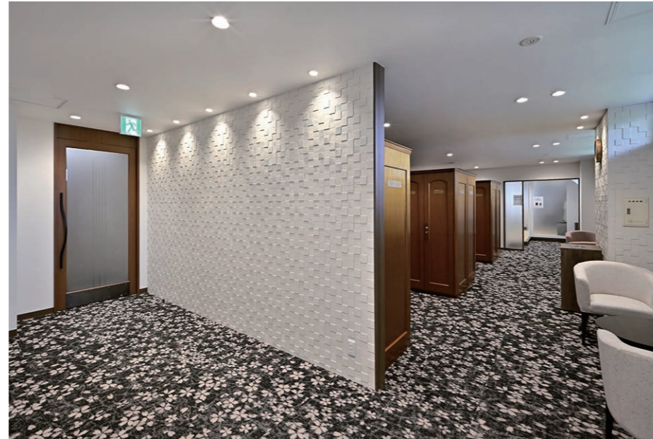
ロッカー室 内装壁面