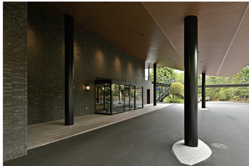
エントランスポーチ 外装壁面

大阪池田市から程近いロケーションと美しい景観が魅力の、創業63年の歴史を刻む名門ゴルフ倶楽部。