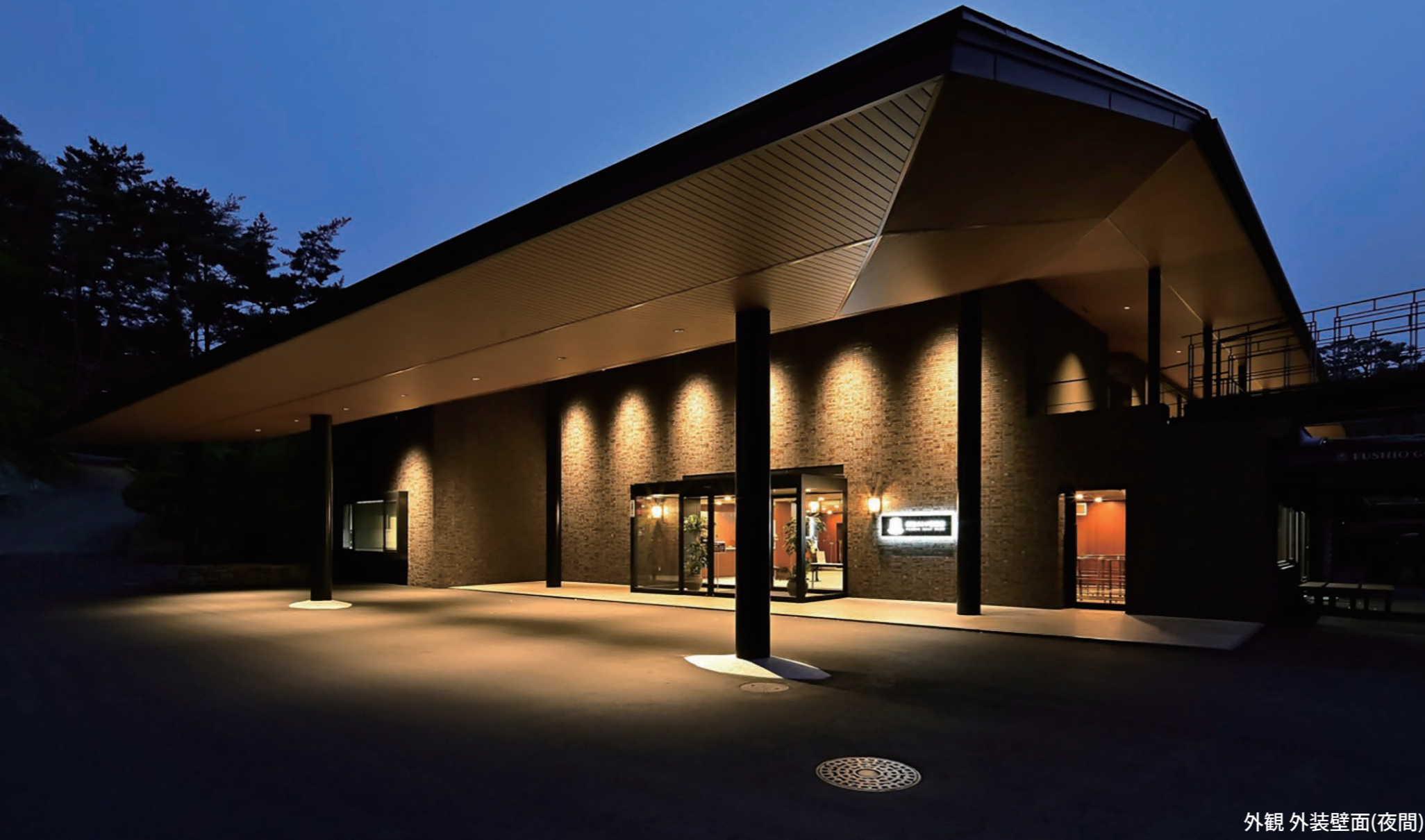
外観 外装壁面(夜間)

外装壁タイル アステルト ： HAL-40B/ASL-3 内装壁機能建材 エコカラットプラス カームウッド ： ECP-2515NET/CWD2N 内装壁機能建材 エコカラットプラス パールマスクII ： ECP-60NET/PMK11 内装壁ガラスモザイクスティックガラス ： DTL-755P1/SGL-1