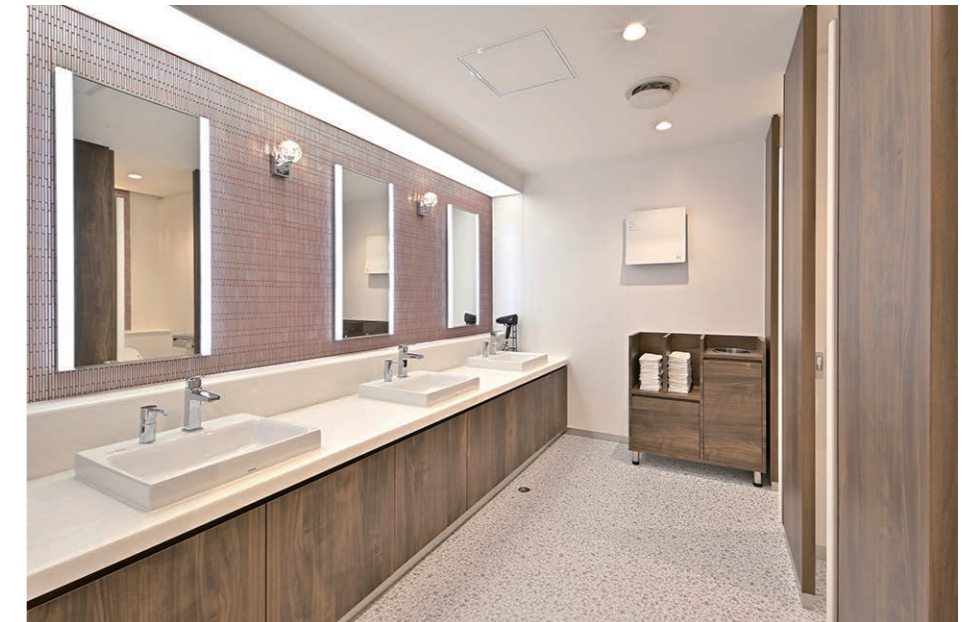
女性用トイレ 内装壁面