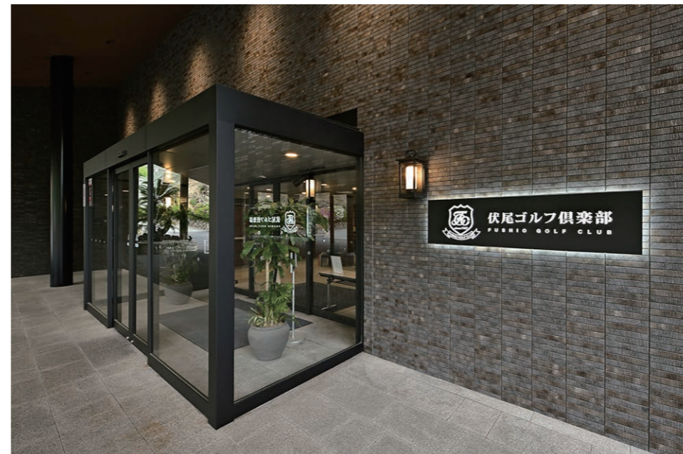
エントランス 外装壁面