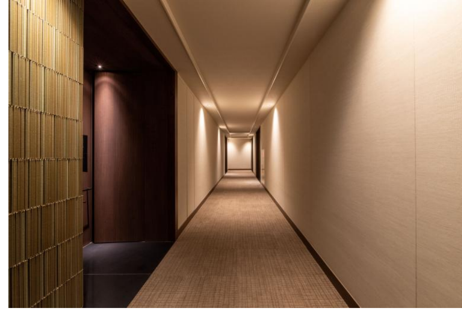
2F 廊下 内装壁タイル