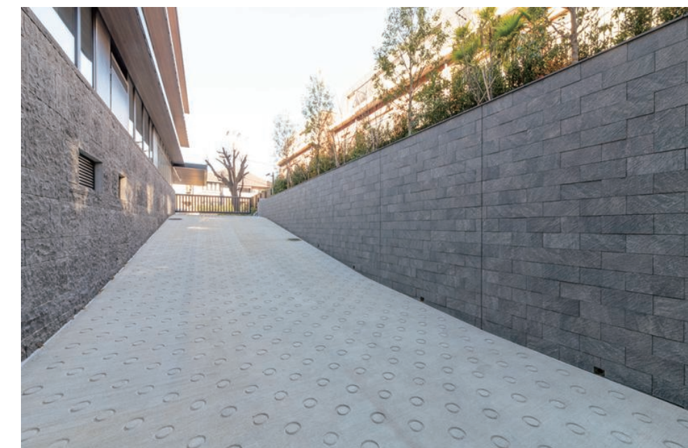
駐車場入り口通路 外装壁タイル