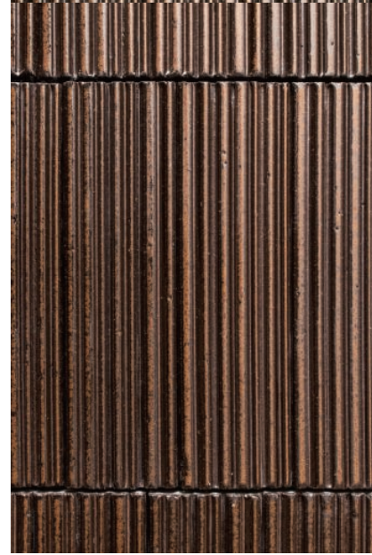
1F 内装壁タイル デイテール