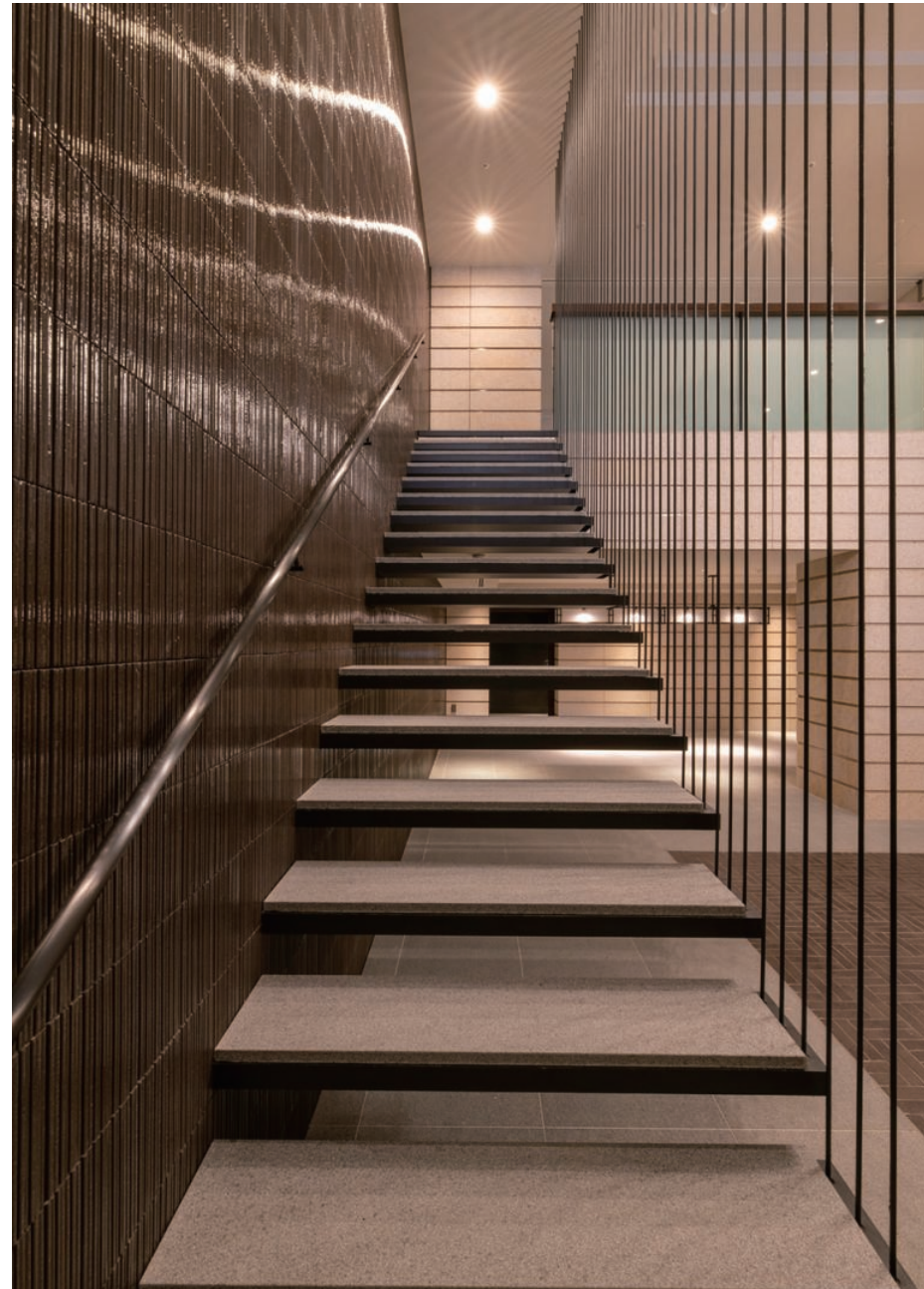
ラウンジ 階段 内装壁タイル