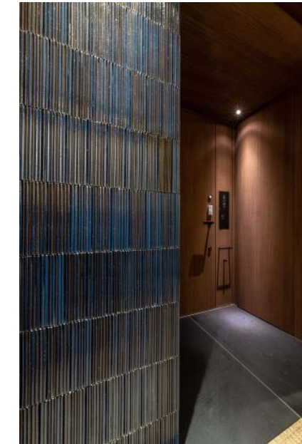
3F アルコーブ 内装壁タイル