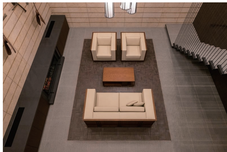
ラウンジ 内装壁・床タイル

上目黒の緑豊かな高台に建つ低層の集合住宅。そのインテリアにはデザインコンセプト「ヴィンテージモダン」を表現する素材として随所にタイルが採用。