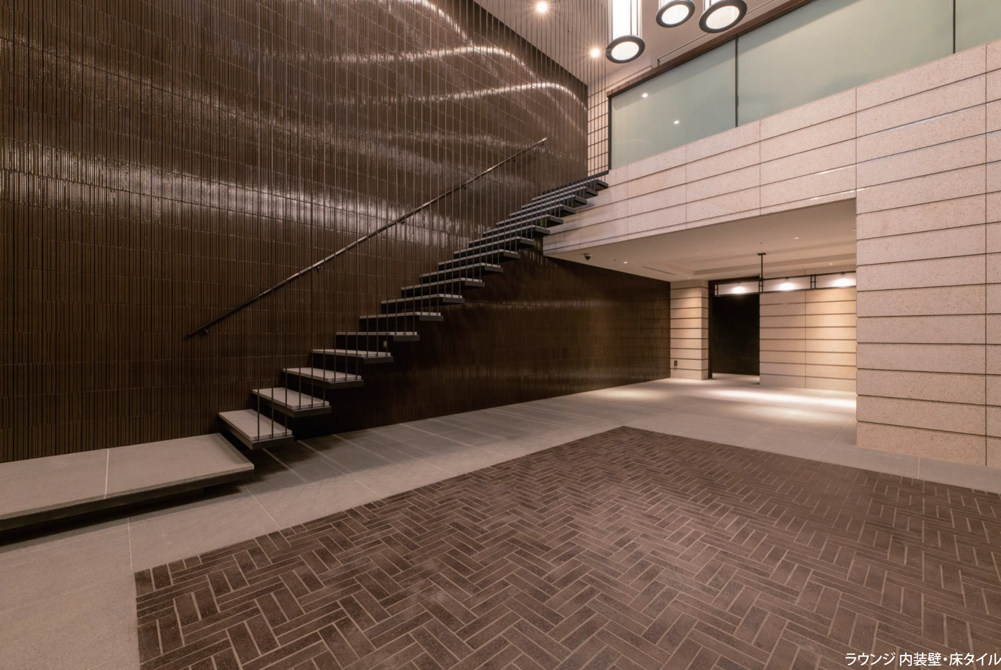
ラウンジ 内装壁・床タイル

内装床タイル：PTI-2360/14、IPF-600/TMB-11 外装壁タイル：HAL-420/STC-NQ2