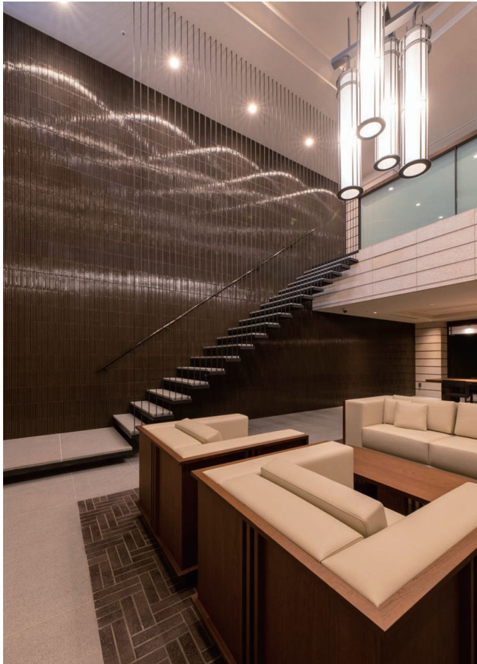
ラウンジ 内装壁・床タイル