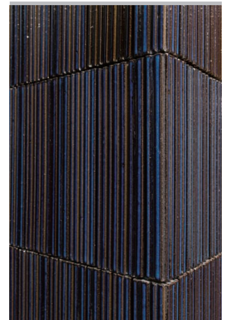
3F 内装壁タイル コーナー部