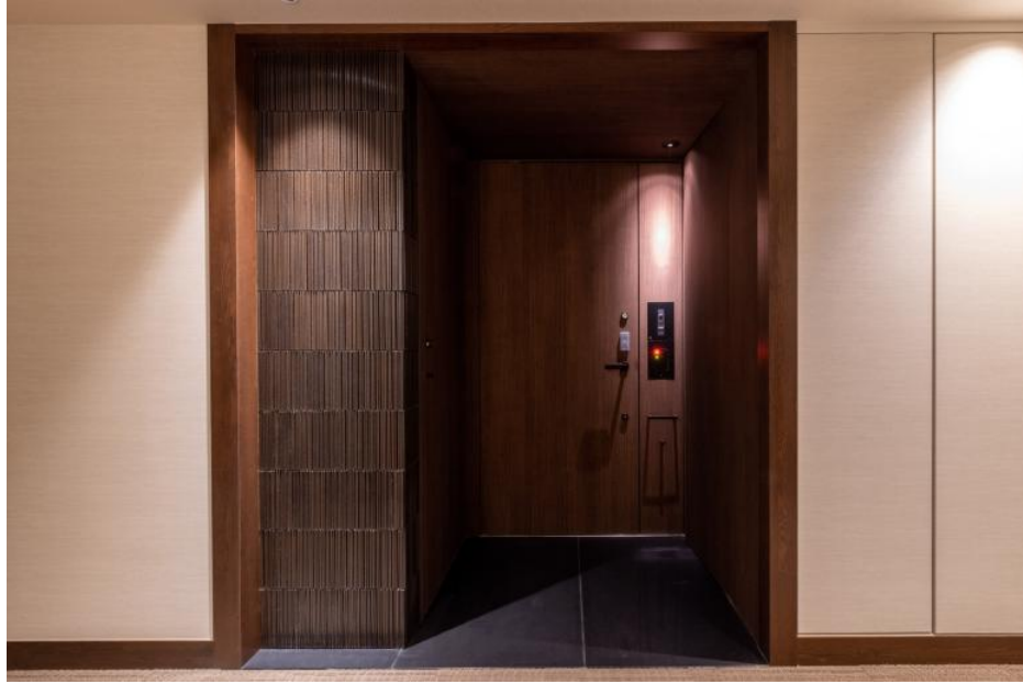
1F アルコーブ 内装壁タイル