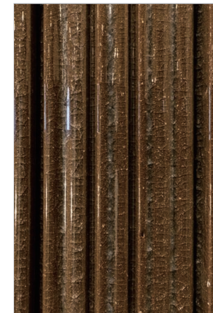
ラウンジ 内装壁タイルデイテール