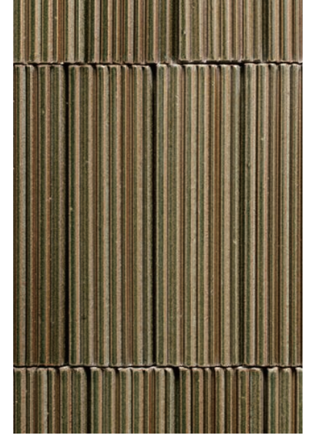
2F 内装壁タイルデイテール