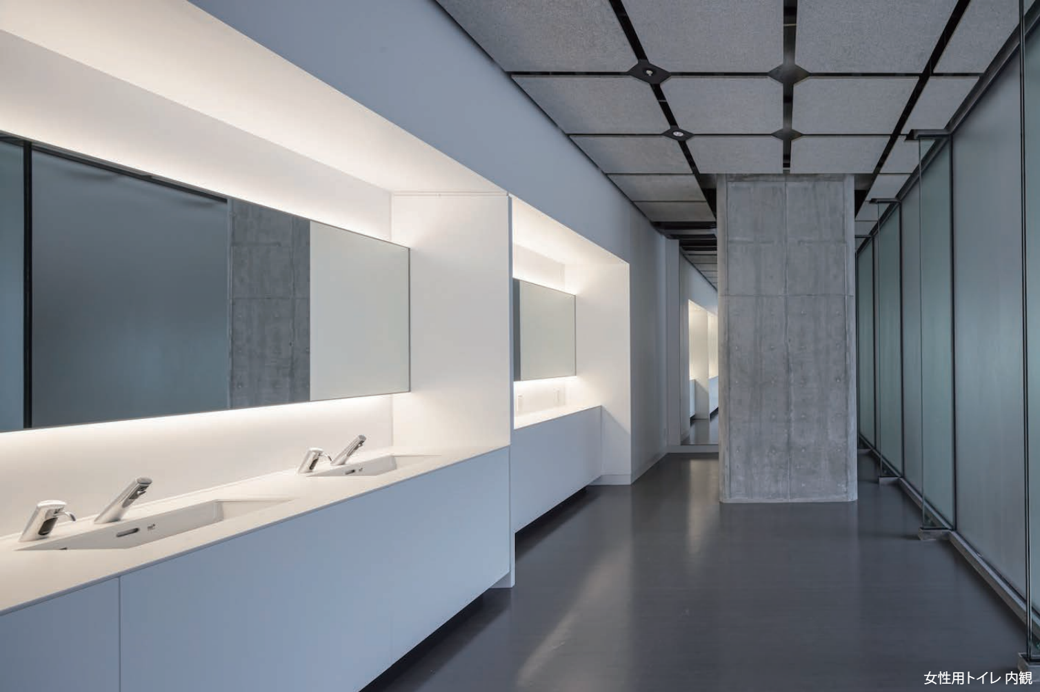
女性用トイレ 内観