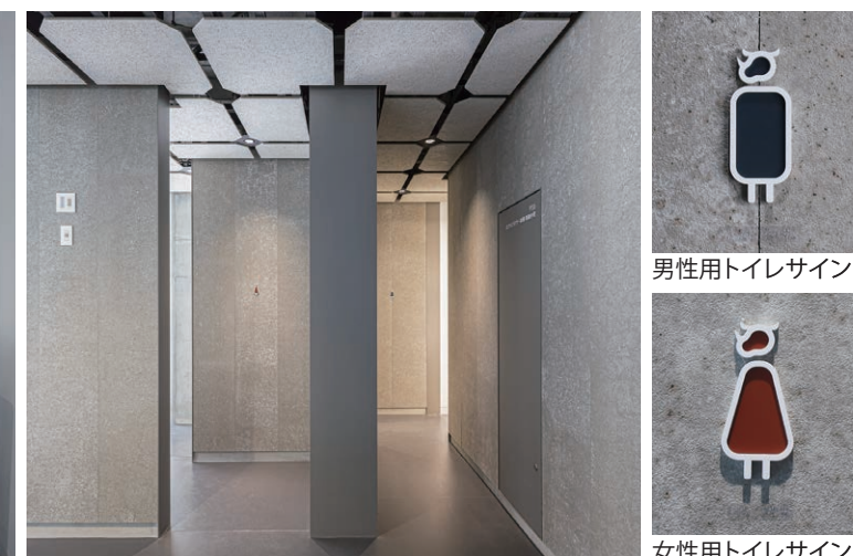
男性用トイレサイン