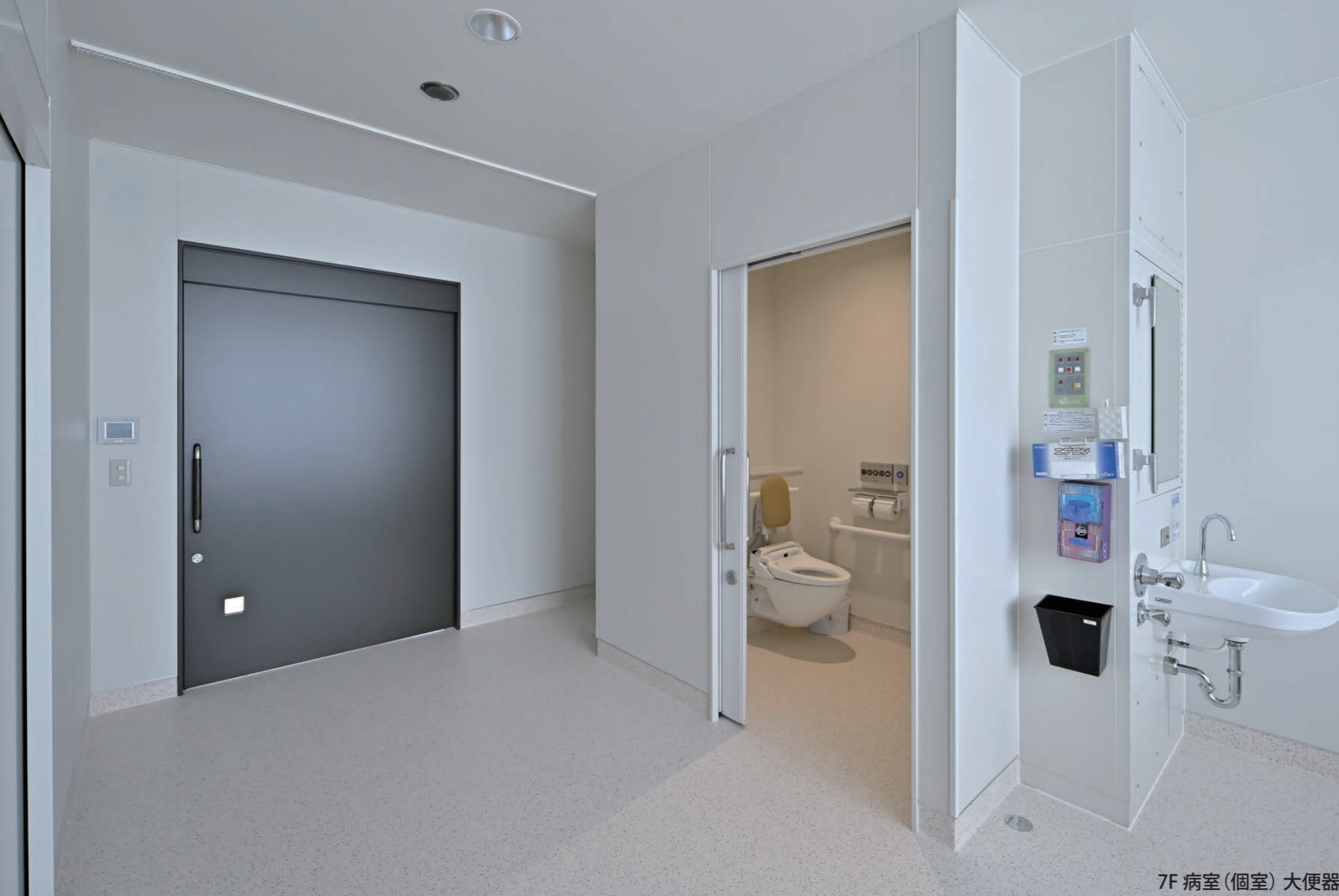
7F 病室(個室) 大便器

洗面カウンター：*DM-601ND9WS(2268) 自動水栓：AM-313TCV1