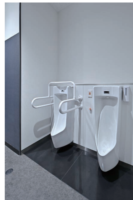
1F 男性用トイレ 小便器