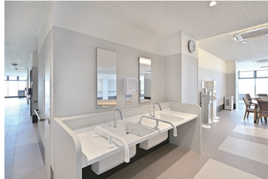
7F デイルーム 洗面