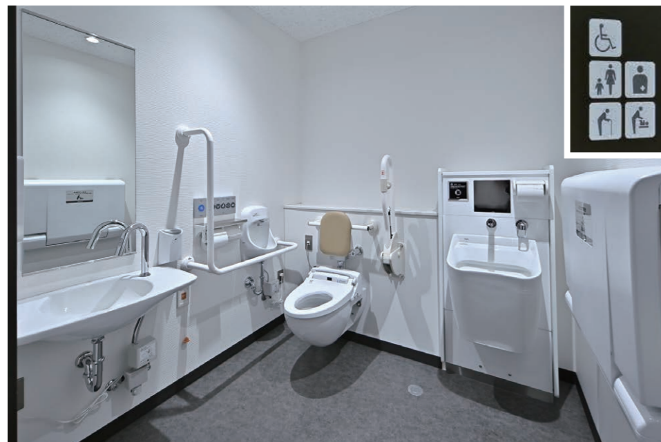
1F バリアフリースイートイレ

新館の増築により、救急医療から在宅医療までワンストップで医療サービスの提供が可能となった。