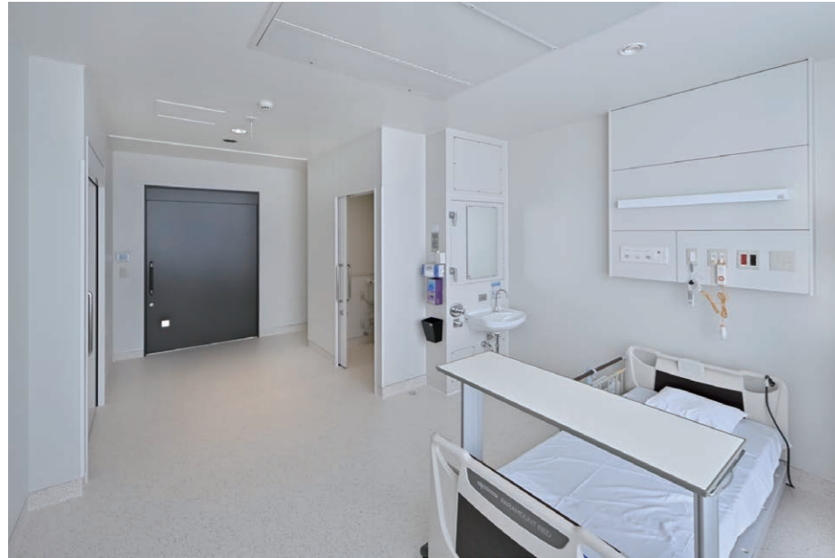
7F 病室(個室) 内観