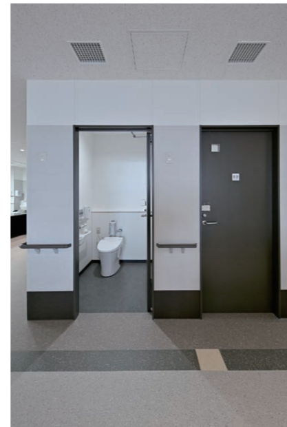
7F 男女共用トイレ 入り口まわり