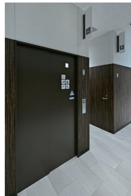
1F トイレ 入り口まわり