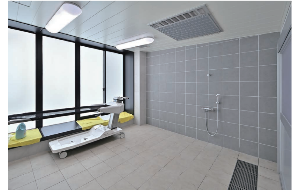
8F 機械浴室 シャワー水栓