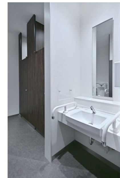
1F 男性用トイレ 洗面