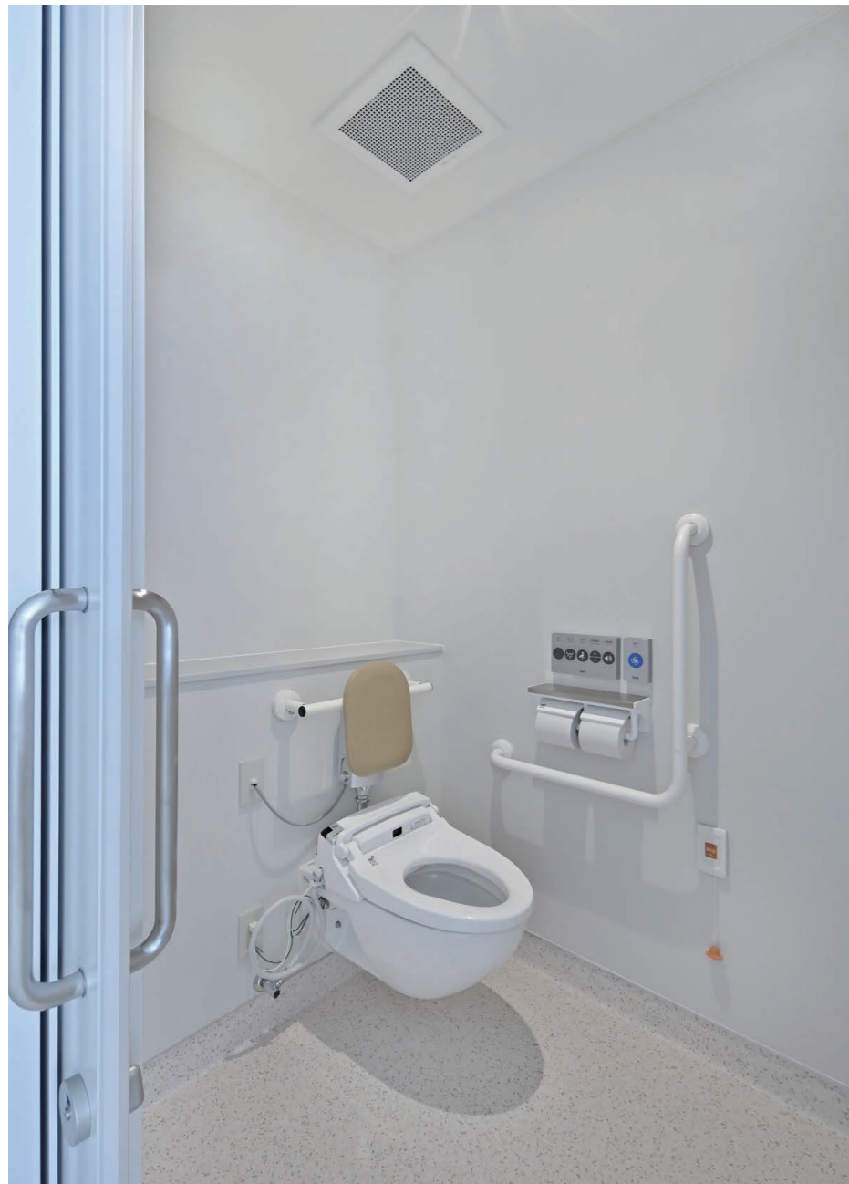
7F 病室(個室) 大便器