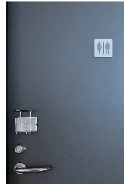
7F トイレサイン・鍵・消毒用ホルダー