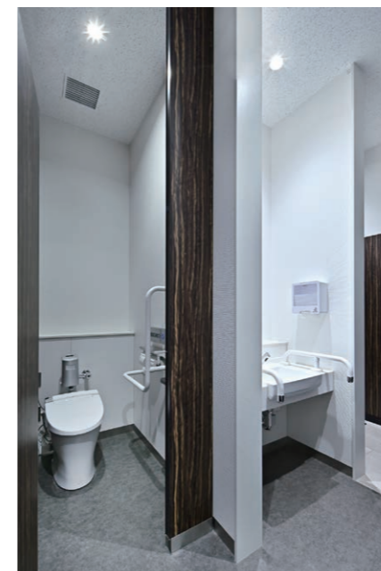
1F 男性用トイレ 大便器・洗面