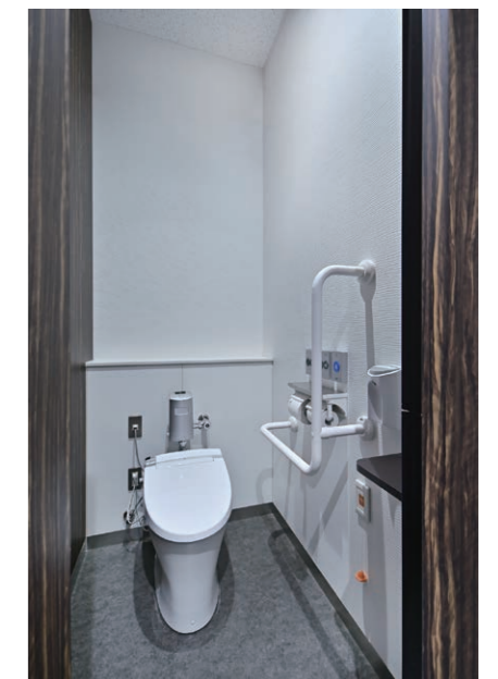
1F 男性用トイレ 大便器