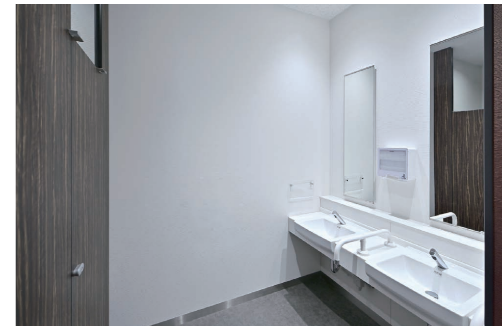
1F 女性用トイレ 洗面