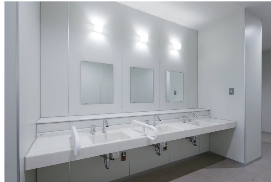
男性用トイレ 洗面