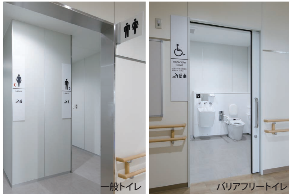
入り口に設置設備をピクトサインで表示。廊下には手すりを備えている。