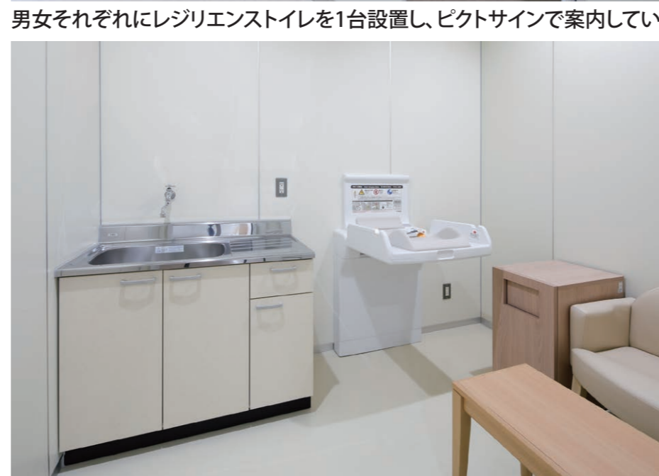
赤ちゃんの駅(ベビー休憩室) 流し台・おむつ交換台