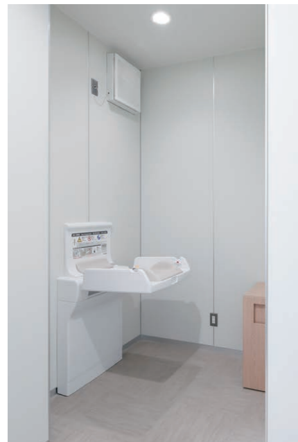
男性用トイレ おむつ替えスペース

大谷地区のコミュニティ活動の拠点として、市民の多様なニーズに対応できる機能を備えた複合的な施設。