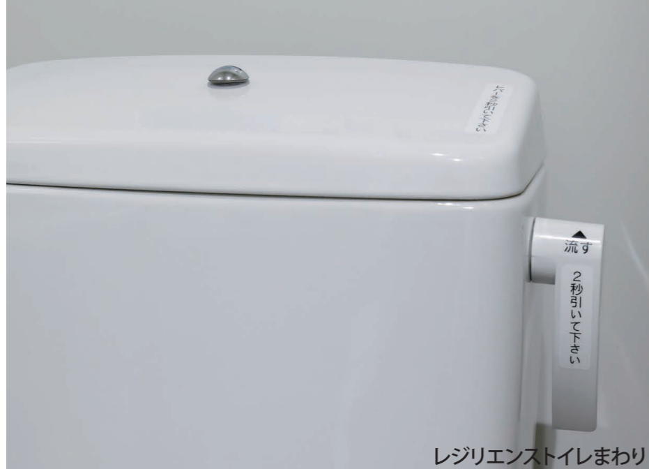
レジリエントイレまわり