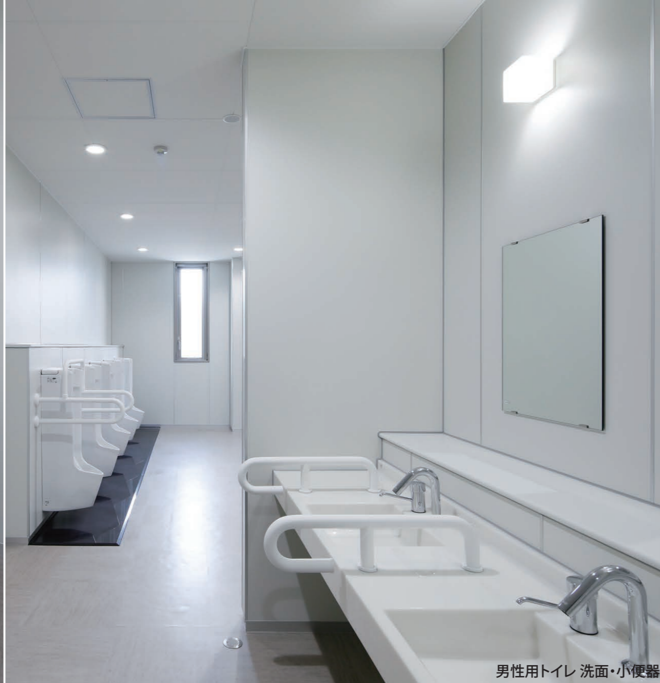
男性用トイレ 洗面・小便器

大谷地区のコミュニティ活動の拠点として、市民の多様なニーズに対応できる機能を備えた複合的な施設。