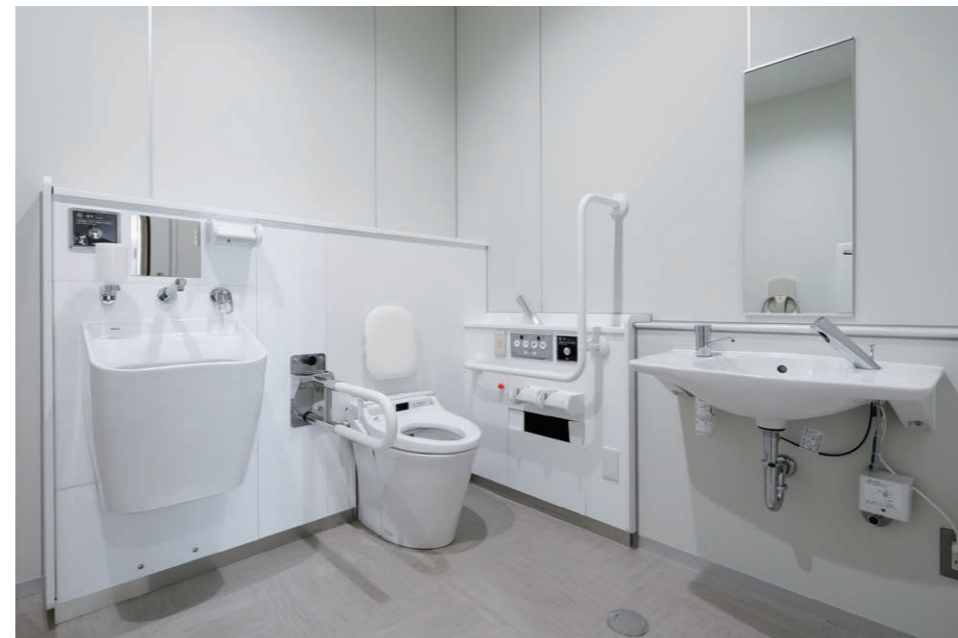
バリアフリーストイル