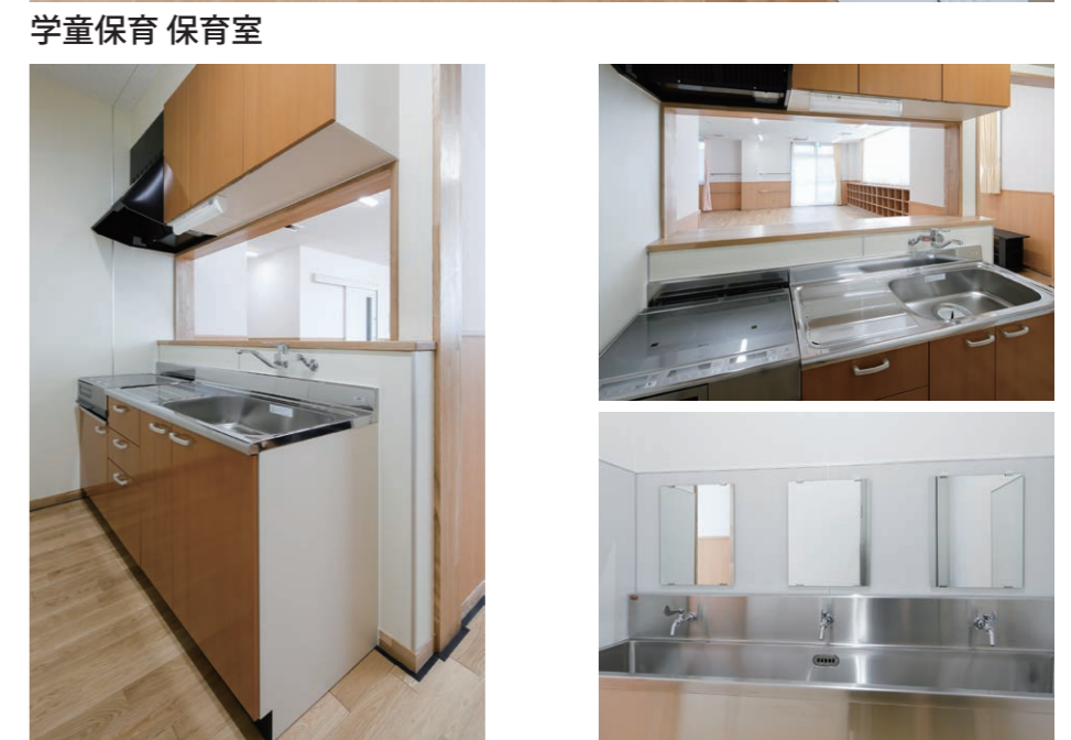
学童保育 キッチン