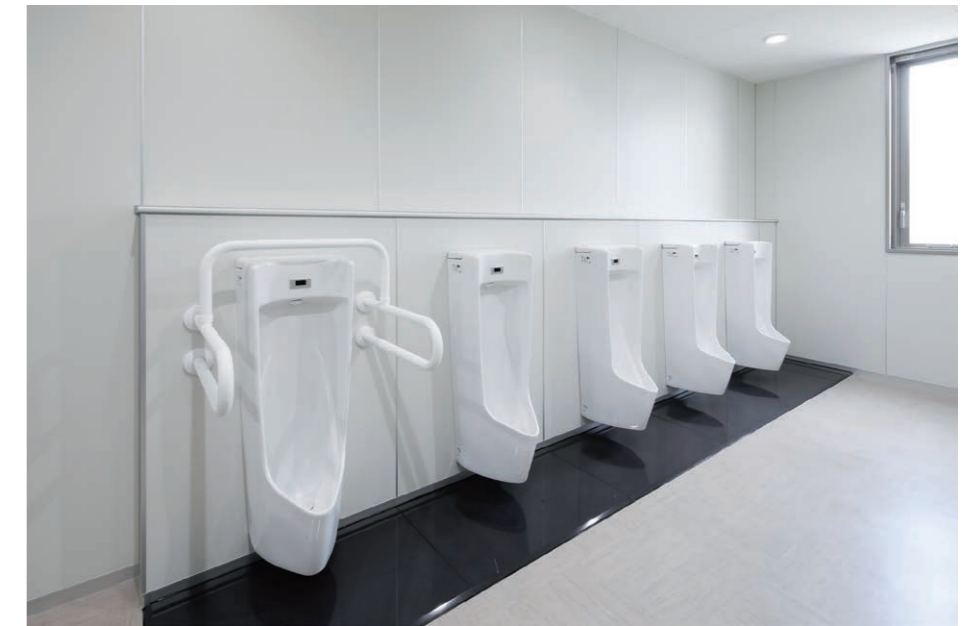
男性用トイレ 小便器