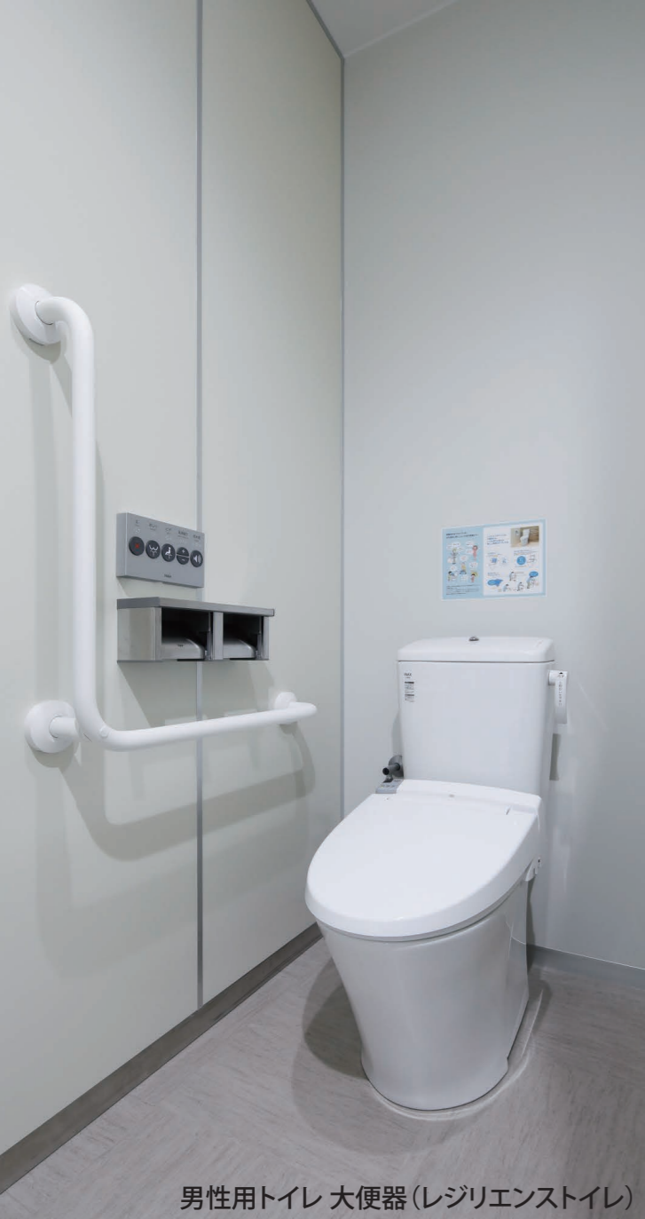
男性用トイレ 大便器(レジリエンストイレ)