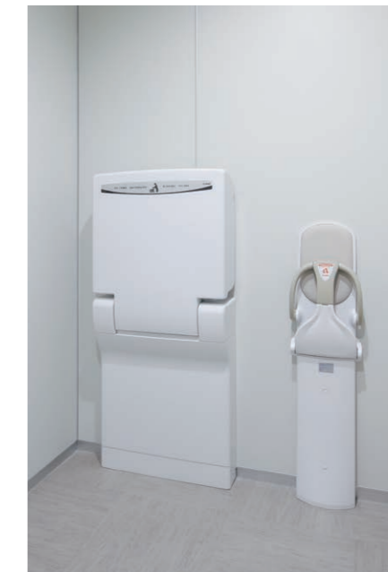
バリアフリーストイル