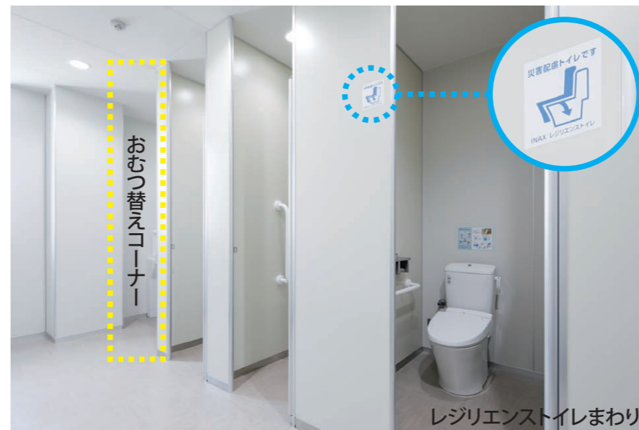
男女それぞれにレジリエントイレを1台設置し、ピクトサインで案内している。