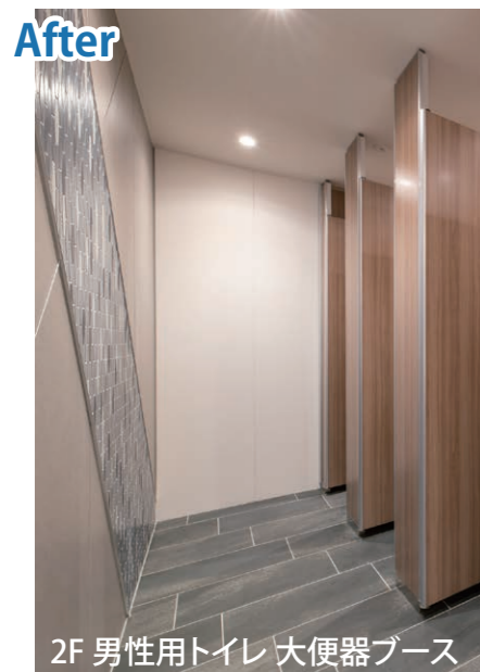
2F 男性用トイレ 大便器ブース

洗面は手元まで入るボウル形状が水はねを軽減し、傾斜のついたカウンターがドライエリアを確保。小便器は足元がスリムであまり足を広げず利用できる。