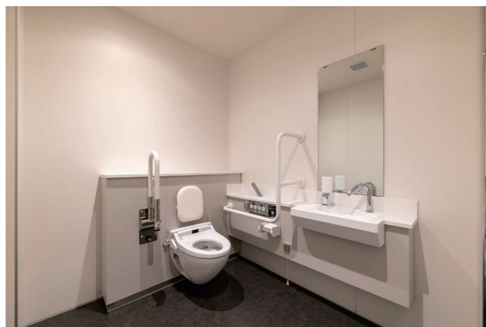
1F バリアフリートイレ