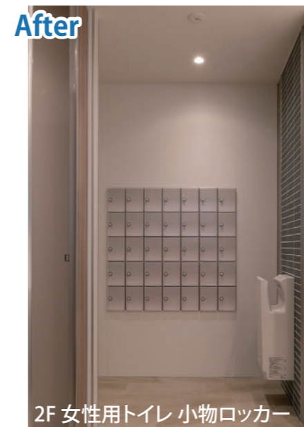
2F 女性用トイレ 小物ロッカー