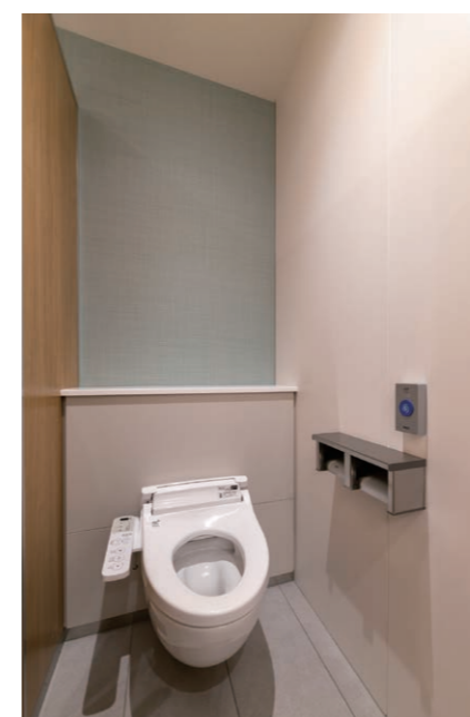
3F 女性用トイレ 大便器