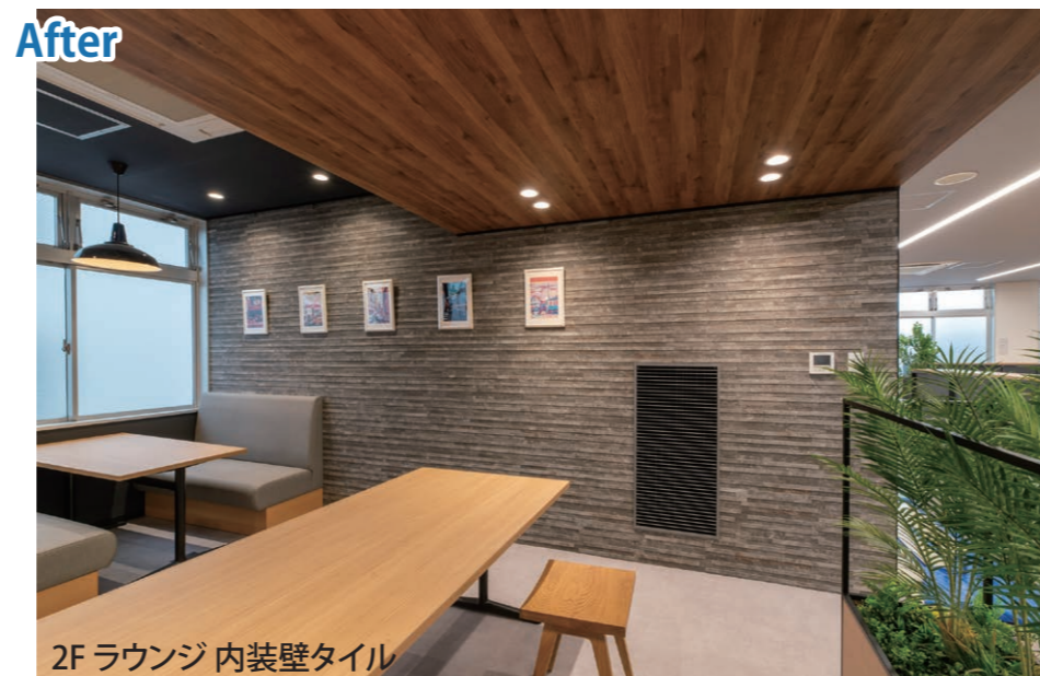
2F ラウンジ 内装壁タイル

自然な石をリアルに再現したデザインの「エコカラットプラス」が空間のアクセントに。