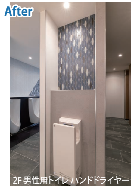
2F 男性用トイレ ハンドドライヤー