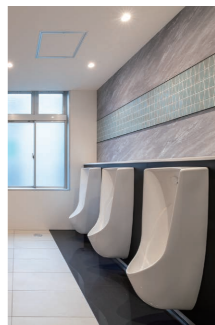
3F 男性用トイレ 小便器