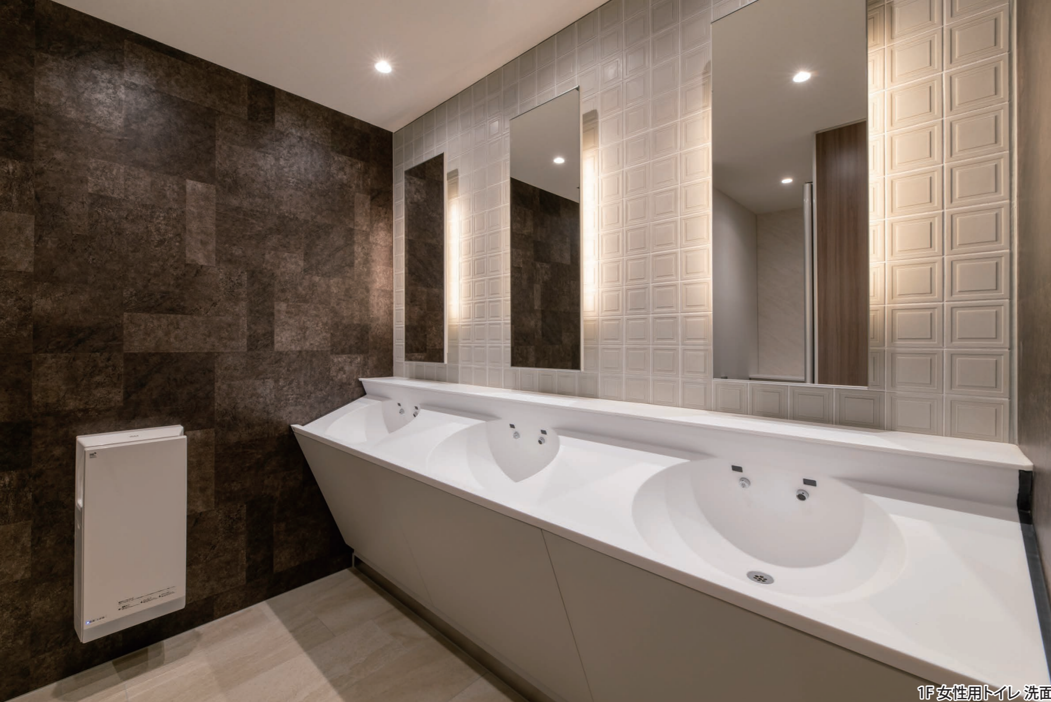
1F 女性用トイレ 洗面