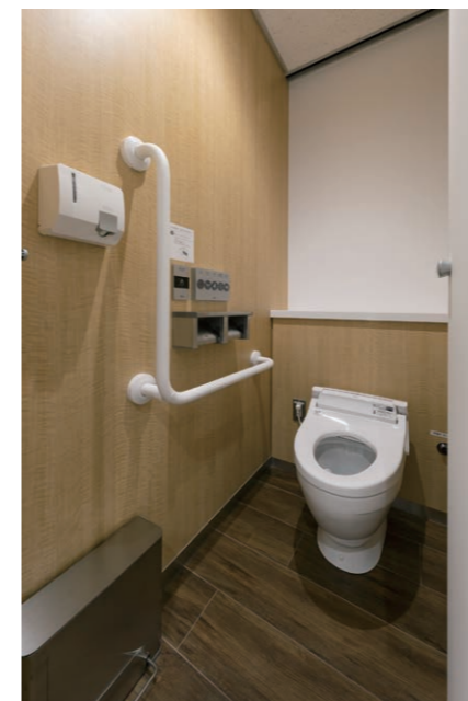
女性用トイレ 大便器