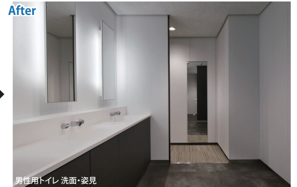
レイアウト変更で廊下からの視線を遮り、落ち着いて利用できる環境に。また、身だしなみを確認できる姿見も設置した。