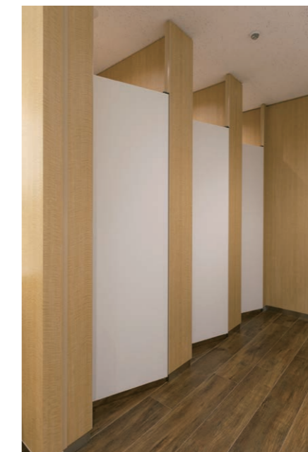
女性用トイレ 大便器ブース