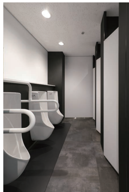
男性用トイレ 小便器

主要ビジネスエリアに隣接する港区の賃貸オフィス。トイレをスタイリッシュに全面リニューアル。