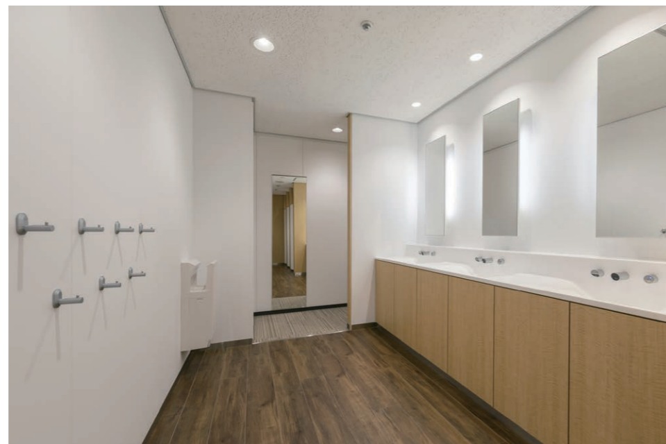
女性用トイレ 洗面