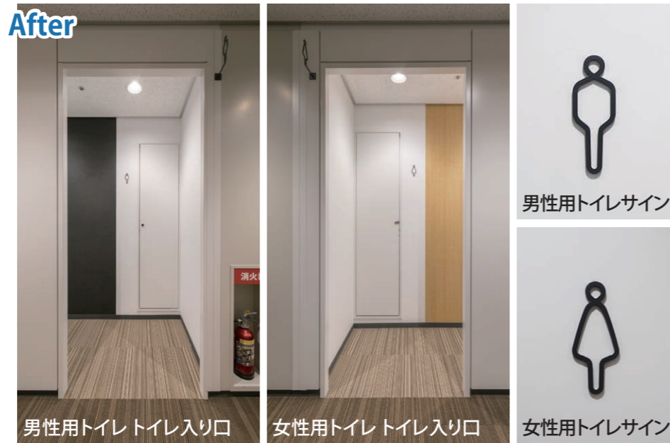
入り口はドアを触らずに出入りできるドアレスタイプに変更。スタイリッシュなトイレサインでデザイン性も高めている。