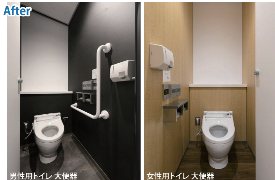
シャワートイレには操作がしやすい壁付リモコンを採用。便座周りにゆとりが生まれ、空間も洗練された印象になっている。