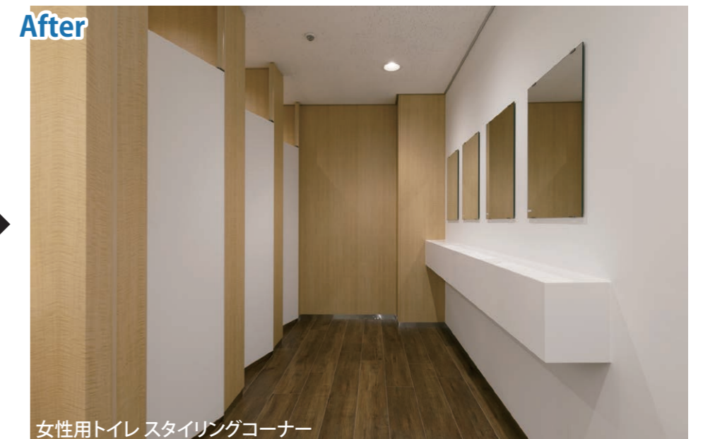
スタイリングコーナーは、壁と一体化したデザインの棚で見た目をすっきりさせ、設置数も増やしている。