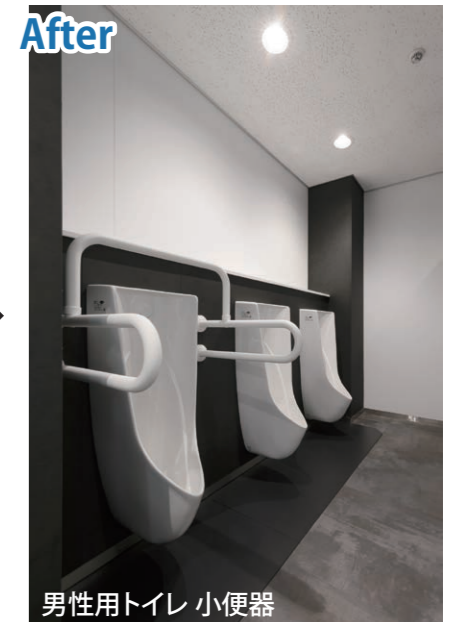
高意匠の小便器を設置。黒い前板や柱で上品な空間に仕上がっている。