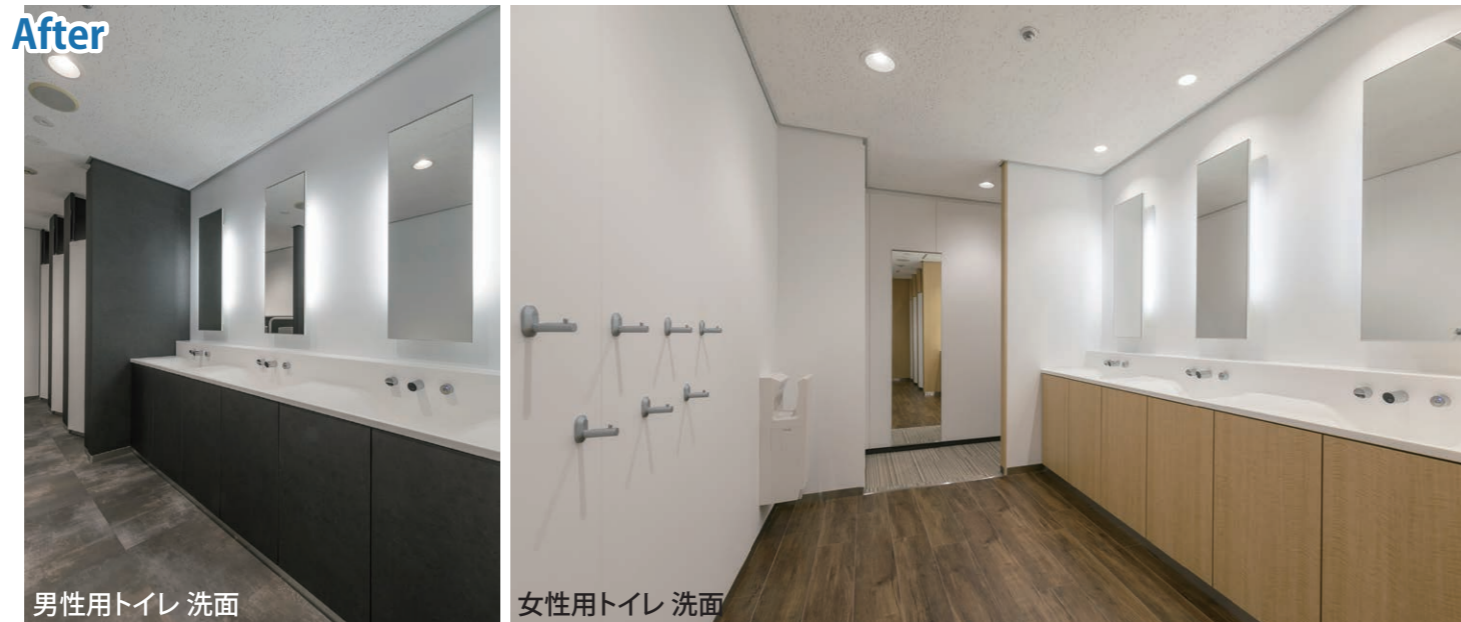
洗面カウンターは凹凸が少なく、水栓まわりが汚れにくい壁付水栓を採用。鏡の裏側の間接照明が空間をやさしく照らし、光の演出をしている。