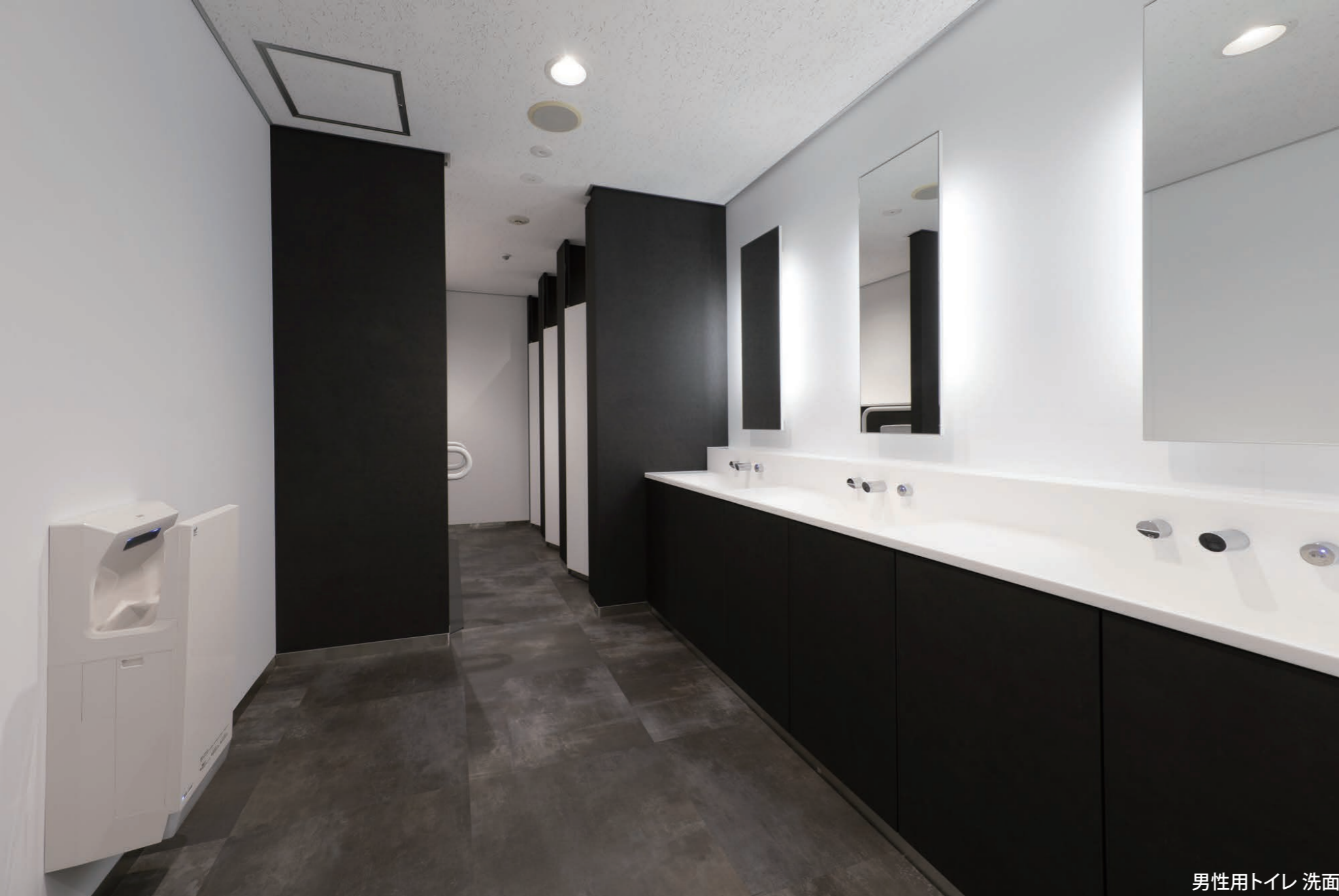
男性用トイレ 洗面

主要ビジネスエリアに隣接する港区の賃貸オフィス。トイレをスタイリッシュに全面リニューアル。