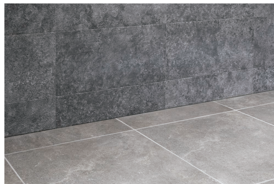
エコカラットプラス・内装床タイル (床面との取り合い)