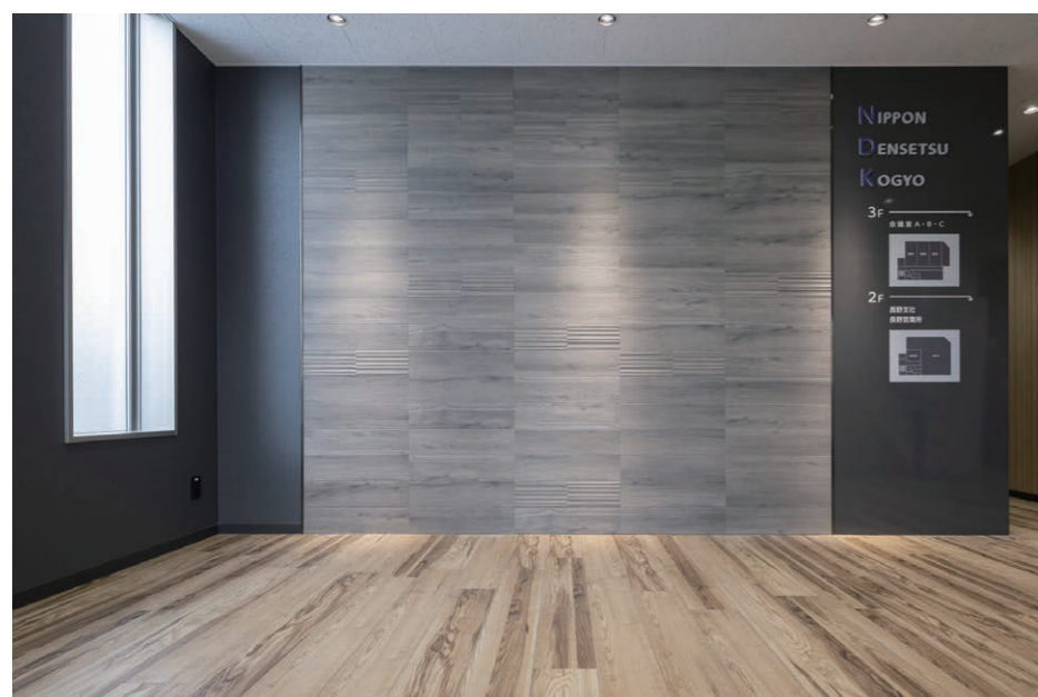
エコカラットプラス(ホール側面)