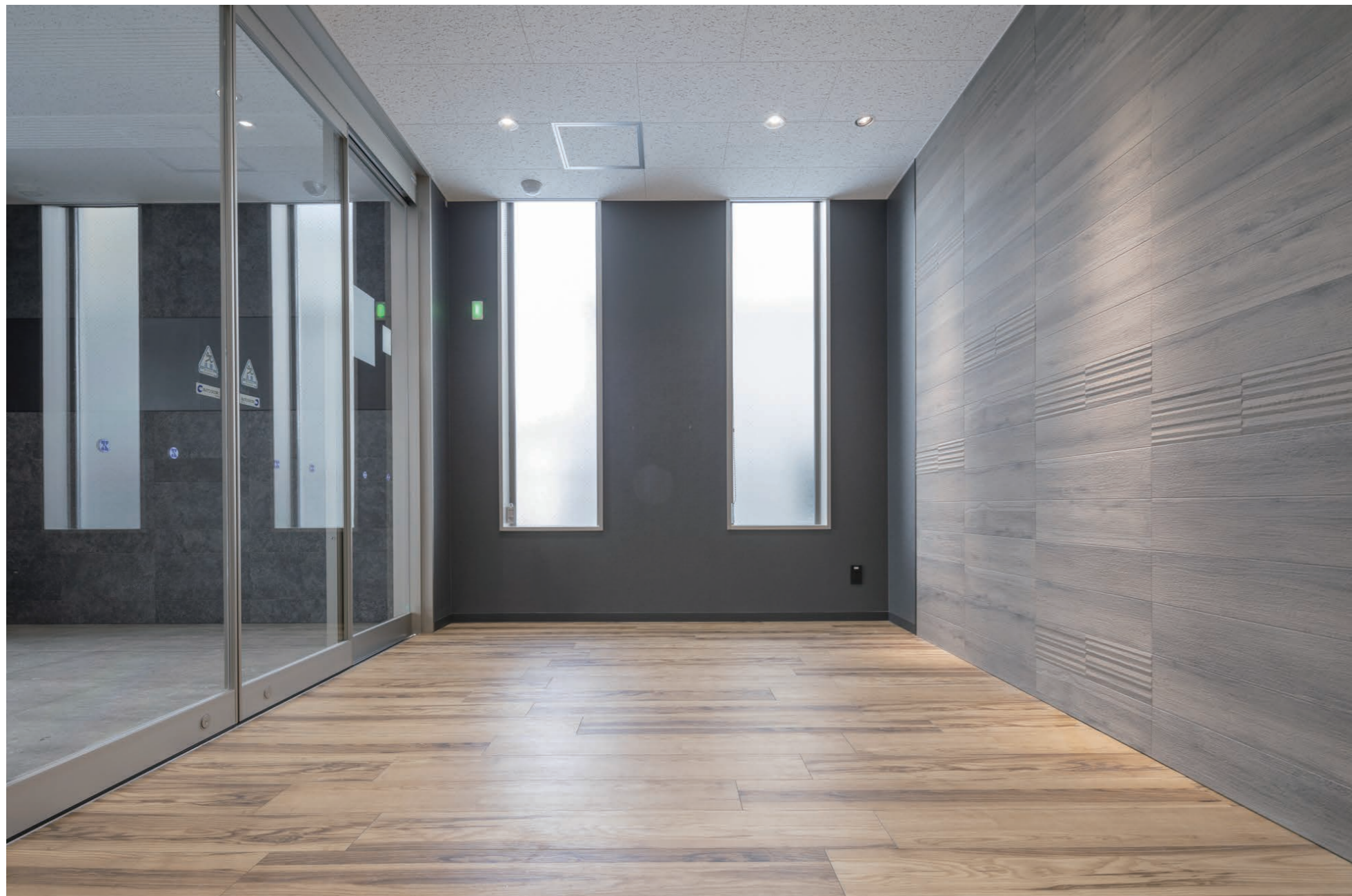
エコカラットプラス(ホール) 凹凸のあるエコカラットプラスを選定することで壁面に表情を持たせ、木目を引き立たせた