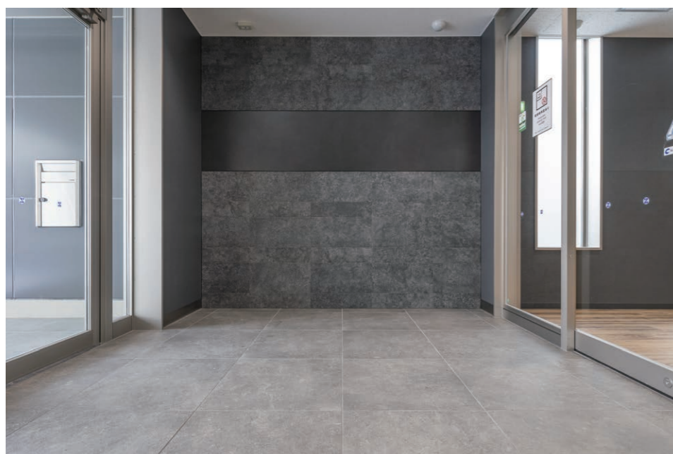
エコカラットプラス (ホール側面) (エントランス)