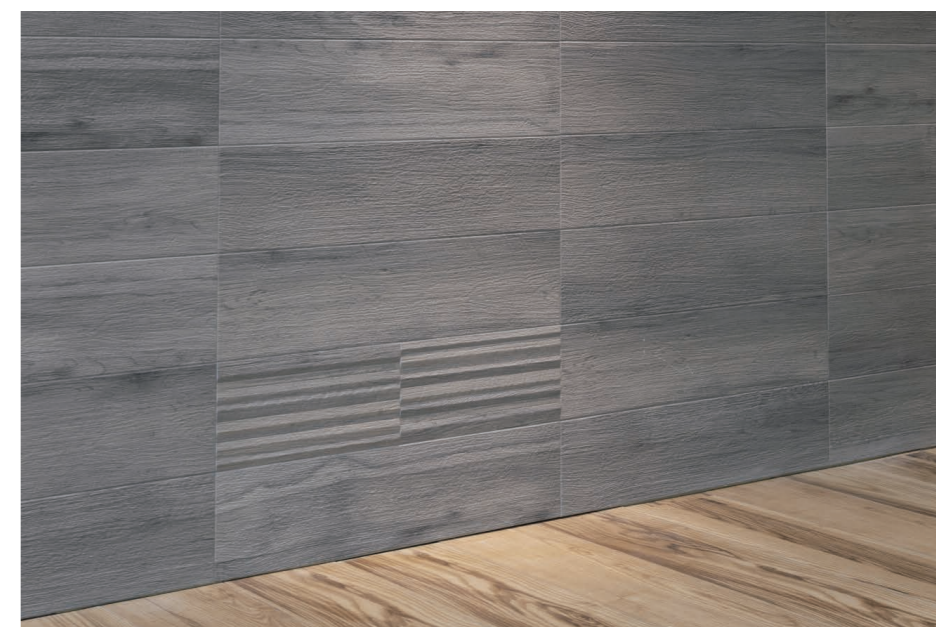
エコカラットプラス(床面との取り合い)