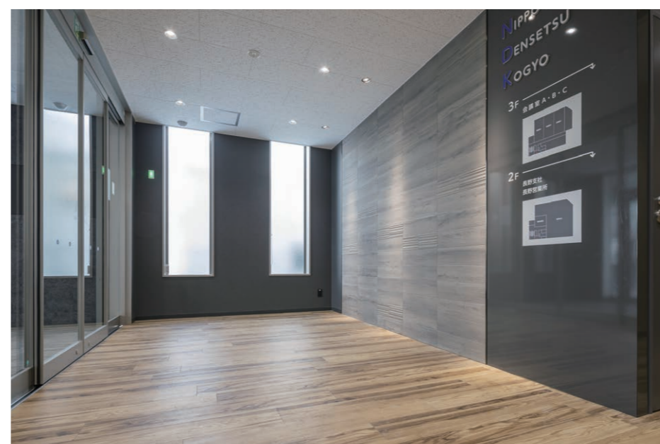
エコカラットプラス(ホール)