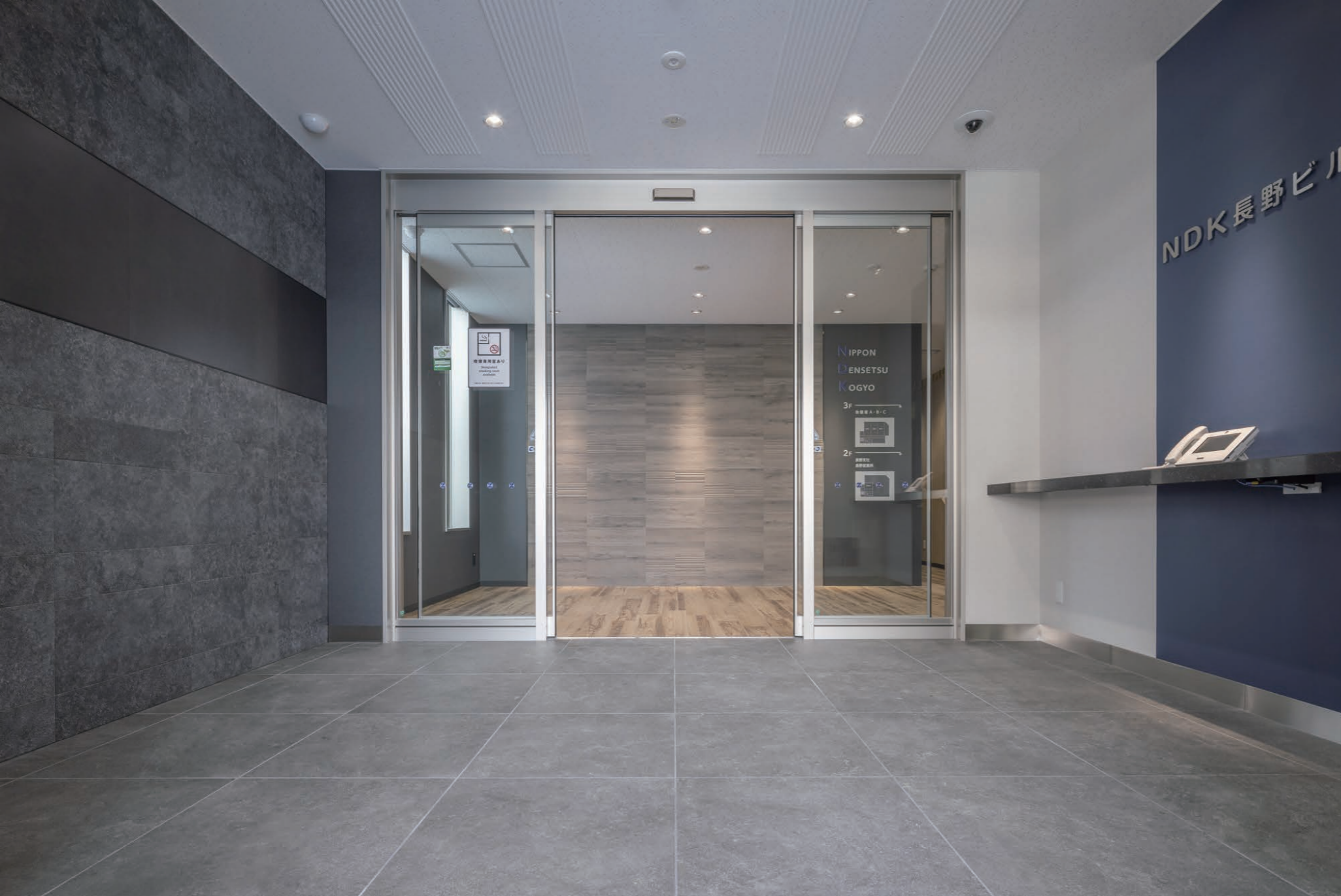
ポーチの濃灰色系の外壁から連続的なイメージとするため、濃灰色系の溶岩石の深い色合いのエコカラットプラスを選定した。

内装機能建材 エコカラットプラス ビンテージオーク：ECP-615/OAK3N 内装機能建材 エコカラットプラス ディープバサルト：ECP-630/DPB2 外装床タイル メンフィス：IPF-600/MMP-13