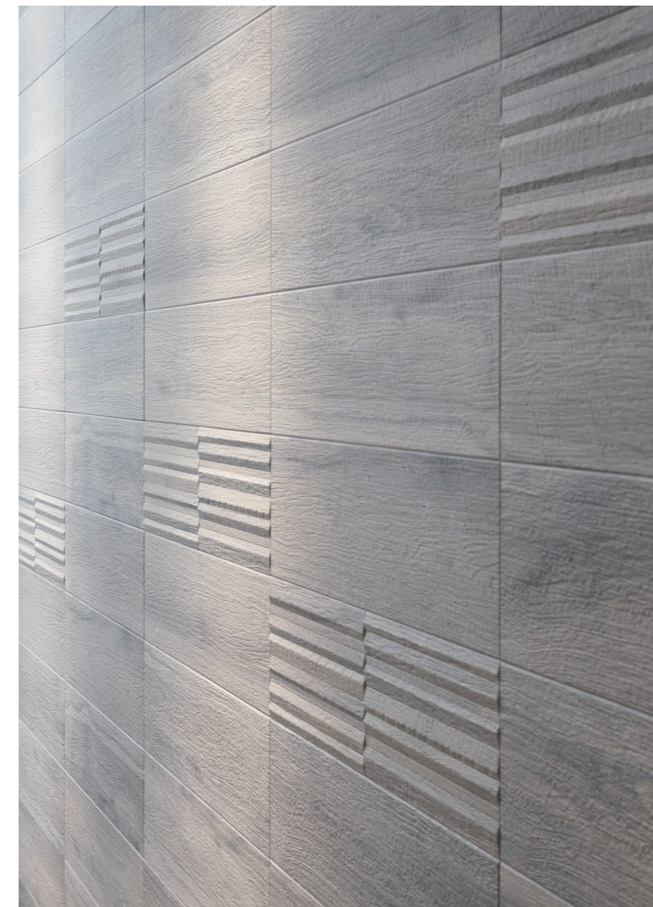
エコカラットプラス ビンテージオーク(ディテール)