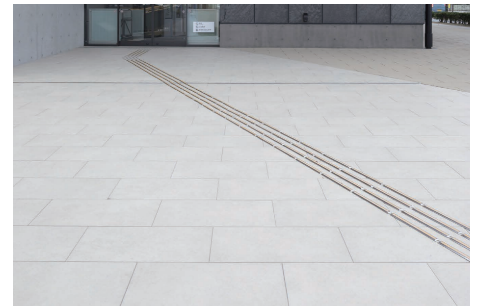
外装床 タイルディテール