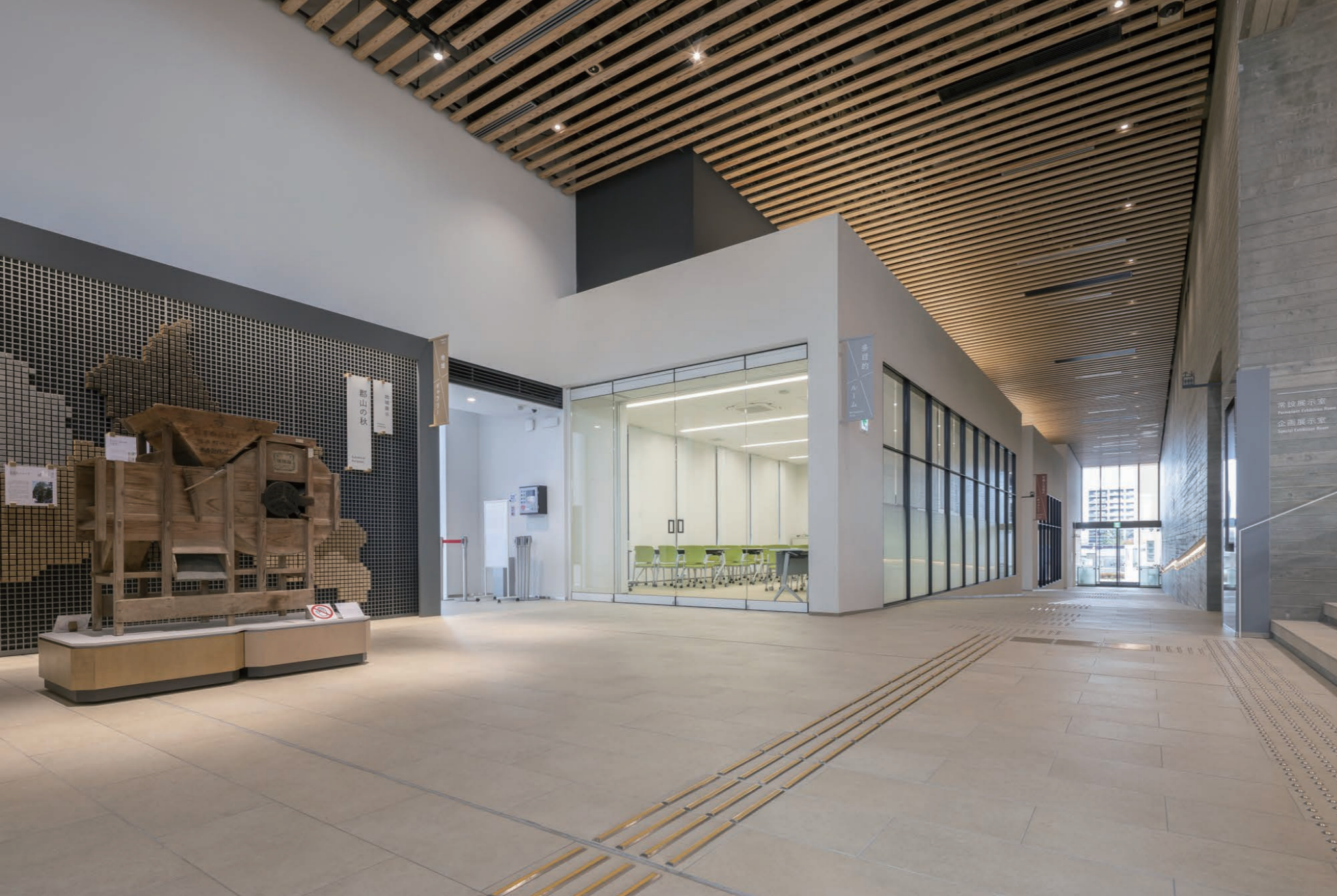
地域ギャラリー 内装床タイル