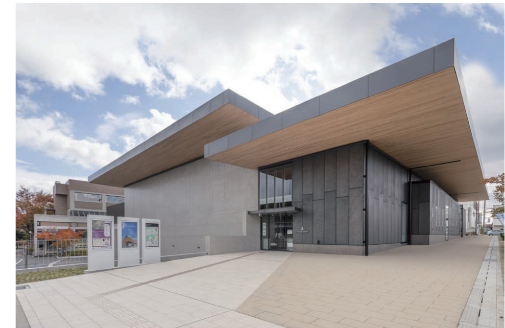
建物全景、北側入り口 外装床タイル