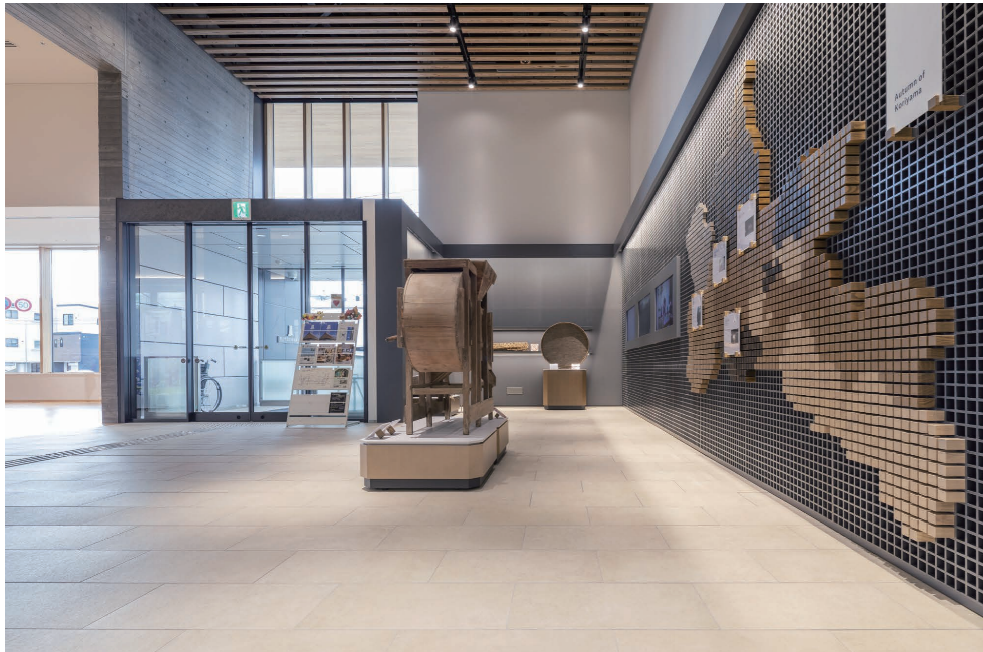
地域ギャラリー 内装床タイル