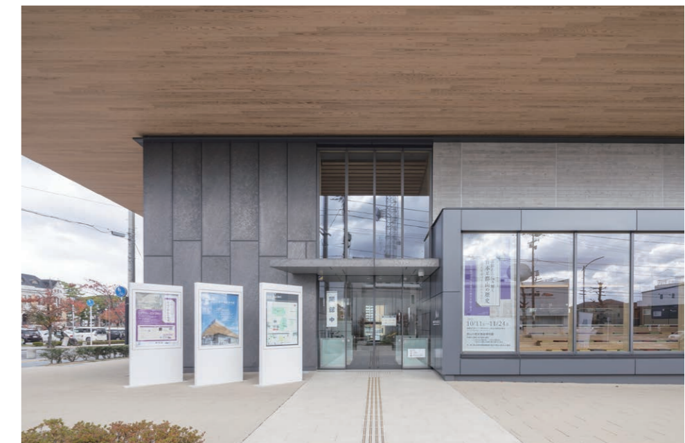
南側入り口 外装床タイル