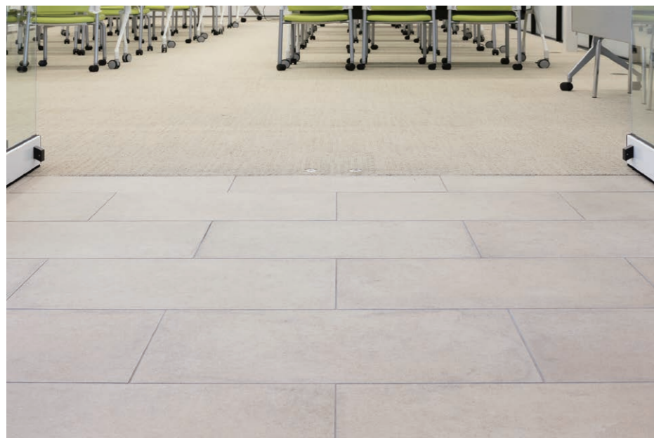
内装床 タイルディテール