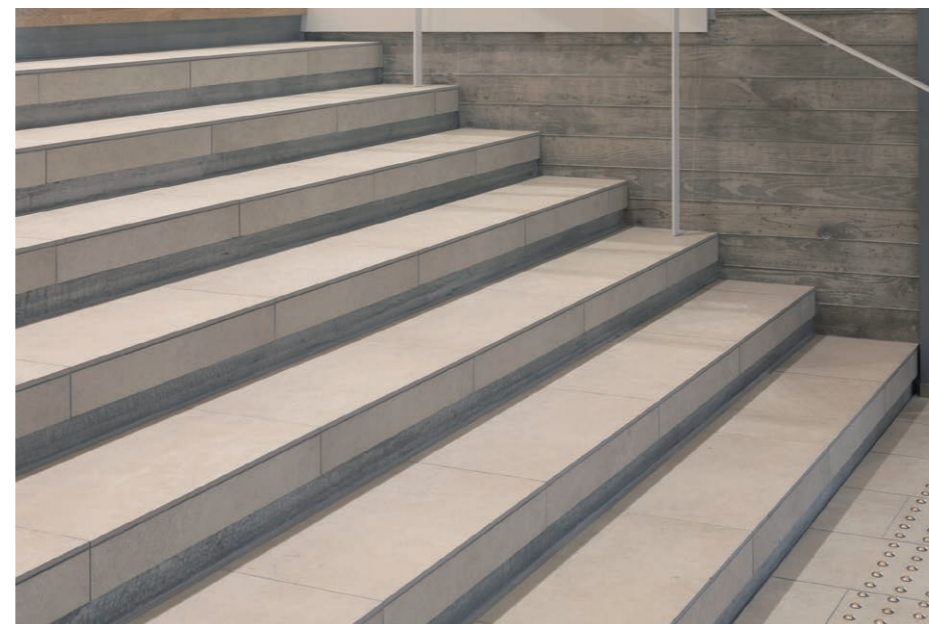
階段 タイルディテール