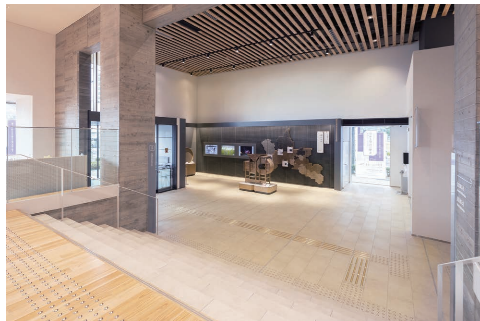
アーカイブギャラリーから見た地域ギャラリー 内装床タイル