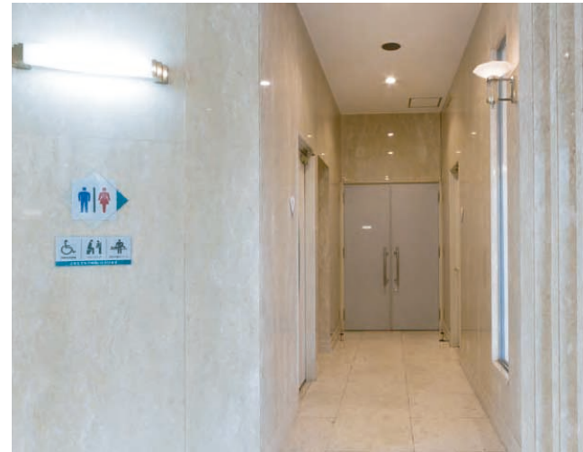
▲トイレ入り口まわり