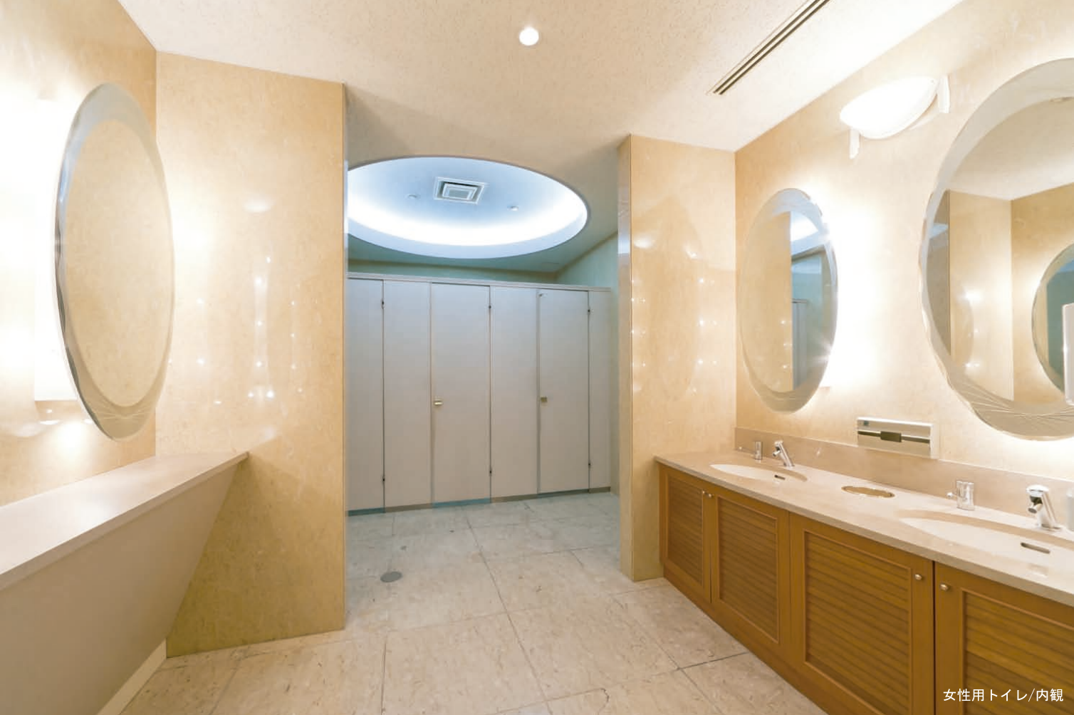
女性用トイレ/内観