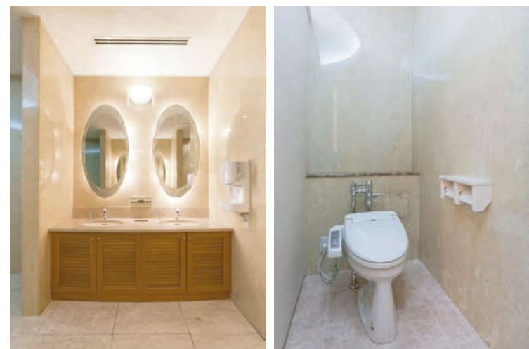
大理石調の床壁で高級感を、丸鏡と木目調のカウンターで落ち着きを感じられる空間。