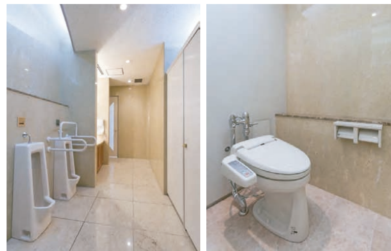
大便器ブースはすべてにシャワートイレを設置した。