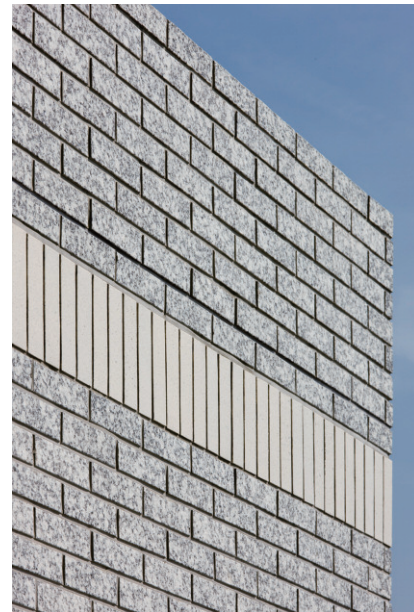
タイルコーナーディテール