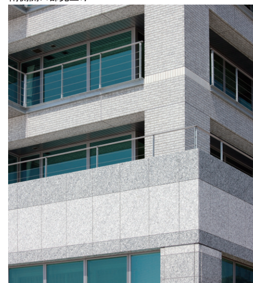
南東側低層コーナー部