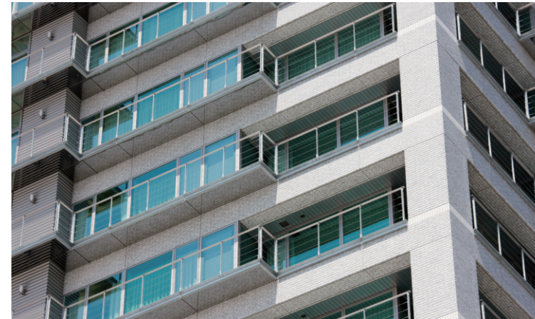
南側開口部見上げ