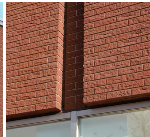
タイルディテール