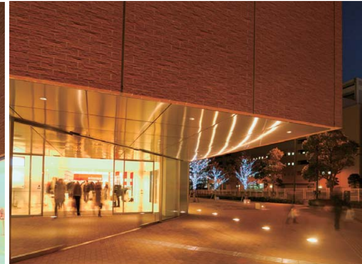
エントランス近景(夜間)