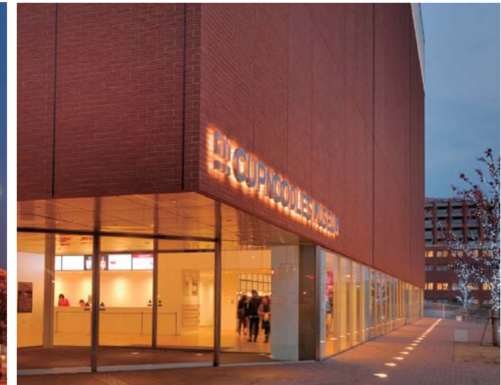
エントランス全景(夜間)