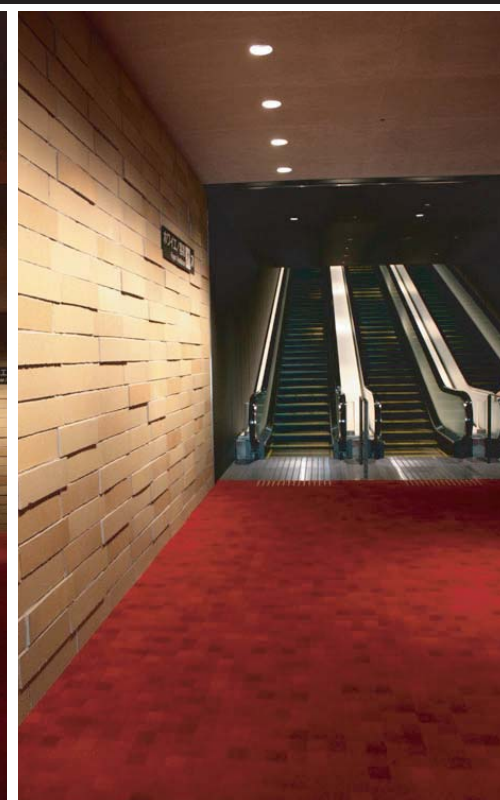
エントランスホワイエ内壁近景