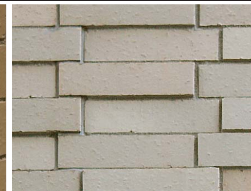
東面外壁ディテールアップ