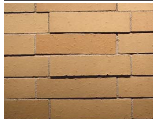
エントランスホワイエディテールアップ