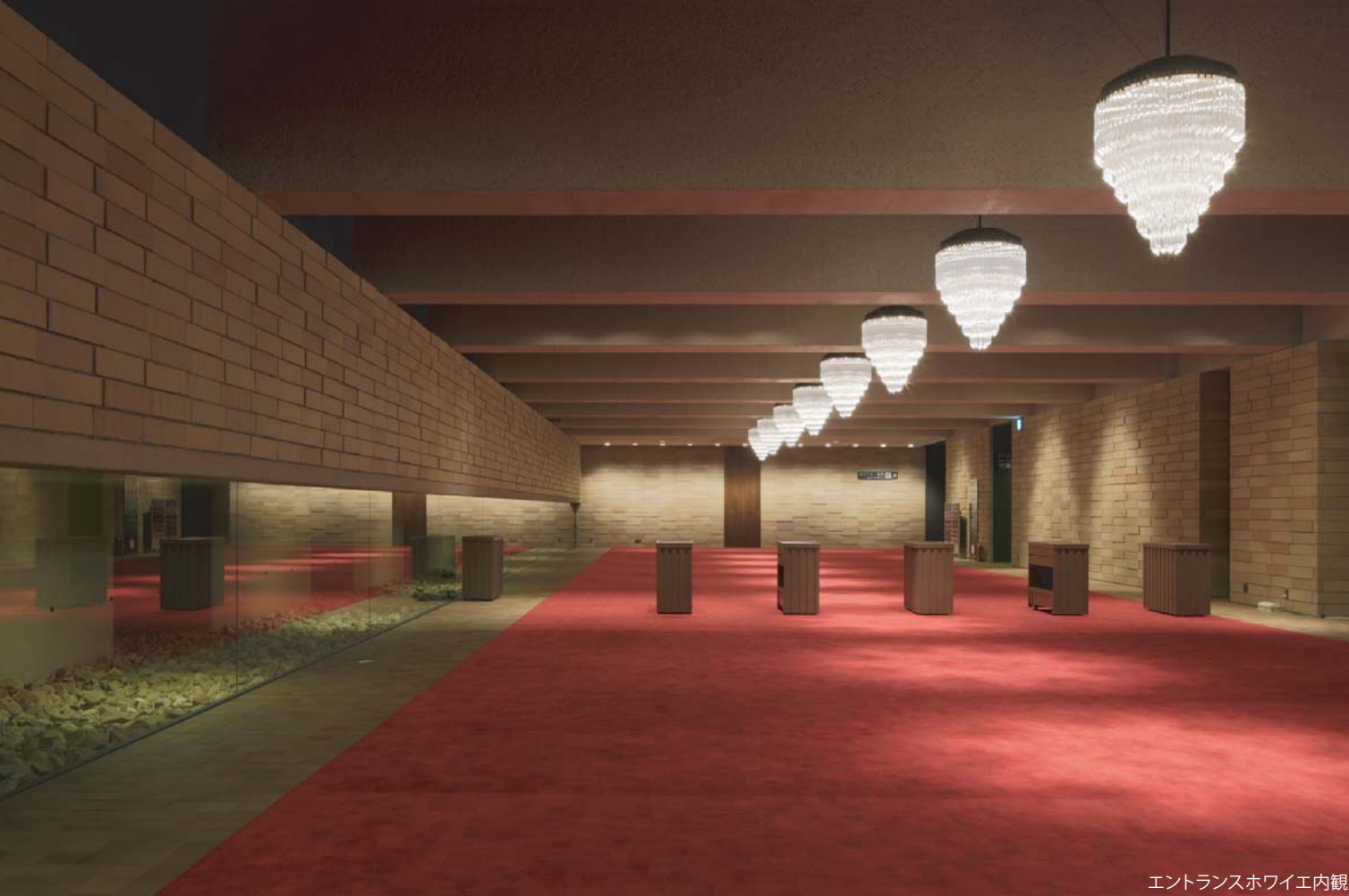
エントランスホワイエ内観