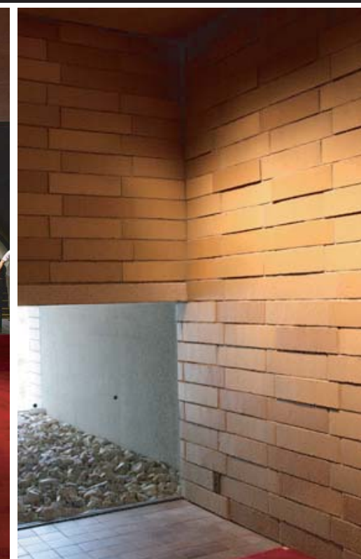
エントランスホワイエ内壁近景