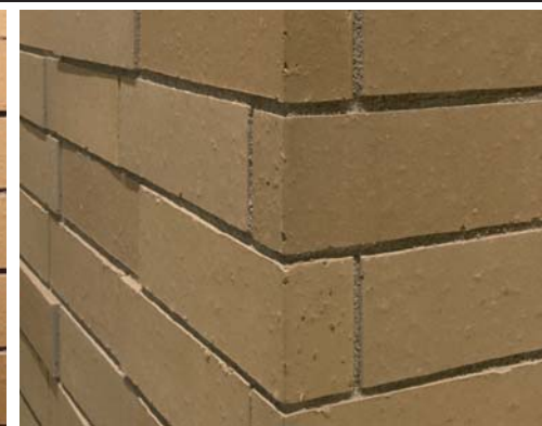
エントランスホワイエコーナーディテールアップ