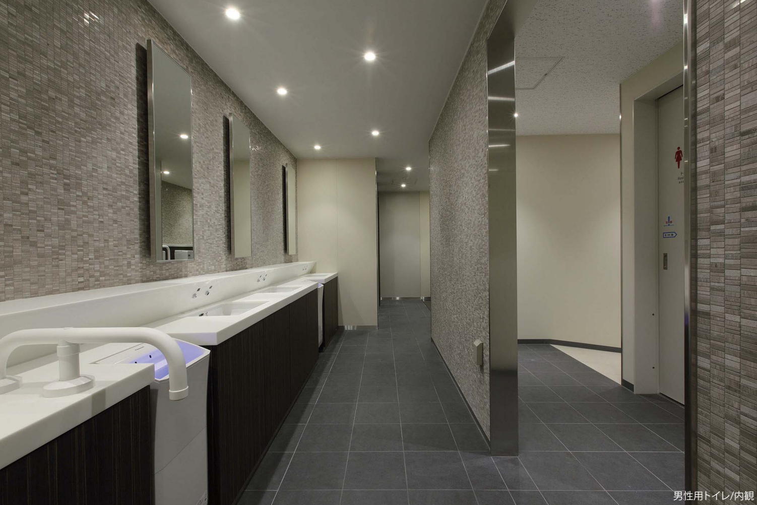
男性用トイレ/内観