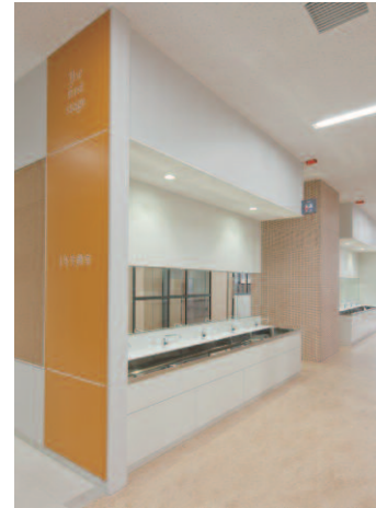
トイレまわり手洗場