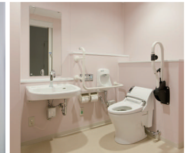
パステルカラーでやさしい雰囲気の内装デザイン。学校開放時の様々な利用者を考慮し、多目的トイレには車椅子で近づきやすいバリアフリー洗面器や手すりを設置。