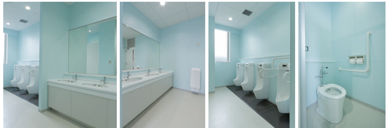
小便器はモップで簡単に床掃除ができる壁掛けタイプとし、汚垂石を併用する事で清掃性を向上。機器は節水型を採用し、環境に配慮。