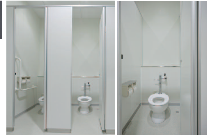
低学年用の大便器は座面の低い低リップタイプを採用。