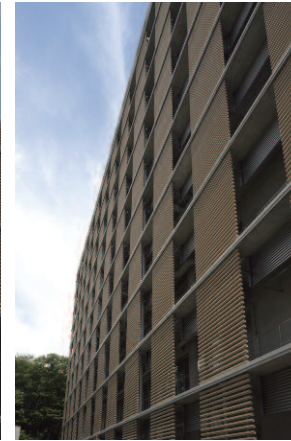
南側/テラコッタルーバー