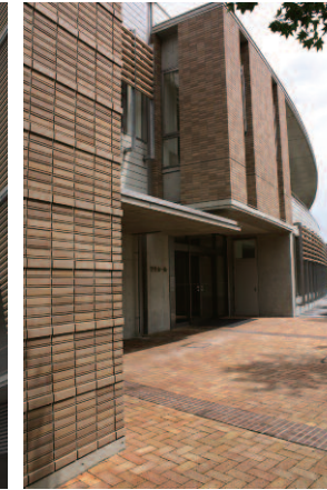
南側/エントランス側面