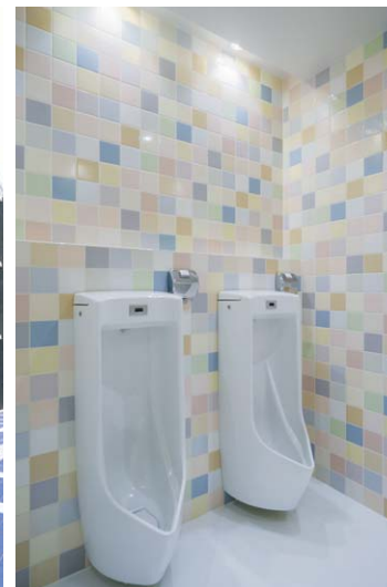
小便器まわり/内装壁タイル