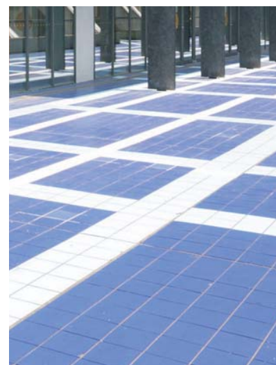
テラス外装床タイルディテール