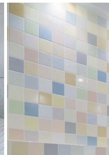
トイレ内装壁タイルディテール