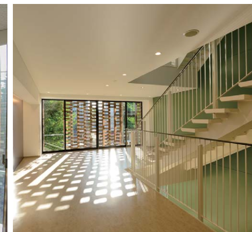
室内側階段から見た全景