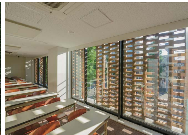
教室側から見たレンガスクリーン