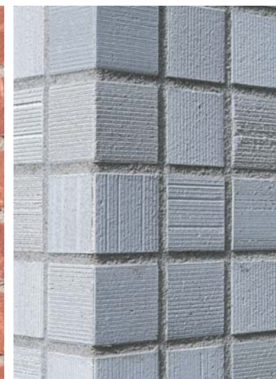
外壁コーナーディテール