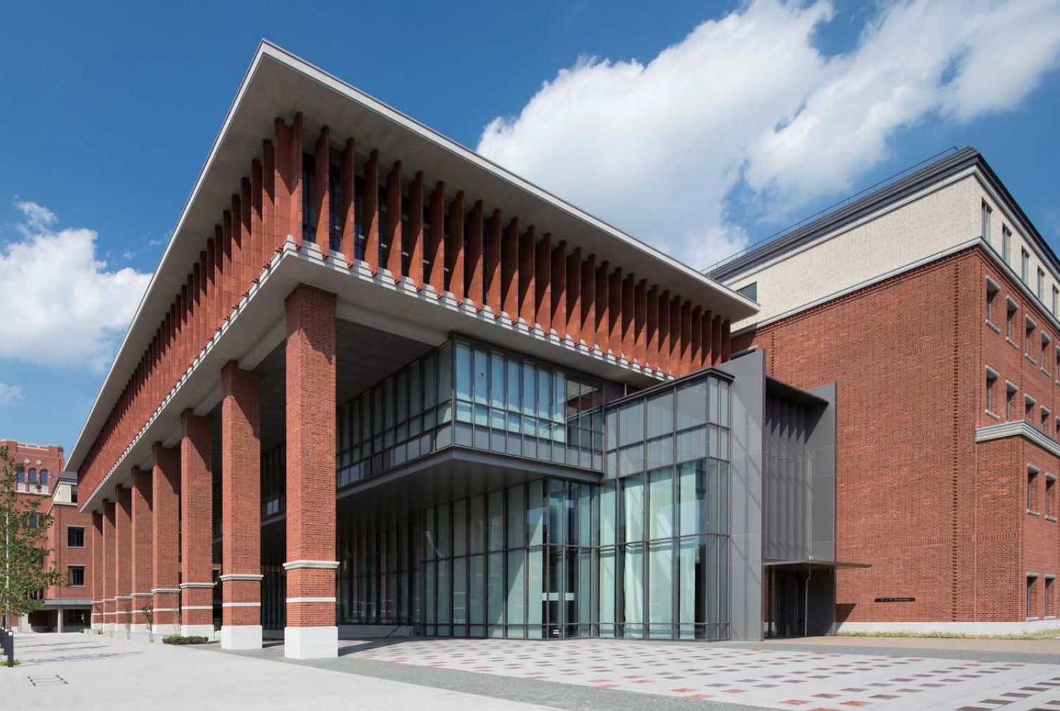
東側エントランス全景