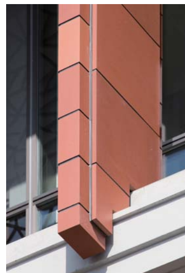
テラコッタ陶板ディテール