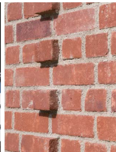
外壁タイルディテール