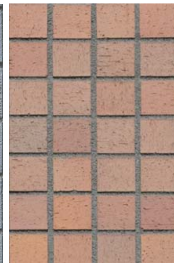
外壁タイルディテール