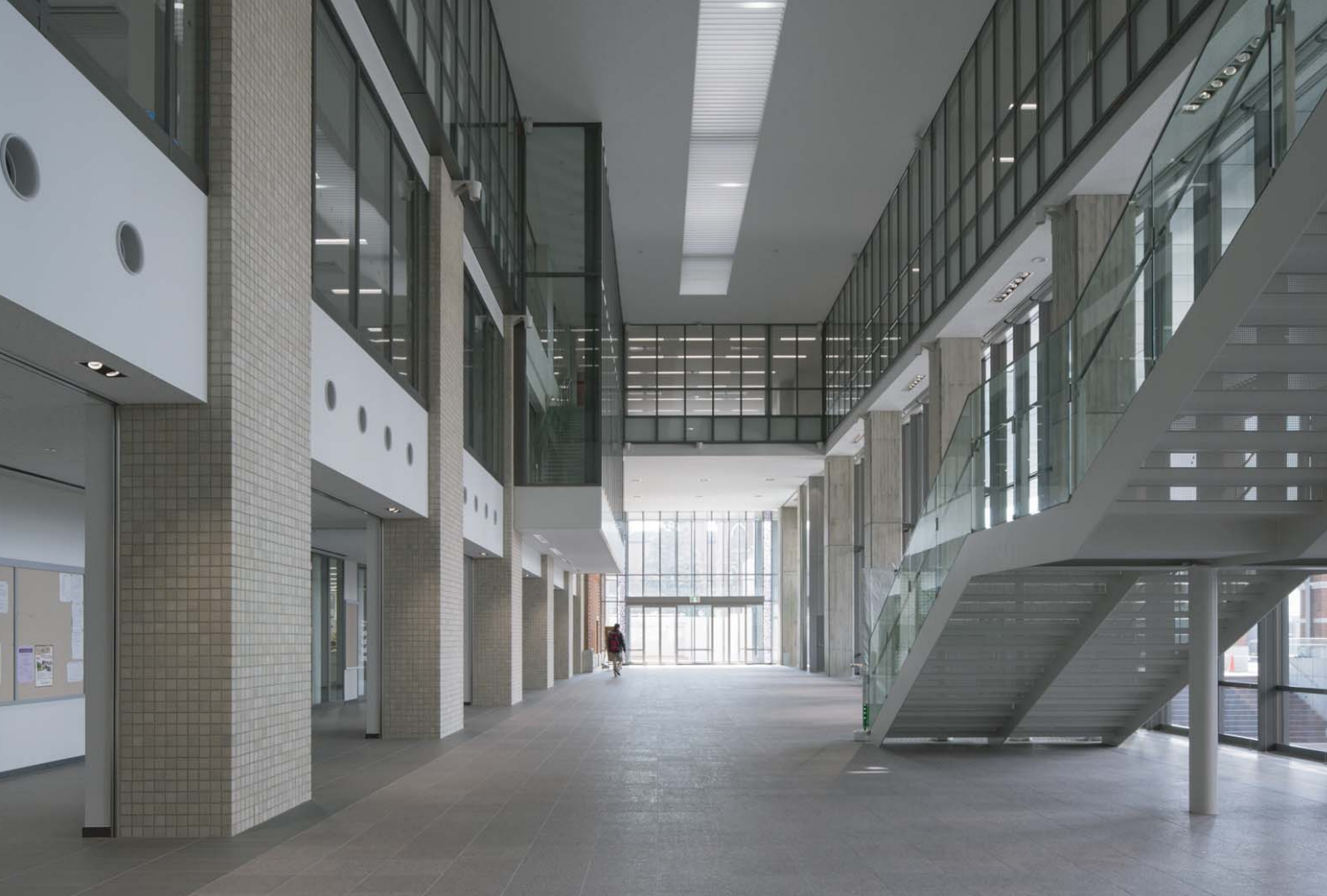
1F エントランスホール