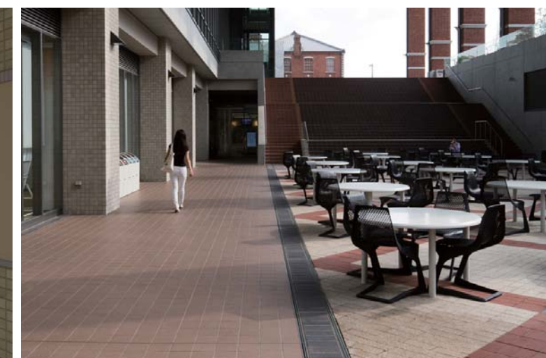
B1F通路 サンクン・ガーデン