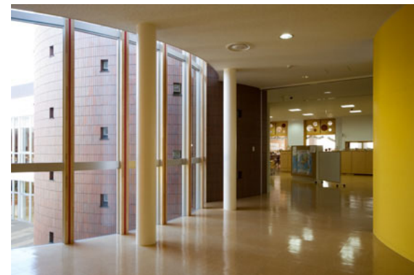
教室廊下からデン(コミュニティコーナー)の外壁を見る