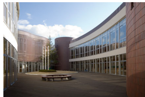
チャペルコート全景