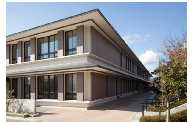
校務センター南東側