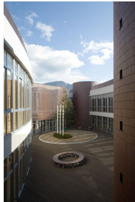
チャペルコート全景見下ろし