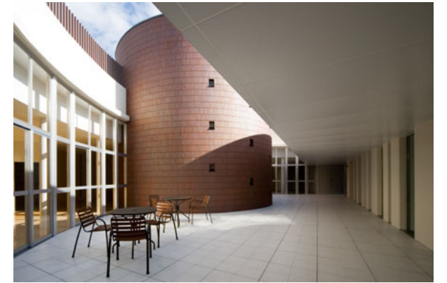
チャペルの床タイルとデン(コミュニティコーナー)の外壁