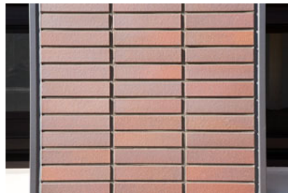
タイルディテールアップ