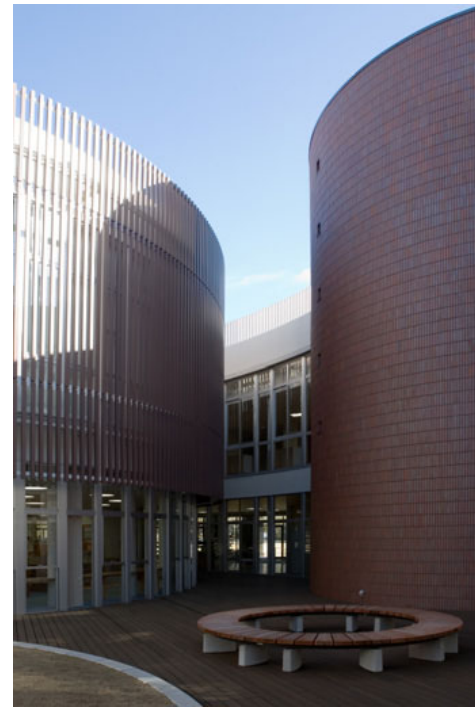
チャペルコートと図書館