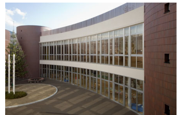
チャペルコートを2階から見下ろす