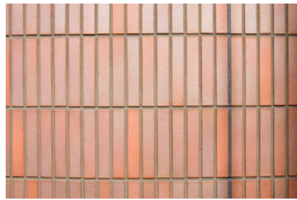
タイルディテールアップ