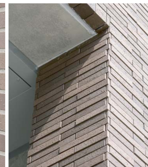
コーナー部タイルディテールアップ(体育館棟)