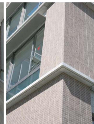
教室棟コーナー見上げ