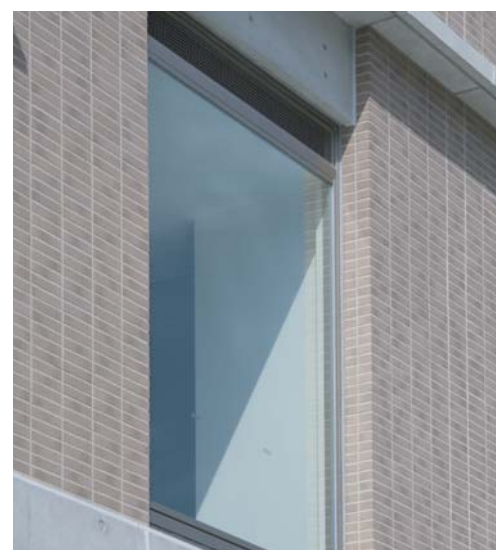
開口部タイルディテール(教育棟)