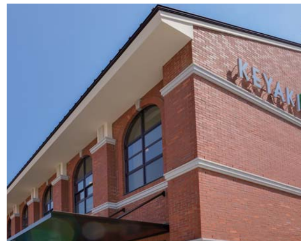
コーナー見上げ近景