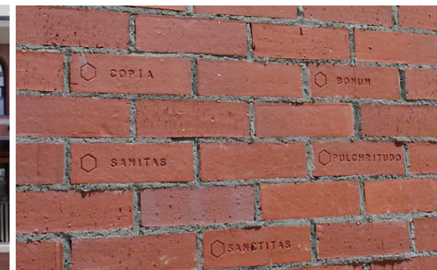
刻印のあるレンガディテール