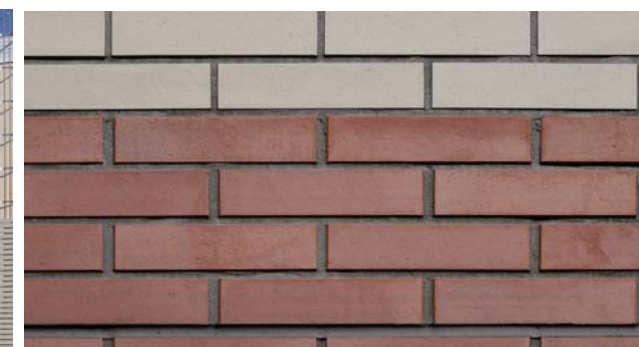
タイルディテール