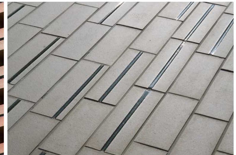
内床タイルディテールアップ