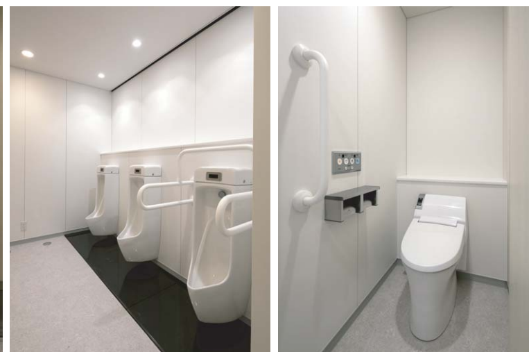
小便器、大便器ともに優れた節水・節電機能を搭載したセンサー一体形の器具。学内全体に採用されたことで大幅な省エネ効果が期待できる。