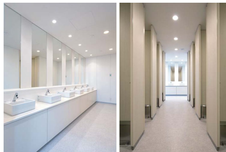
学生使用がメインの講義棟トイレは白基調の清潔感ある空間。洗面器はコンパクトサイズのベッセル式。カウンター上部には小物などの置き場に便利なドライエリアを確保。