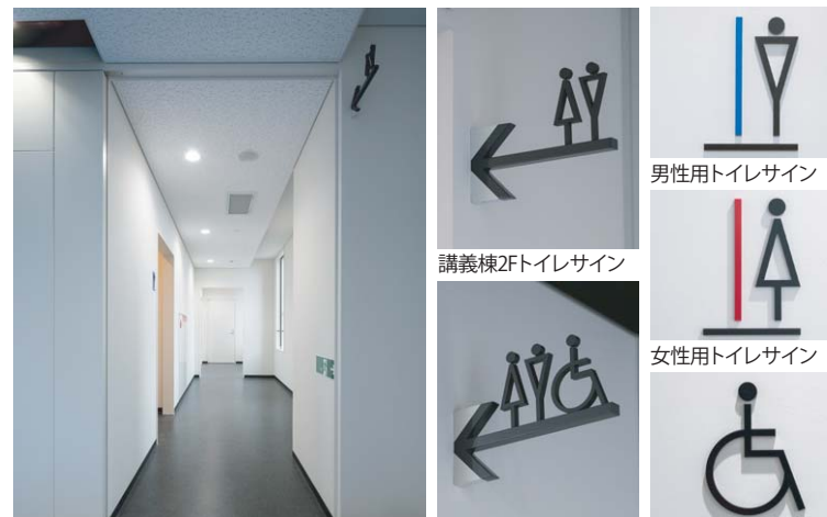
講義棟1Fトイレ入り口 講義棟1Fトイレサイン 多目的トイレサイン 廊下に見えるトイレ入り口には遠くからでも認識しやすい立体的なデザインのサインが、男性用・女性用・多目的の各入り口には室別のサインが掲示されている。