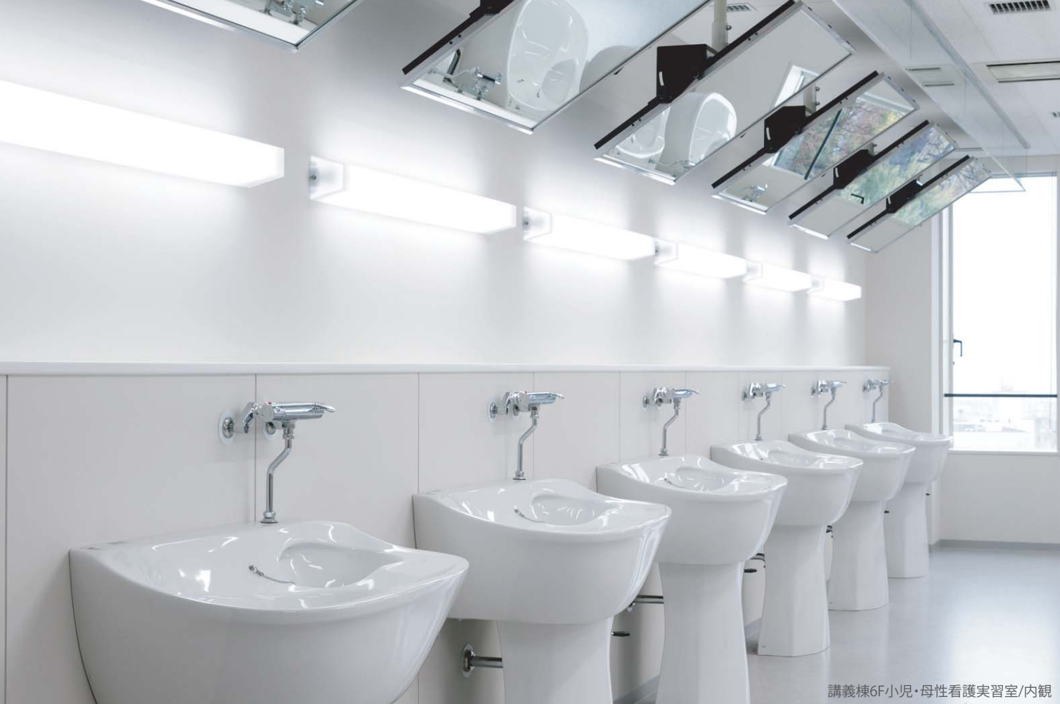
講義棟6F小児・母性看護実習室/内観