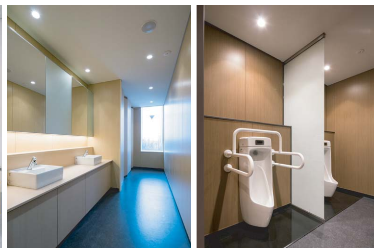
学長室や教員室、会議室などが配置された、大学運営の中核的な役割を持つ管理棟。学外からの来客が多いことを踏まえ、落ち着いた雰囲気とされている。