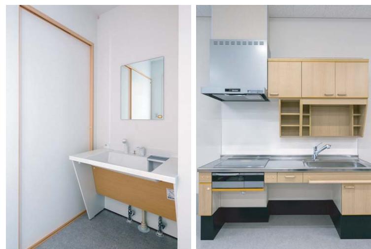
専門講義用に、乳児用バスを備えた沐浴実習室や、キッチン・洗面などの水まわり設備を備えた在宅看護実習室なども設置されており、実践的な学習環境が整えられている。