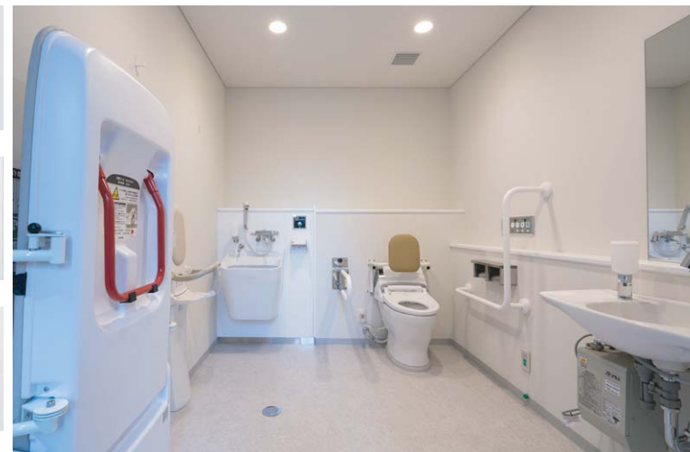
広めの空間に車いす対応のセンサー一体型大便器、車いす対応洗面器、オストメイト対応流し、ユニバーサルベッド、ベビーキープが設置された、充実設備の多目的トイレ。