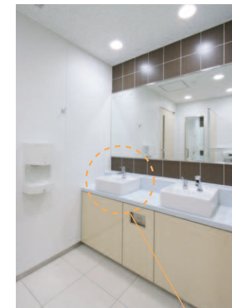
洗面カウンターまわり