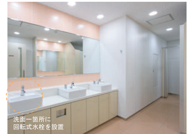
内観/ 洗面カウンターまわり