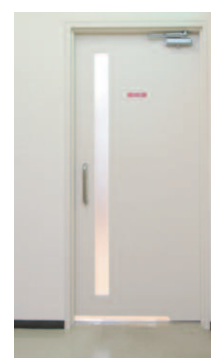
女性用トイレ入り口