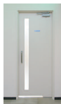
男性用トイレ入り口