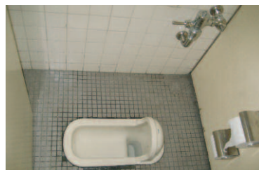
和風大便器ブース