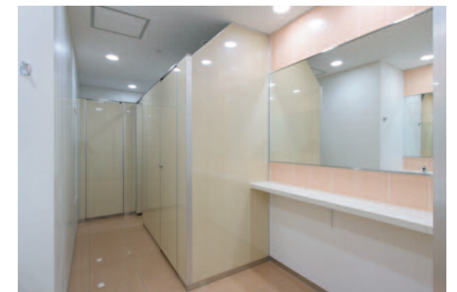
内観/ パウダーコーナー