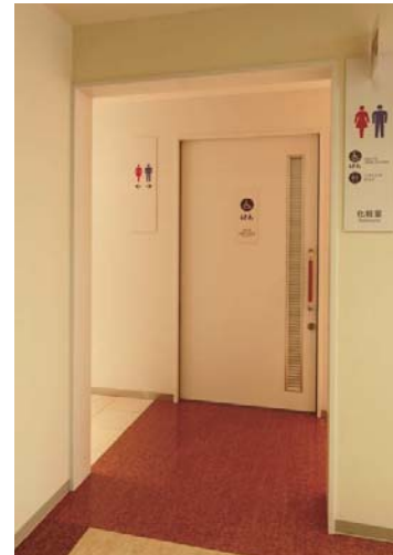
3条館1階 入り口まわり