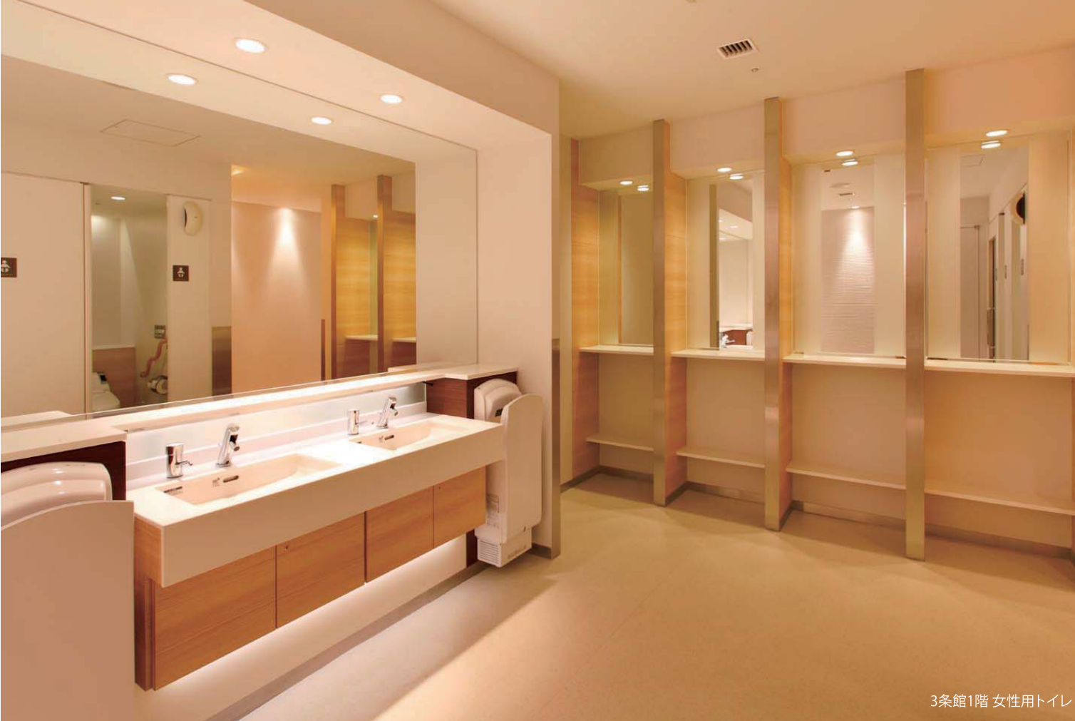
3条館1階 女性用トイレ