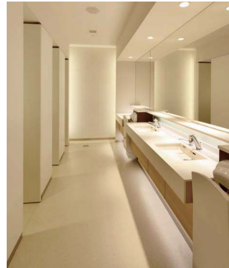
2条館地下1階 女性用トイレ

白と明るい木目調で統一された、ナチュラルで落ち着く空間に、女性用トイレを広くとるレイアウトに変更し、パウダーコーナーや子どもと一緒に利用できるブースの設置など女性利用者に配慮した機能をもたせた。また、男女ともに大便器はすべてセンサー一体形の洋風大便器に変更した。