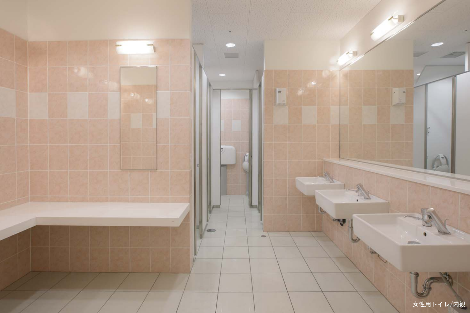
女性用トイレ/内観