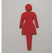
女性トイレサイン