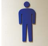
男性トイレサイン