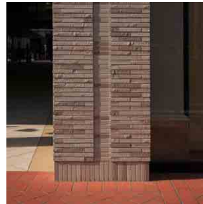
タイルディテールアップ