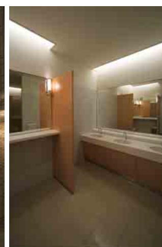
女性用トイレ洗面