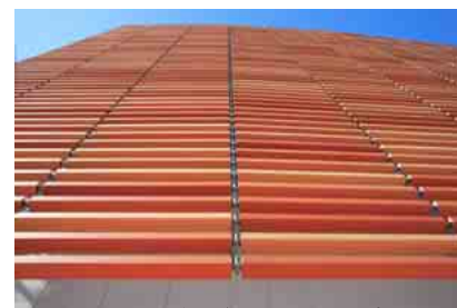
テラコッタルーバーディテールアップ