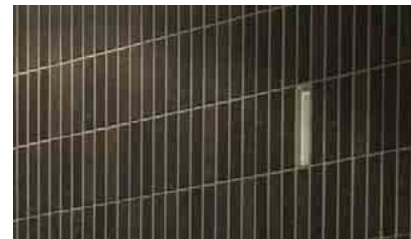
タイルディテールアップ