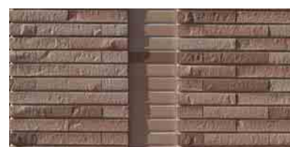
タイルディテールアップ