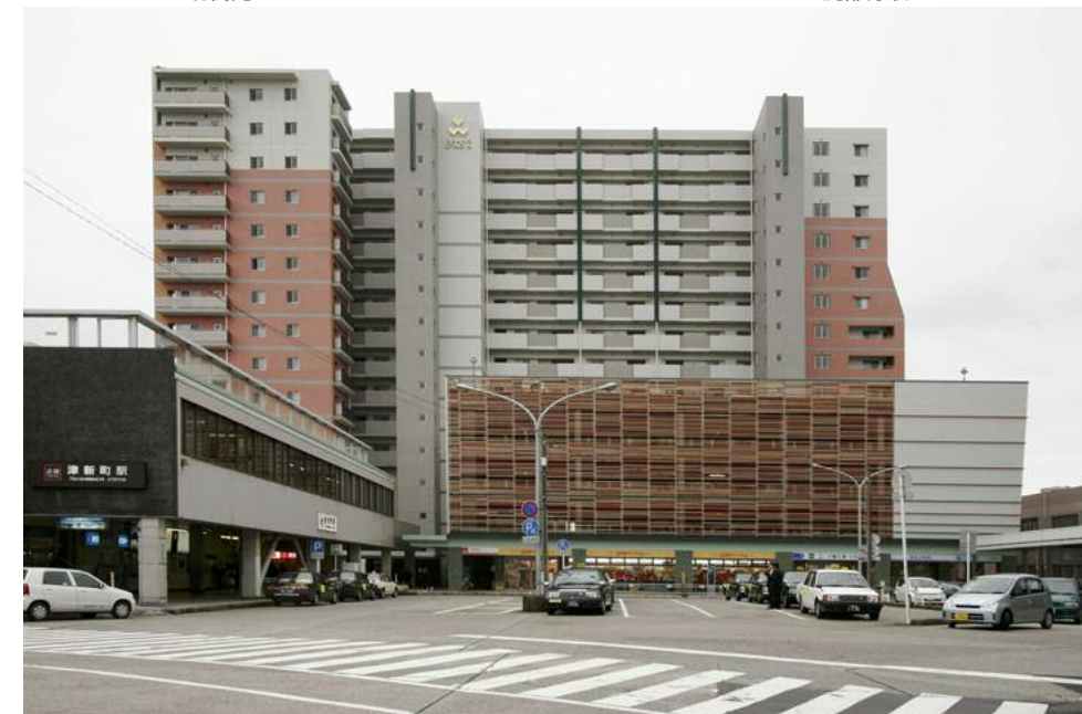
北側津新町駅前全景