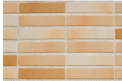
タイルディテールアップ