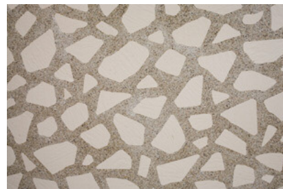
割り石タイルディテールアップ