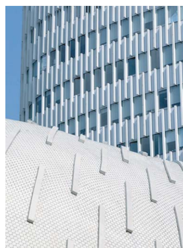
外装壁ディテール