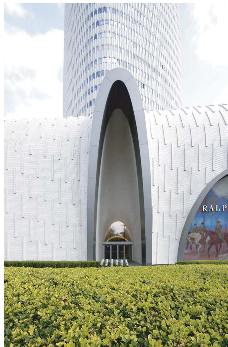
商業施設エントランス