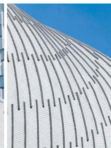
外装壁ディテール