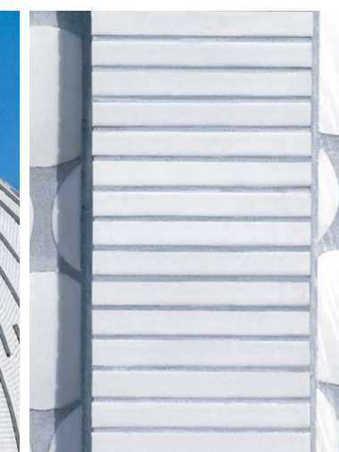
タイルディテール