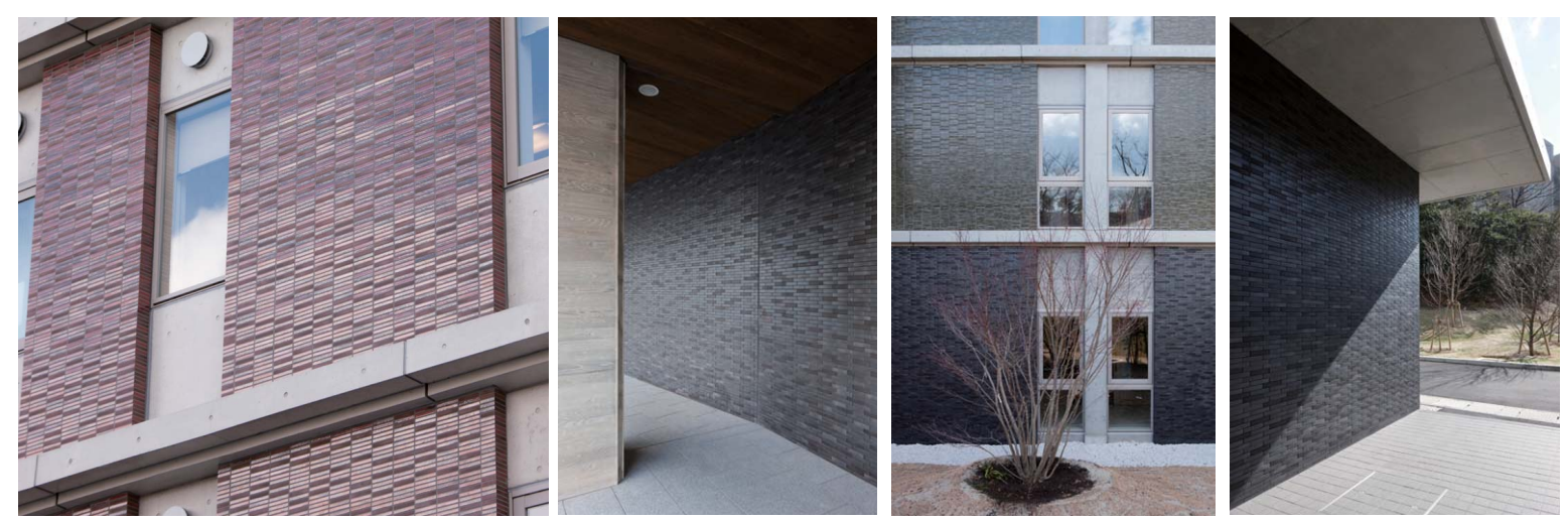
近景 近景 近景 近景