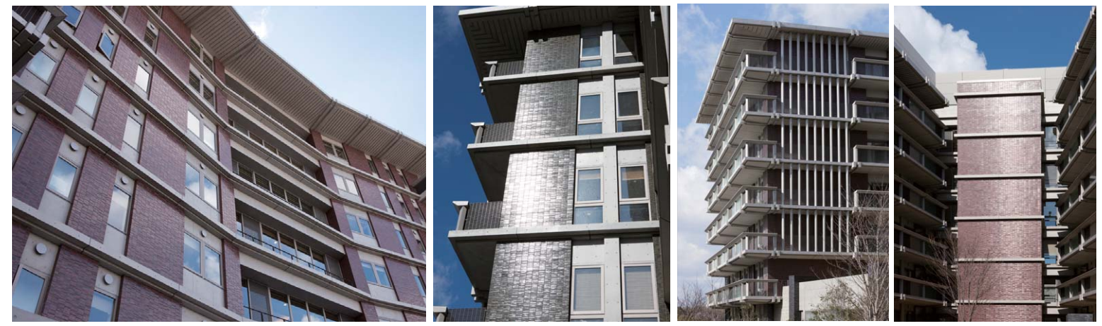
中景 見上げ 全景 全景