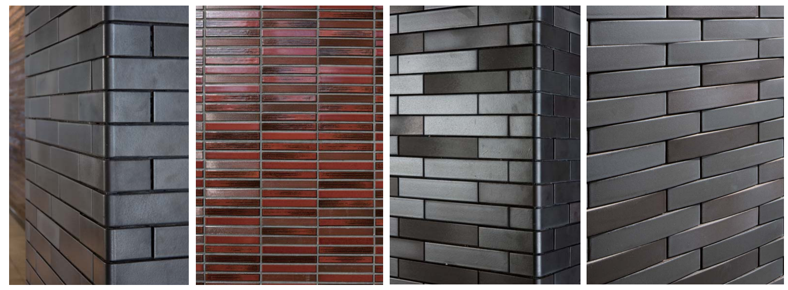
コーナータイルディテールアップ タイルディテールアップ タイルディテールアップ タイルディテールアップ