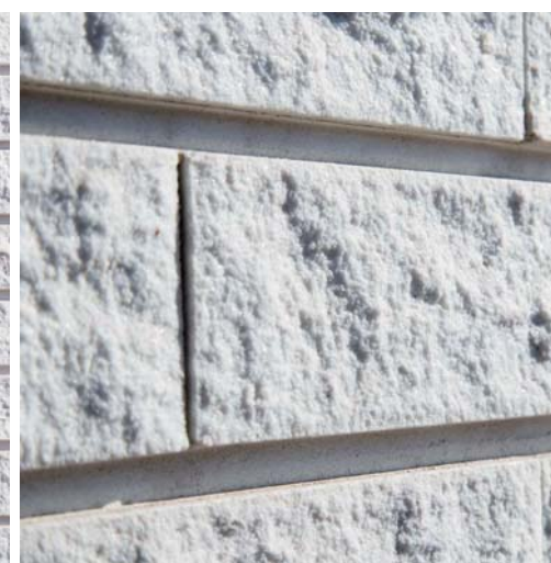
外壁タイルディテールアップ