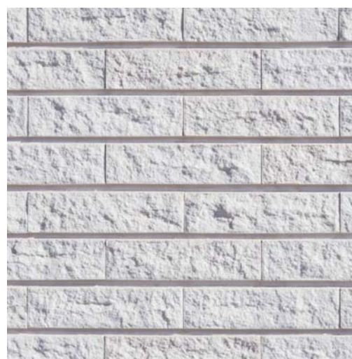
外壁タイルディテール