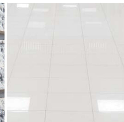
内床タイルディテール