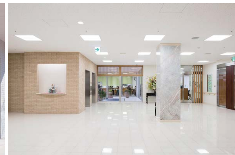
1F エントランス全景