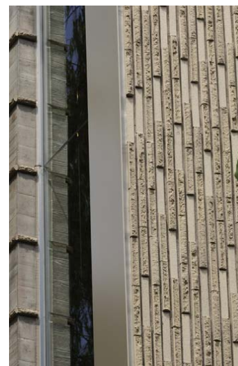
タイルディテール