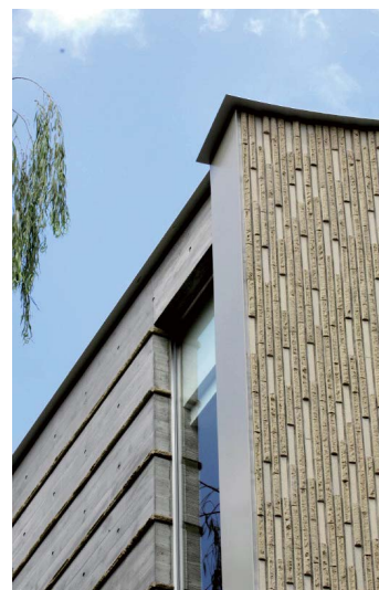
南西側/コーナー部近景