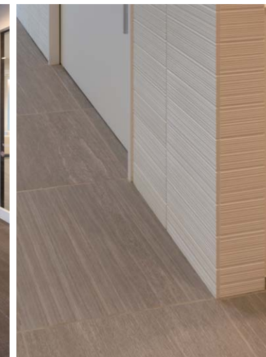
タイルディテール