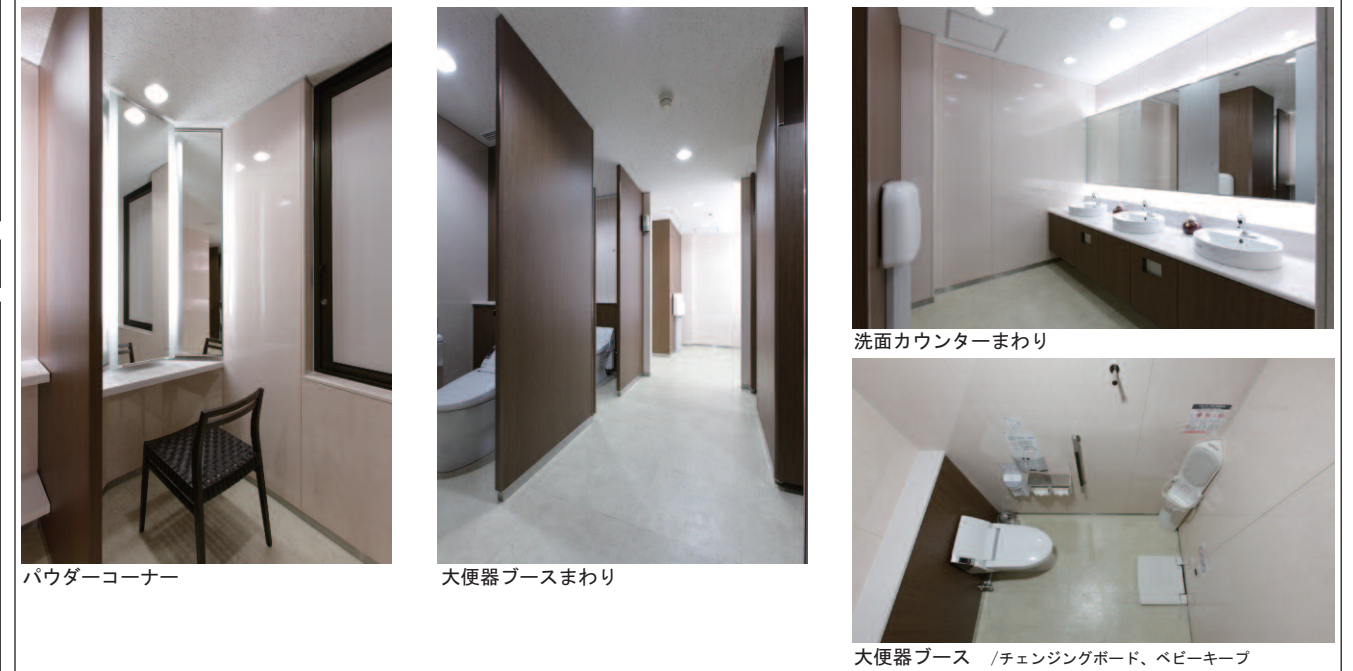
パウダーコーナー