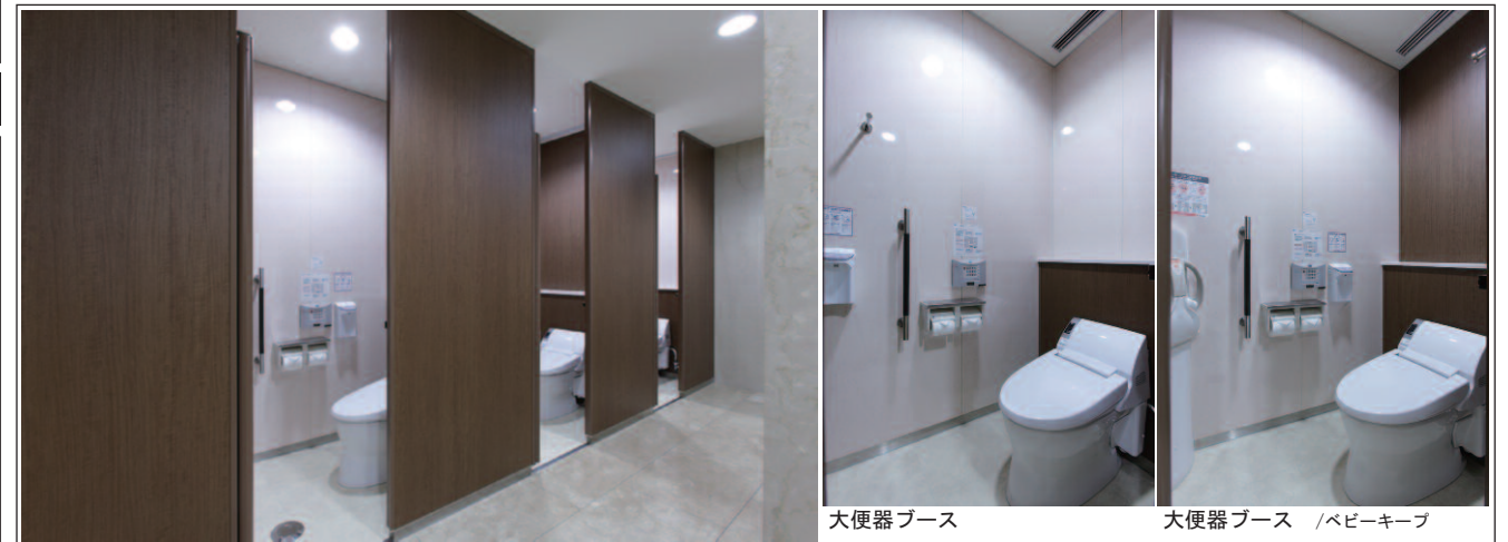
大便器ブースまわり