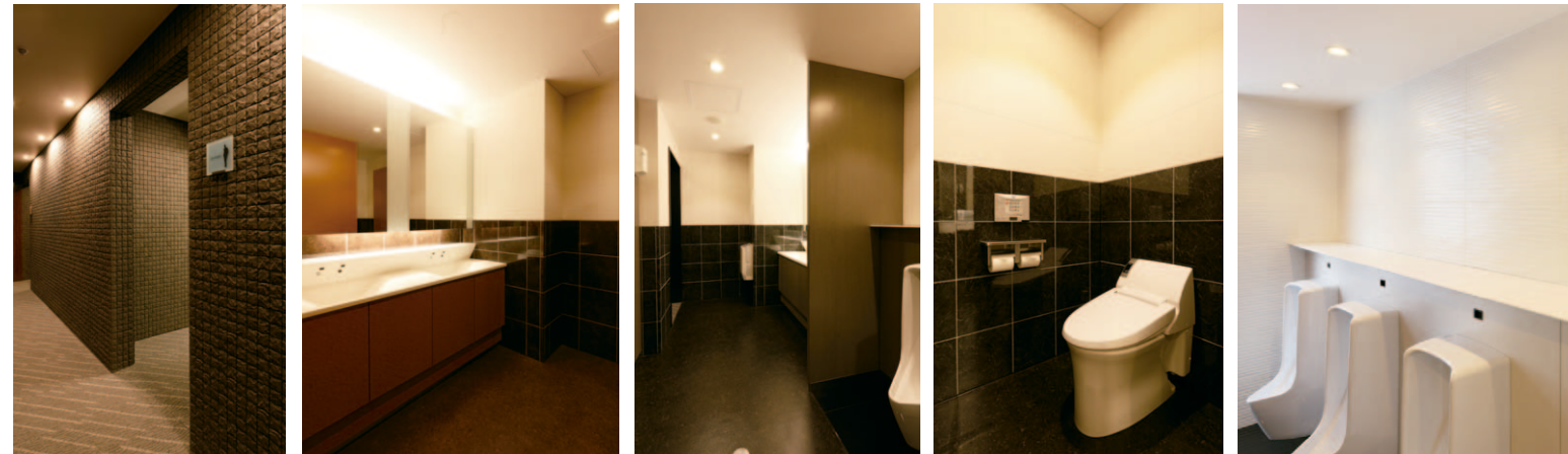
5 F トイレ入り口