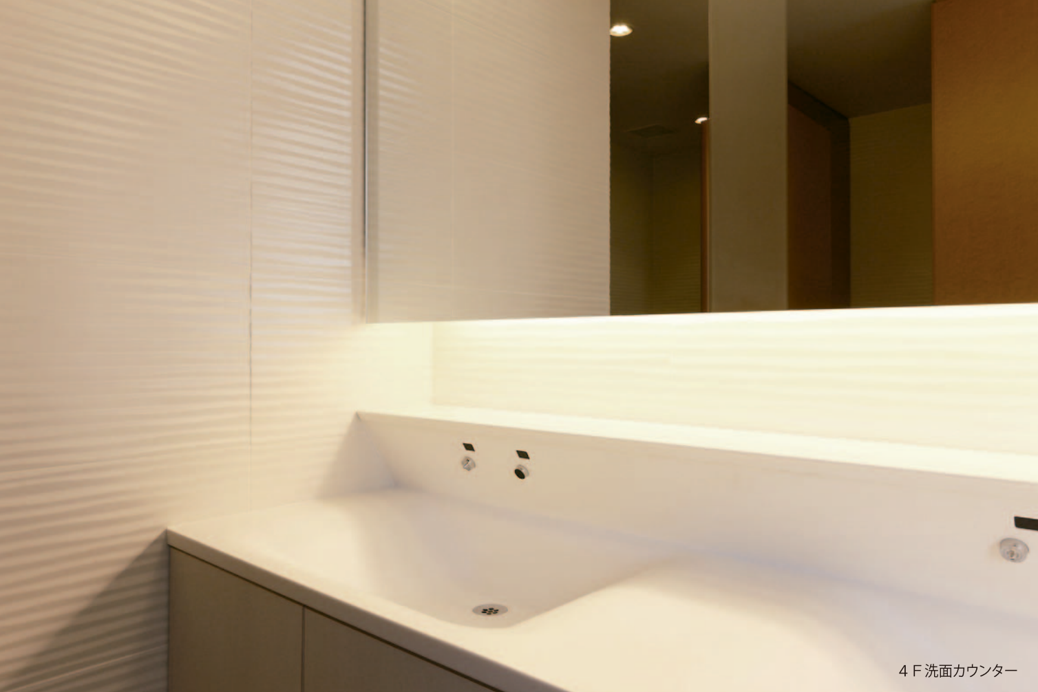
4 F 洗面カウンター