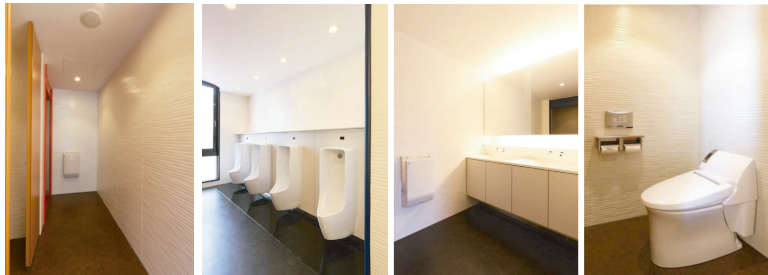
4 F 大便器ブース外