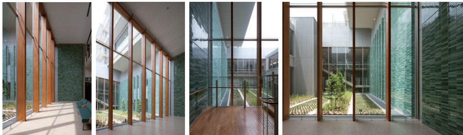
ホール・中庭中景