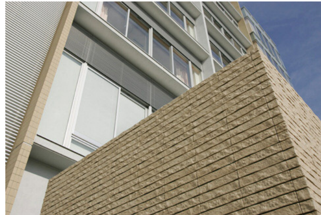
南側 自転車置き場の外壁ディテール